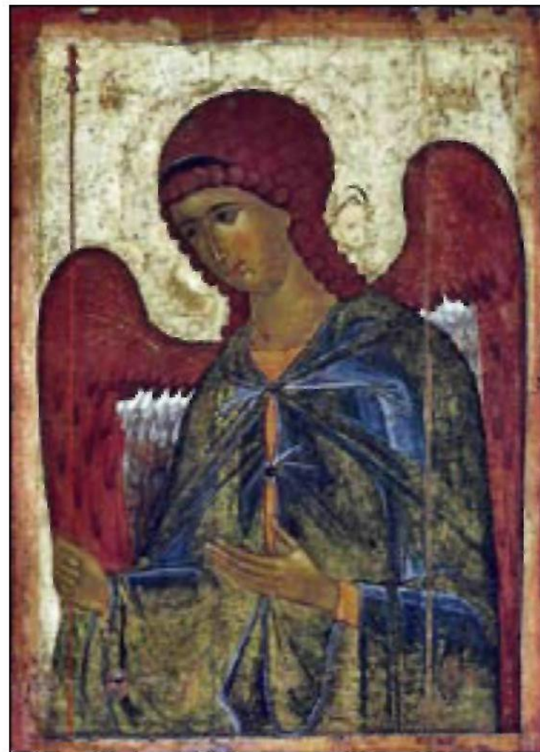
Архангел Гавриїл. Візантія