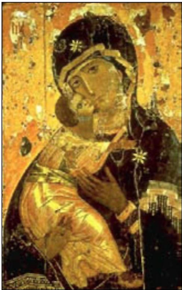
Володимирська ікона Божої Матері. XII ст.