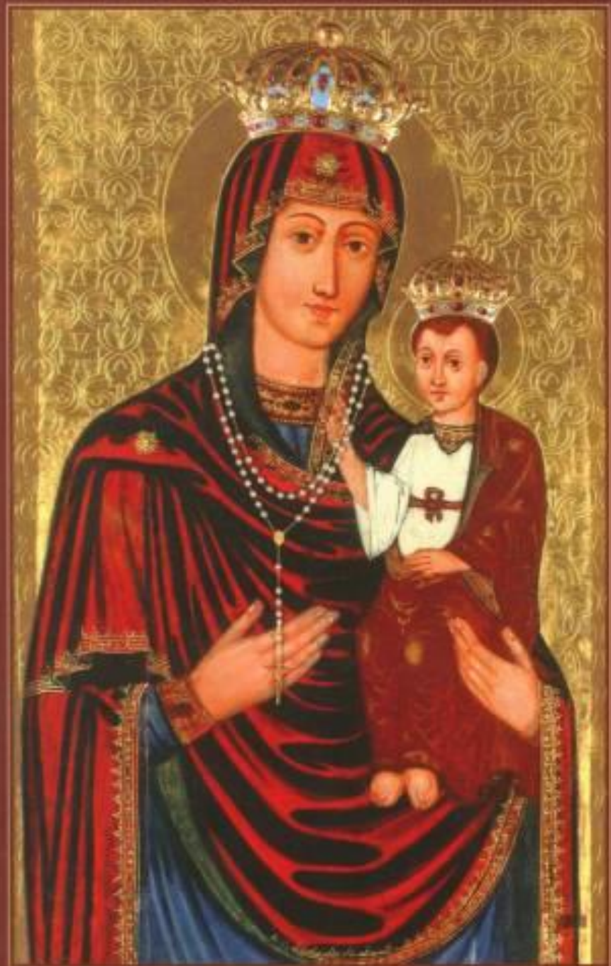
ТЕРЕХОВЛЯНСЬКА ЧУДОТВОРНА ІКОНА БОГОРОДИЦІ