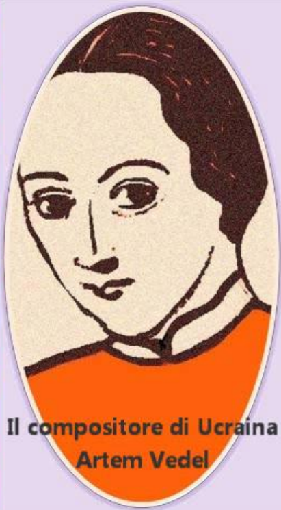
Il compositore di Ucraina Artem Vedel