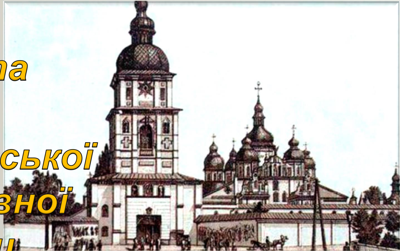
Михайлівський собор – Київ 18-те ст.