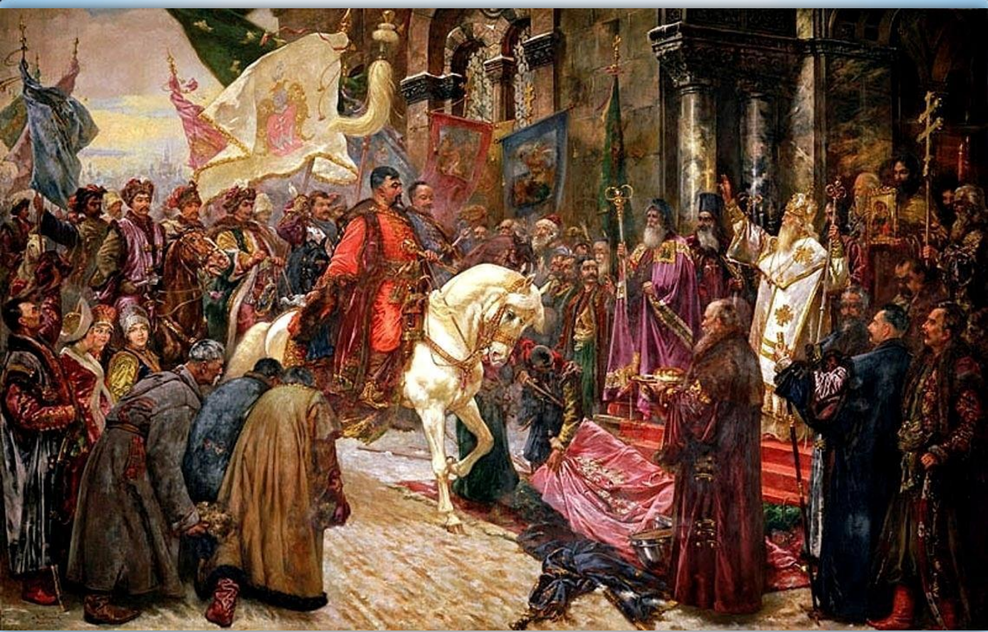
➤ Микола Івасюк, 1904: «В'їзд Богдана Хмельницького у Київ» (1649).