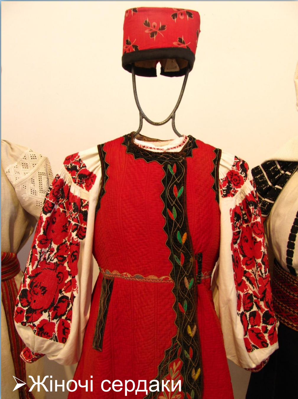
➤ Жіночі сердаки