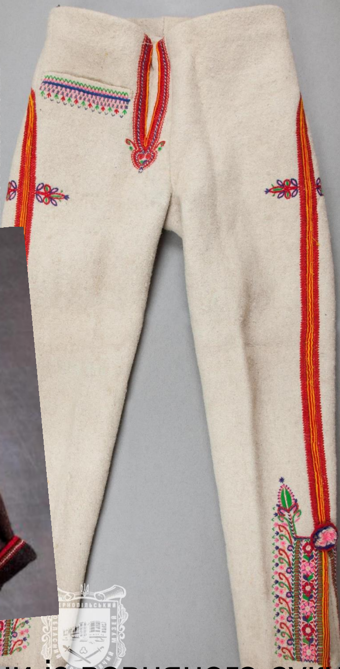
➤ штани із вовняного сукна

ЕТНОГРАФІЧНА КОЛЕКЦІЯ КРОВЕЦЬ krovets.com.ua