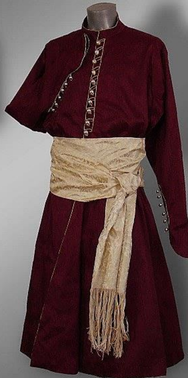
➤ отаманський жупан