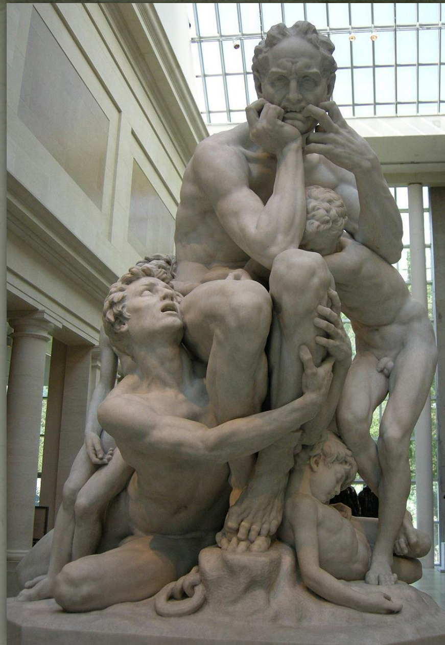
➤ Jean-Baptiste Carpeaux, Уголіно і його сини, 1857–1860 Метрополітальний музей, Нью Йорк.