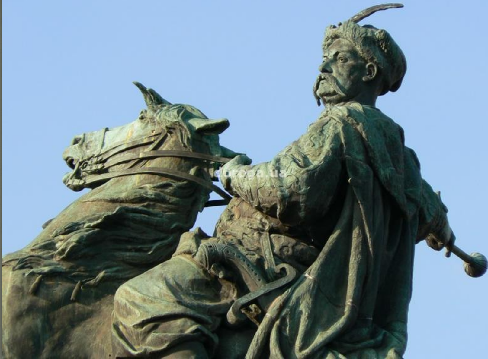
➤ Пам'ятник Богдана Хмельницького, Київ