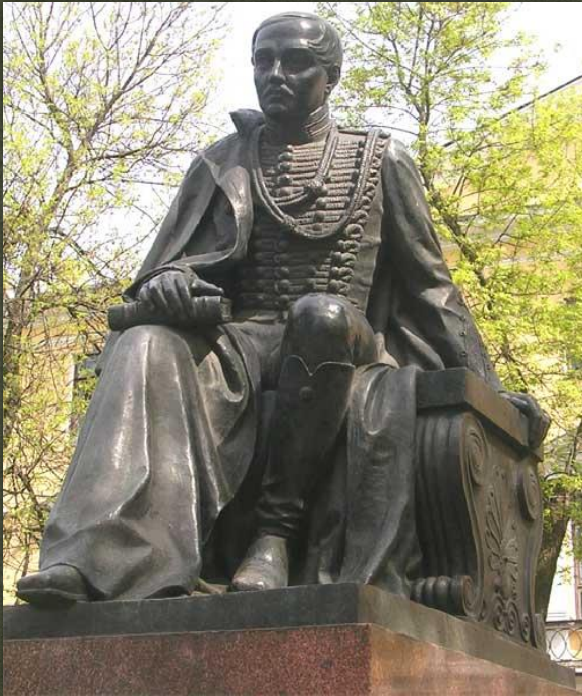
➤ пам'ятник Лермонтову, Київ