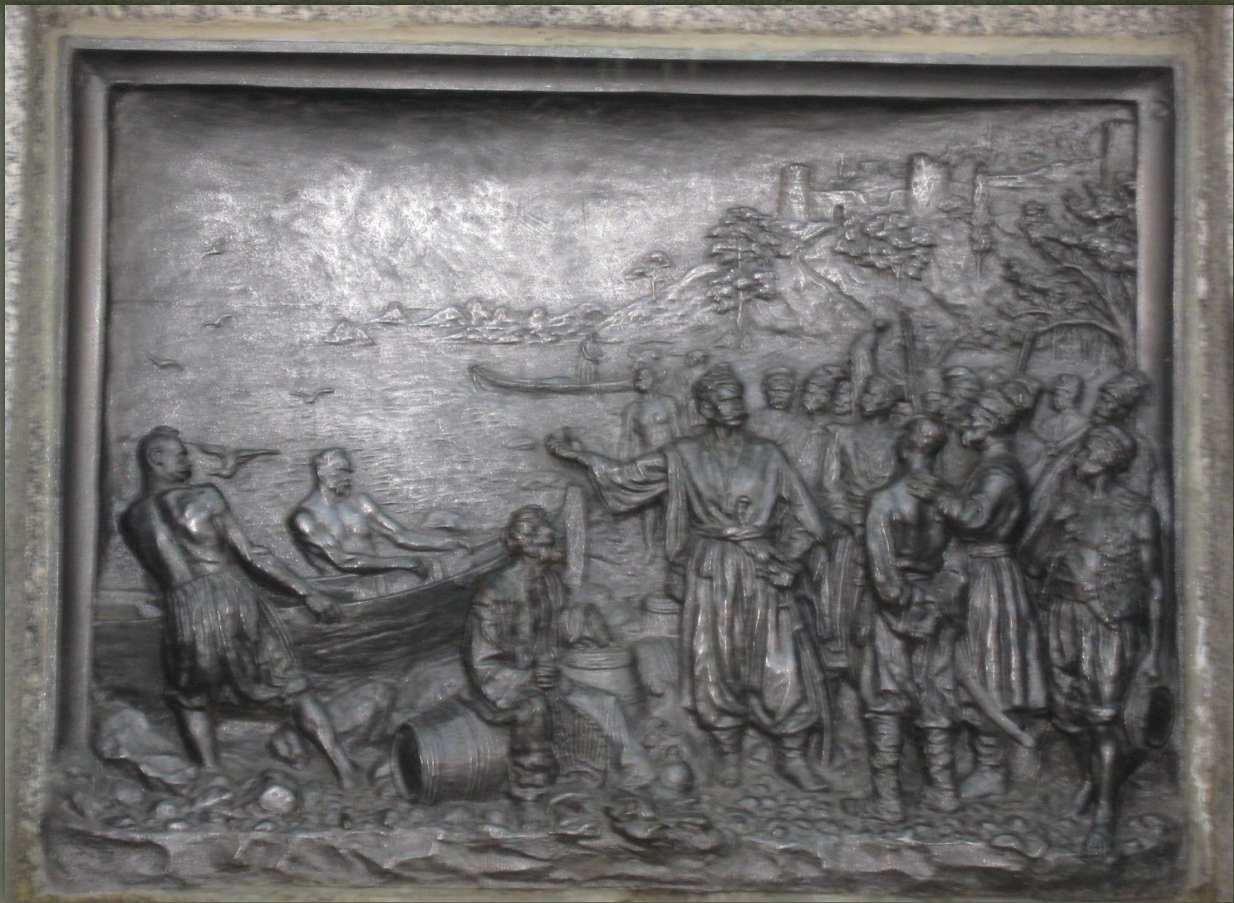
➤ Барелеф, сцена з «Енеїди»