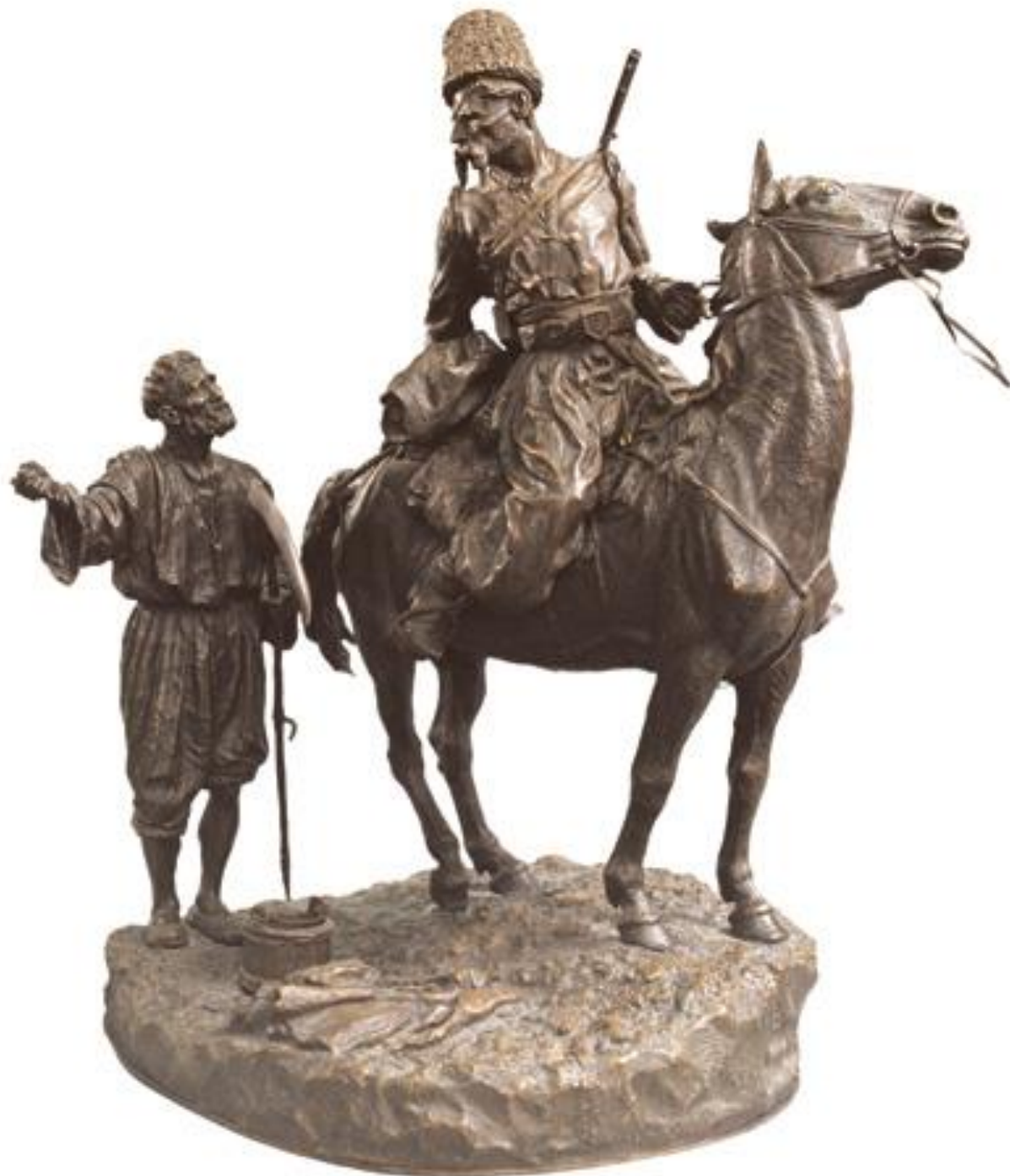
➤ Запорожець на розвідці, 1887.