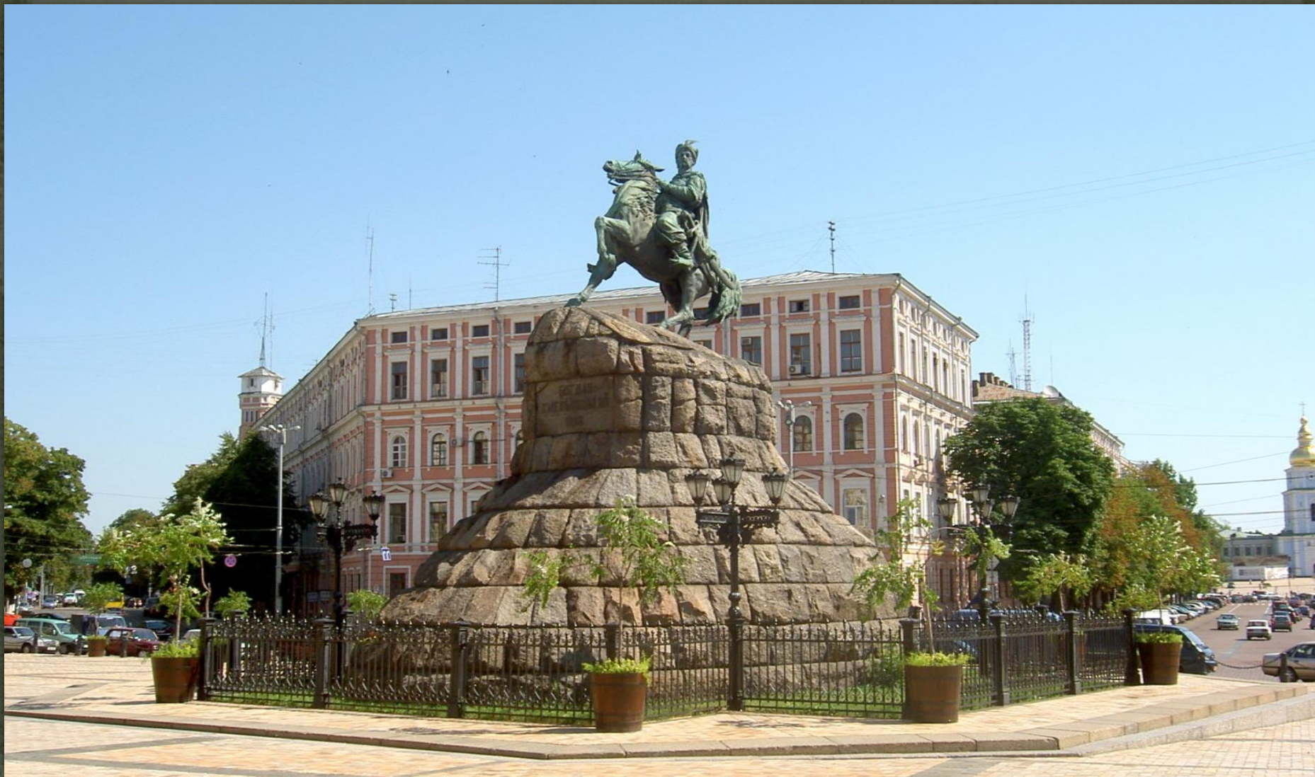
➤ Пам'ятник Богдана Хмельницького, Київ