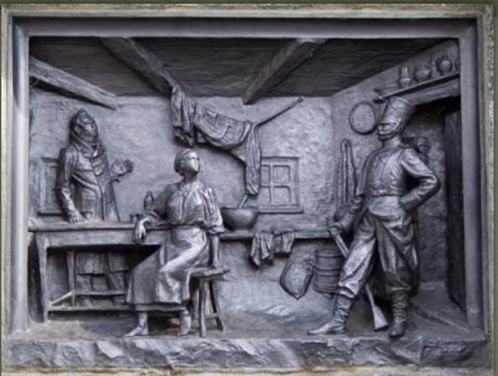
➤ Барелеф, сцена з п'єси «Москаль Чарівник»