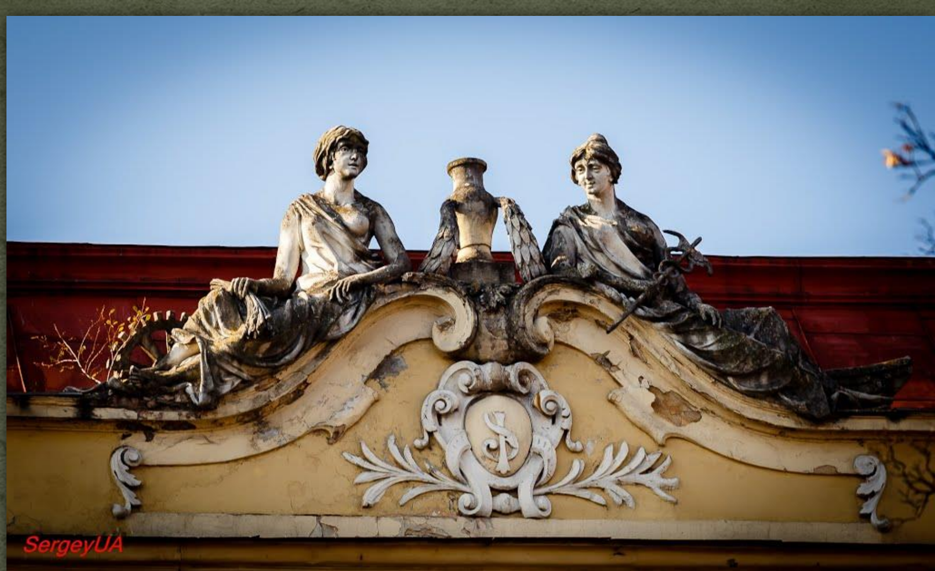
➤ Алегоричні скульптури «Комерція» та «Комунікація», 1909 р..