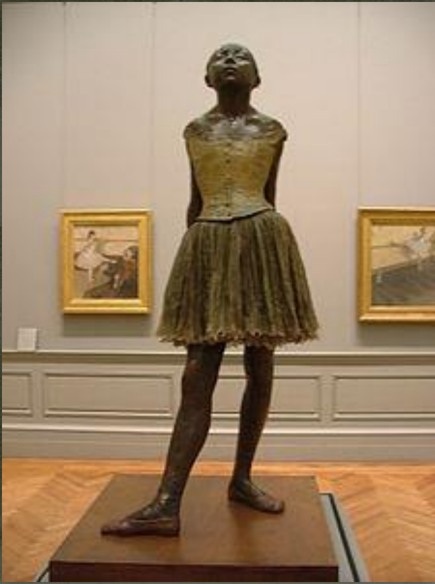
➤ Edgar Degas, Мала Балерина, 1879–80, бронза.