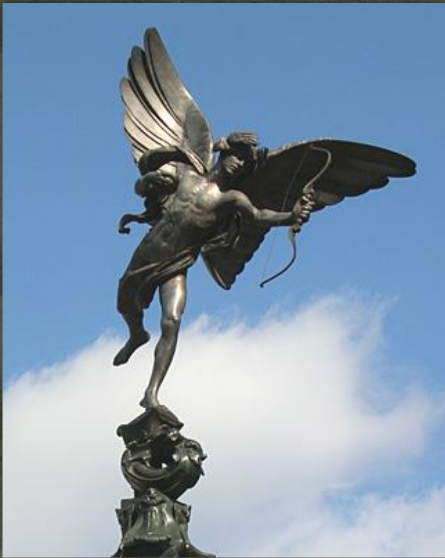
➤ Alfred Gilbert, Ерос, 1893, Лондон.