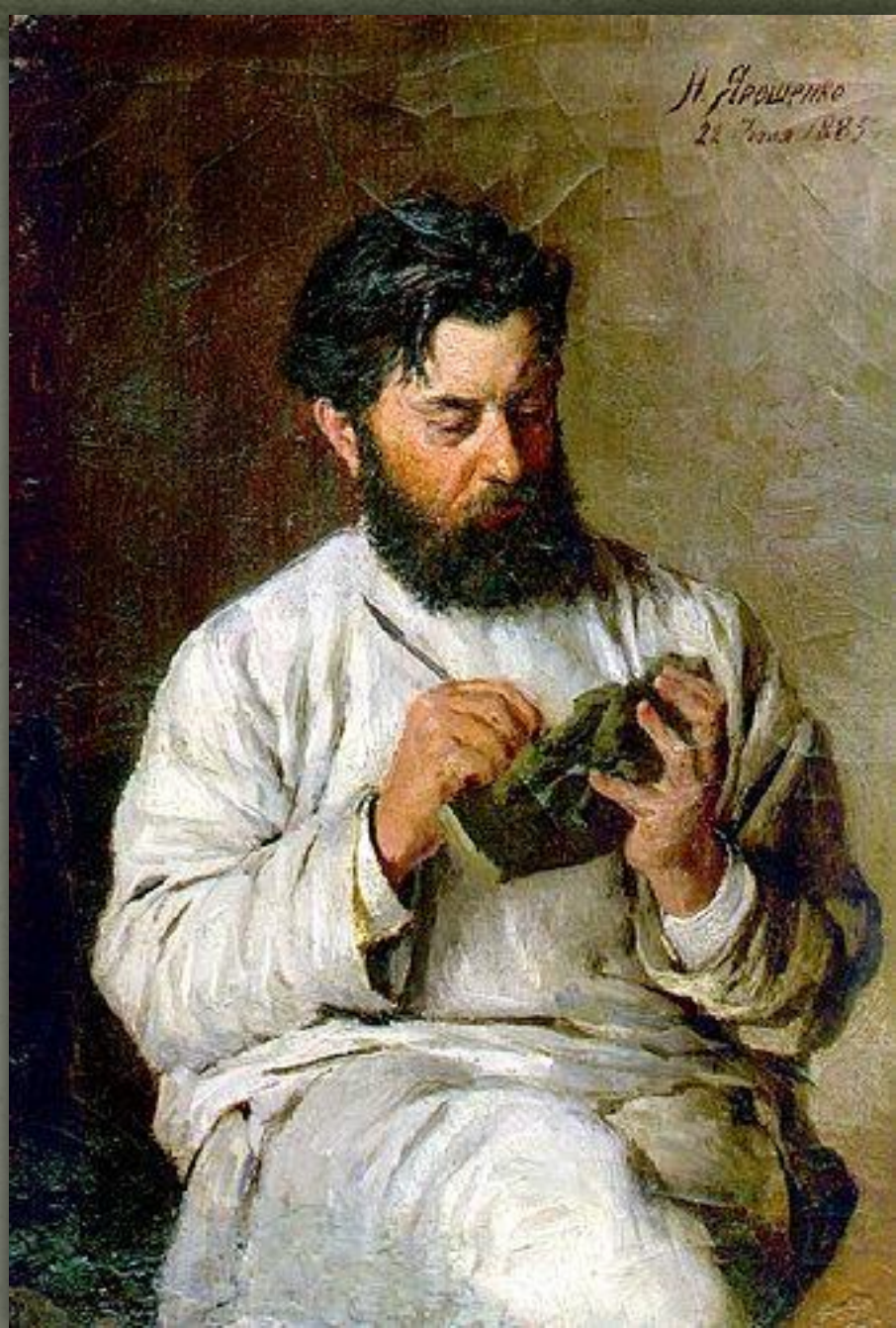
➤ Портрет Л. Позена, Н. Ярошенко, 1883.