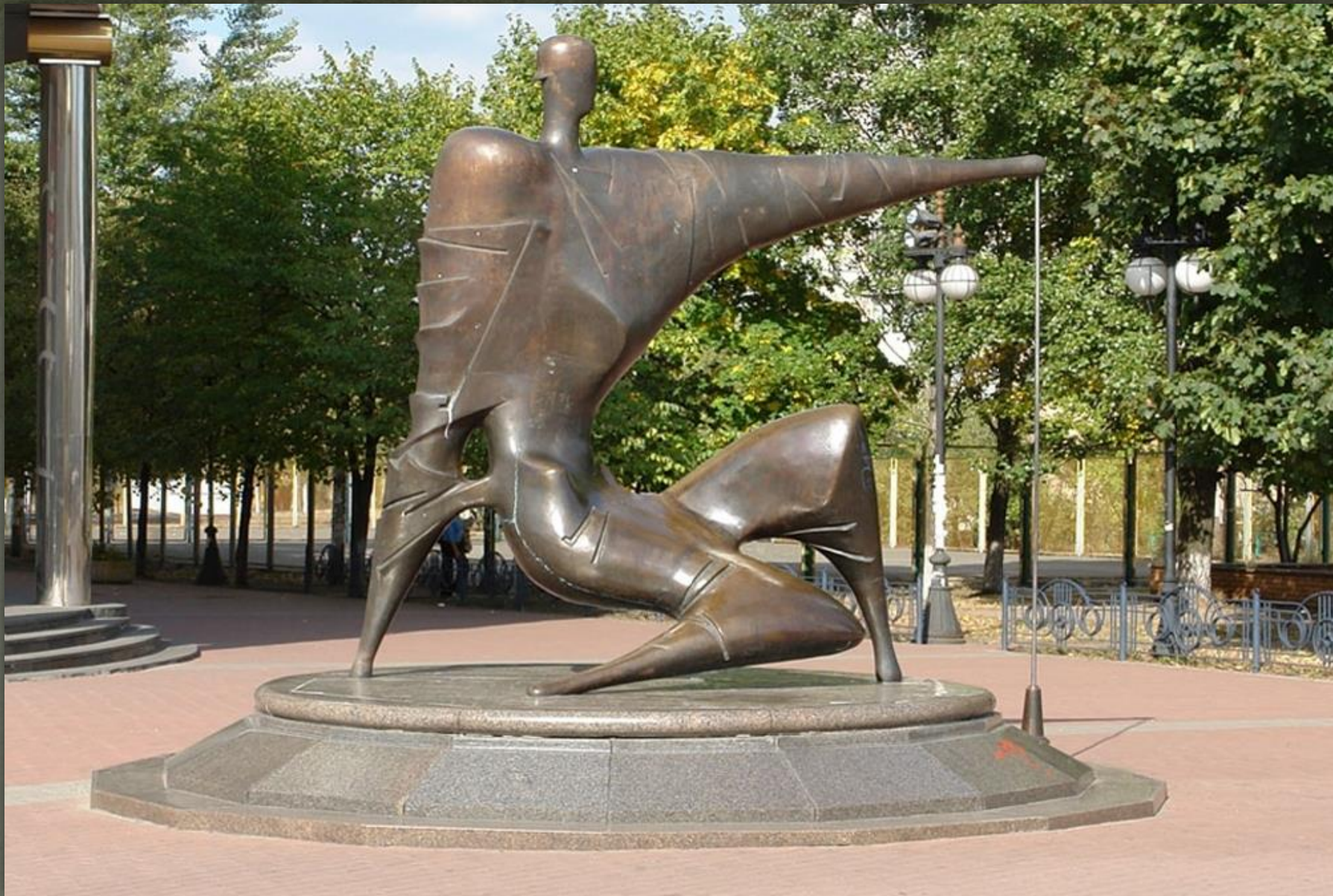
➤ «Будівельник», скульптор Максим Луки, Київ.