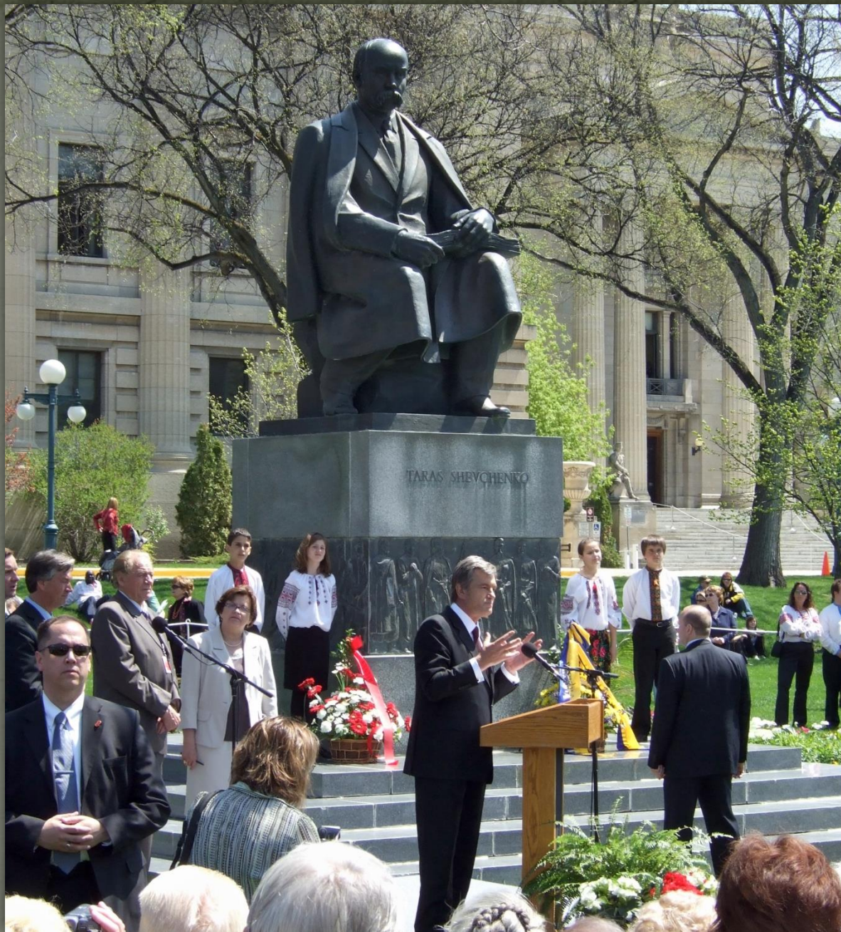
➤ Пам'ятник Шевченку у Вінніпезі, Канада 1961.