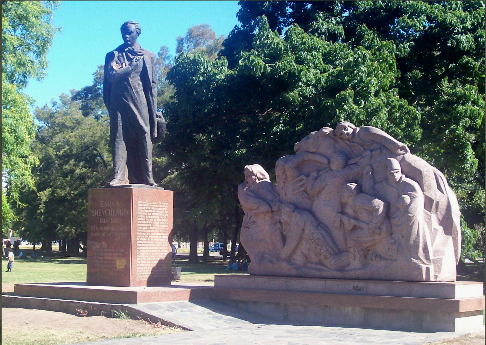
➤ У Буенос Айрес, Аргентина, 1971.