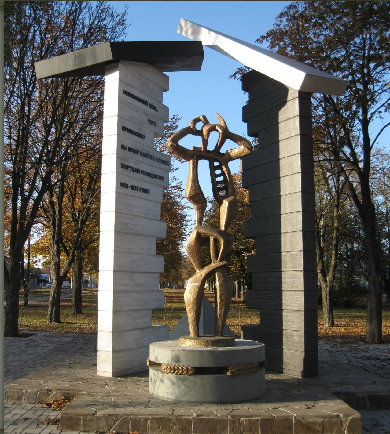
➤ скульптор Олег Прокопчук Суми, 2008.