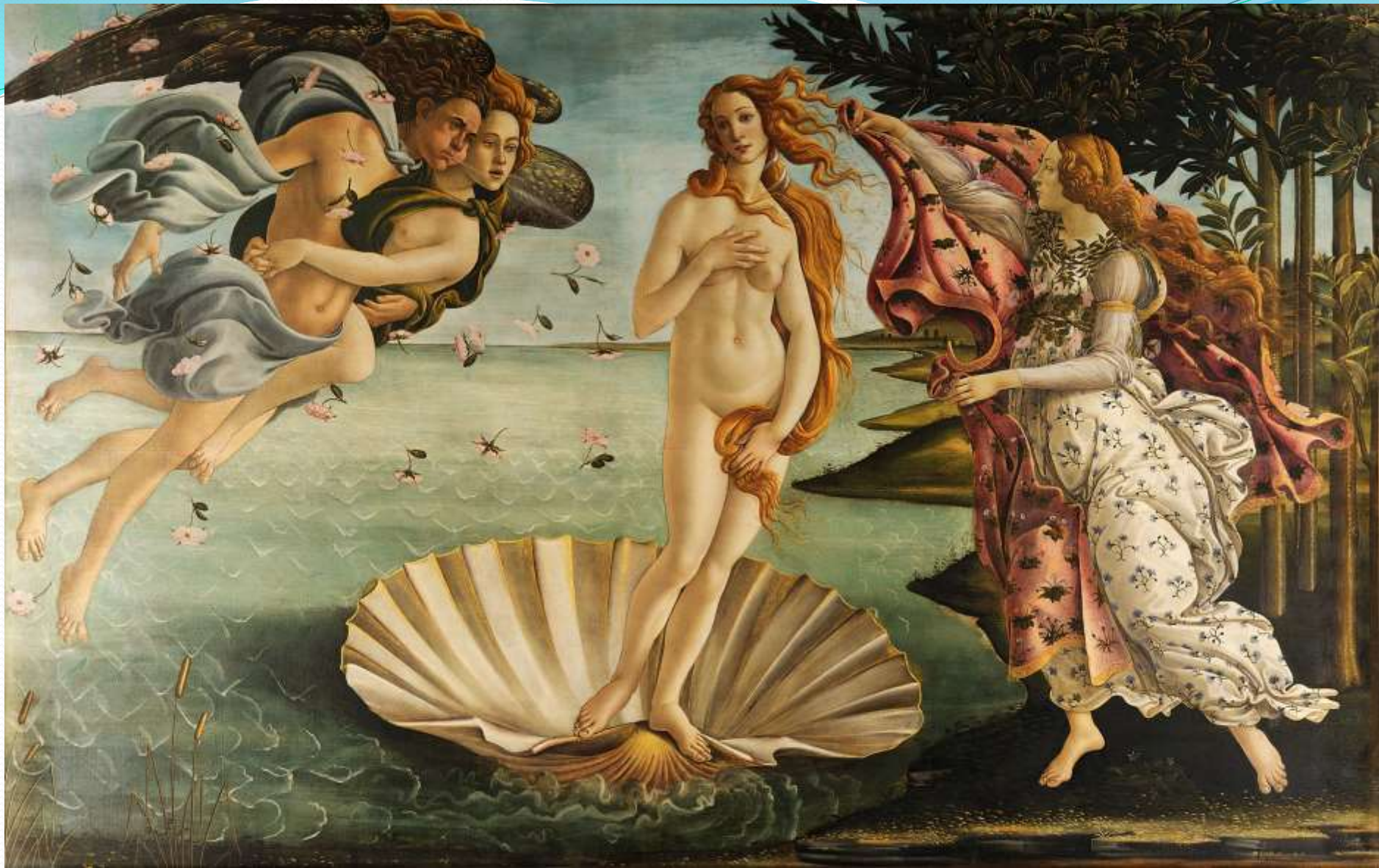
➤ Сандро Боттичеллі, «Народження Венери», Флоренція, 1486.