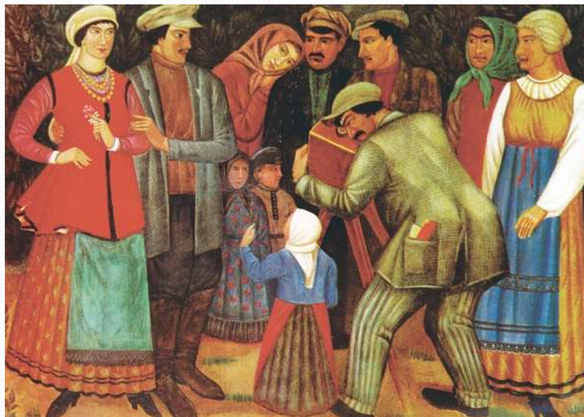
➤ Іван Падалка, «Фотограф», 1927.