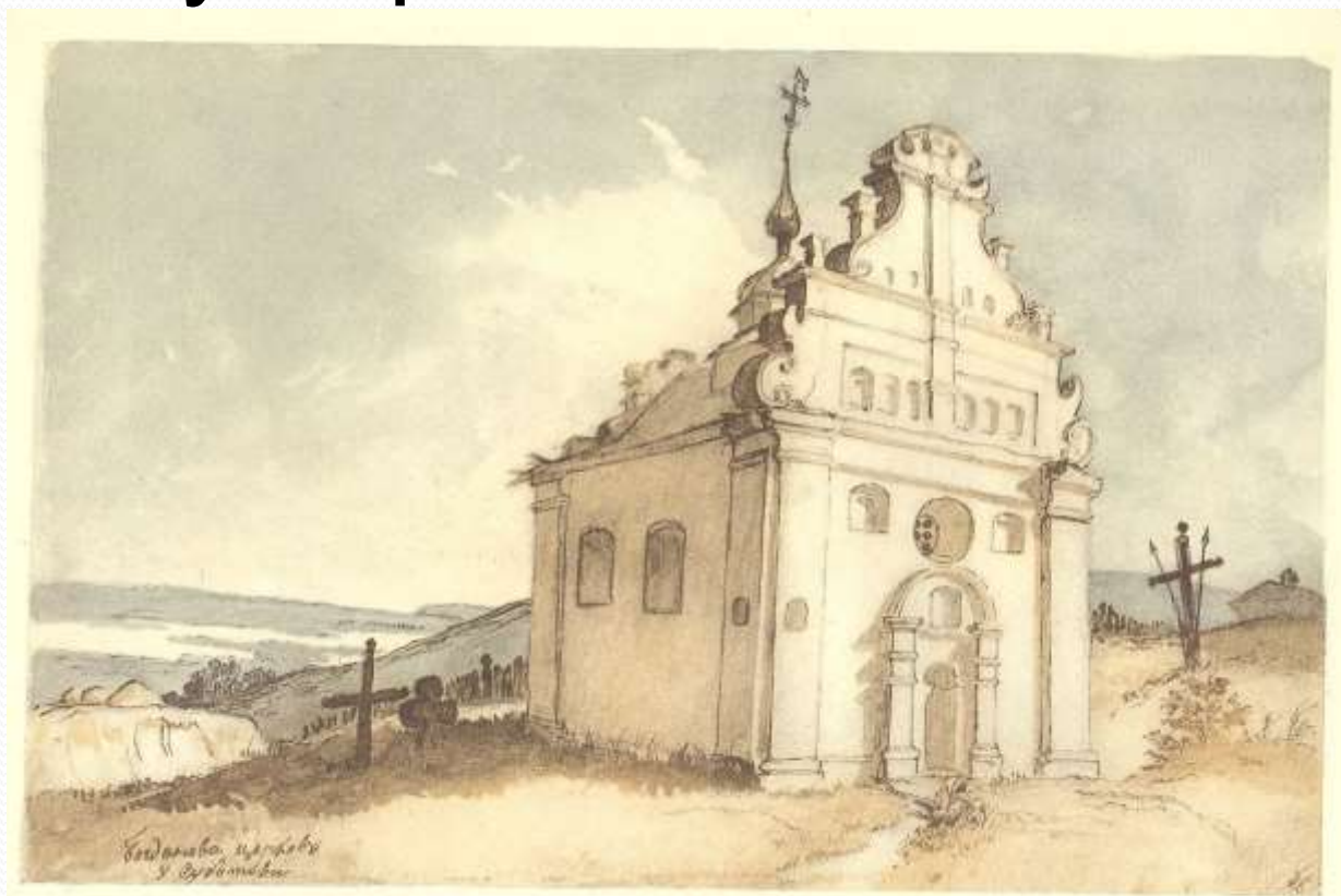
222. БОГДАНОВА ЦЕРКВА В СУБОТОВІ. Акварель. [IV—X 1845]

➤ Тарас Шевченко, «Богданова церква у Суботові», 1845.