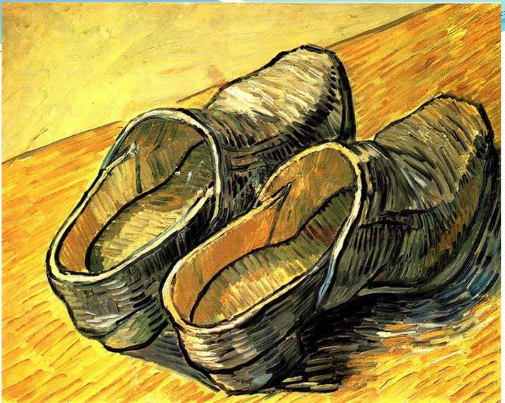
➤ Вінсент ван Гог, «Пара шкіряних черевиків », 1888.