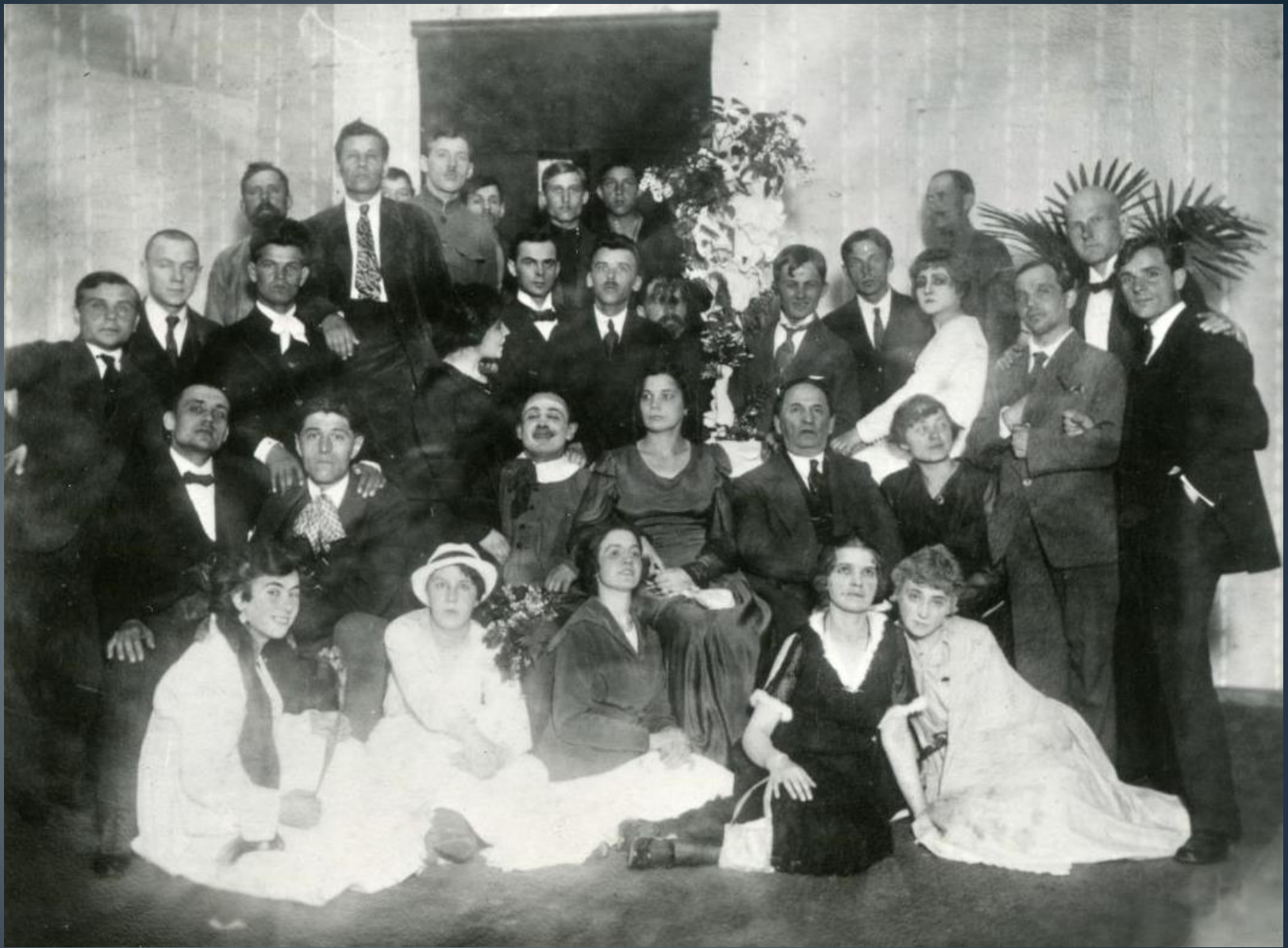
➤ Колектив Київського «Молодого театру» в день закриття 1-го сезону, Київ, 1918 р.