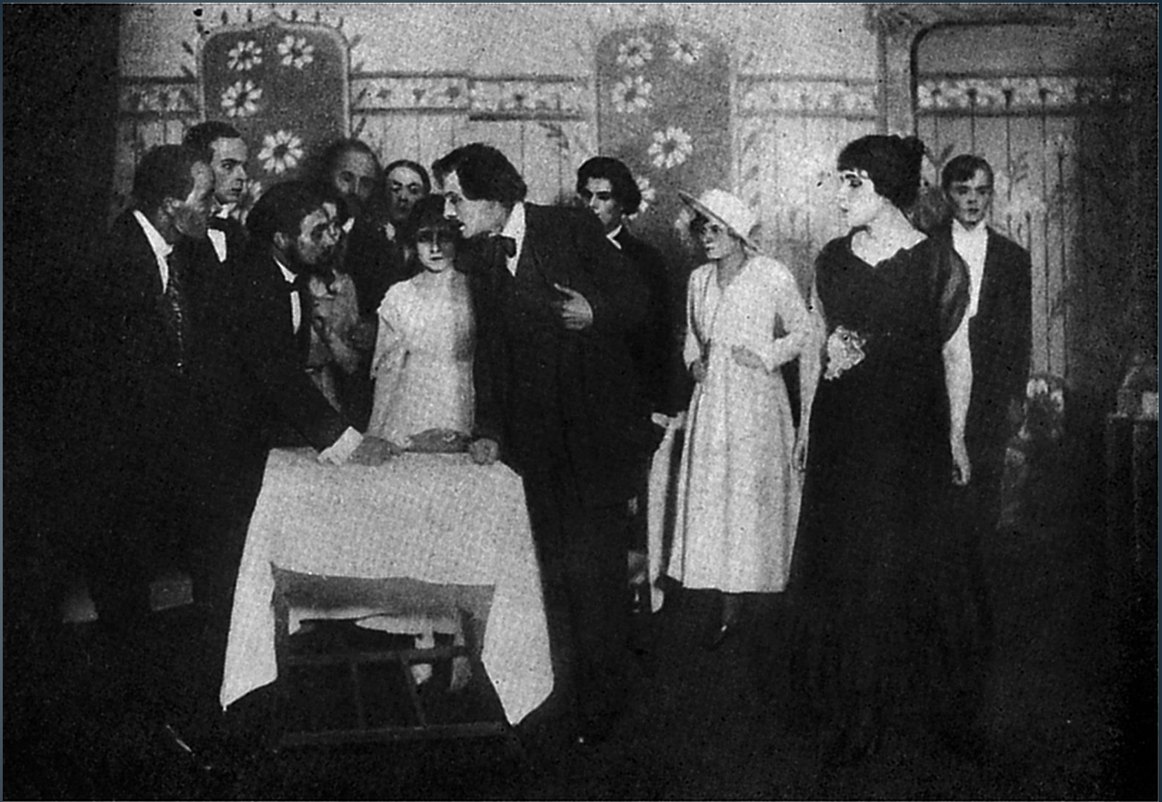
➤ П'єса Володимира Винниченка «Чорна пантера і білий ведмідь». Сцена з вистави Молодого Театру , Київ 1917.