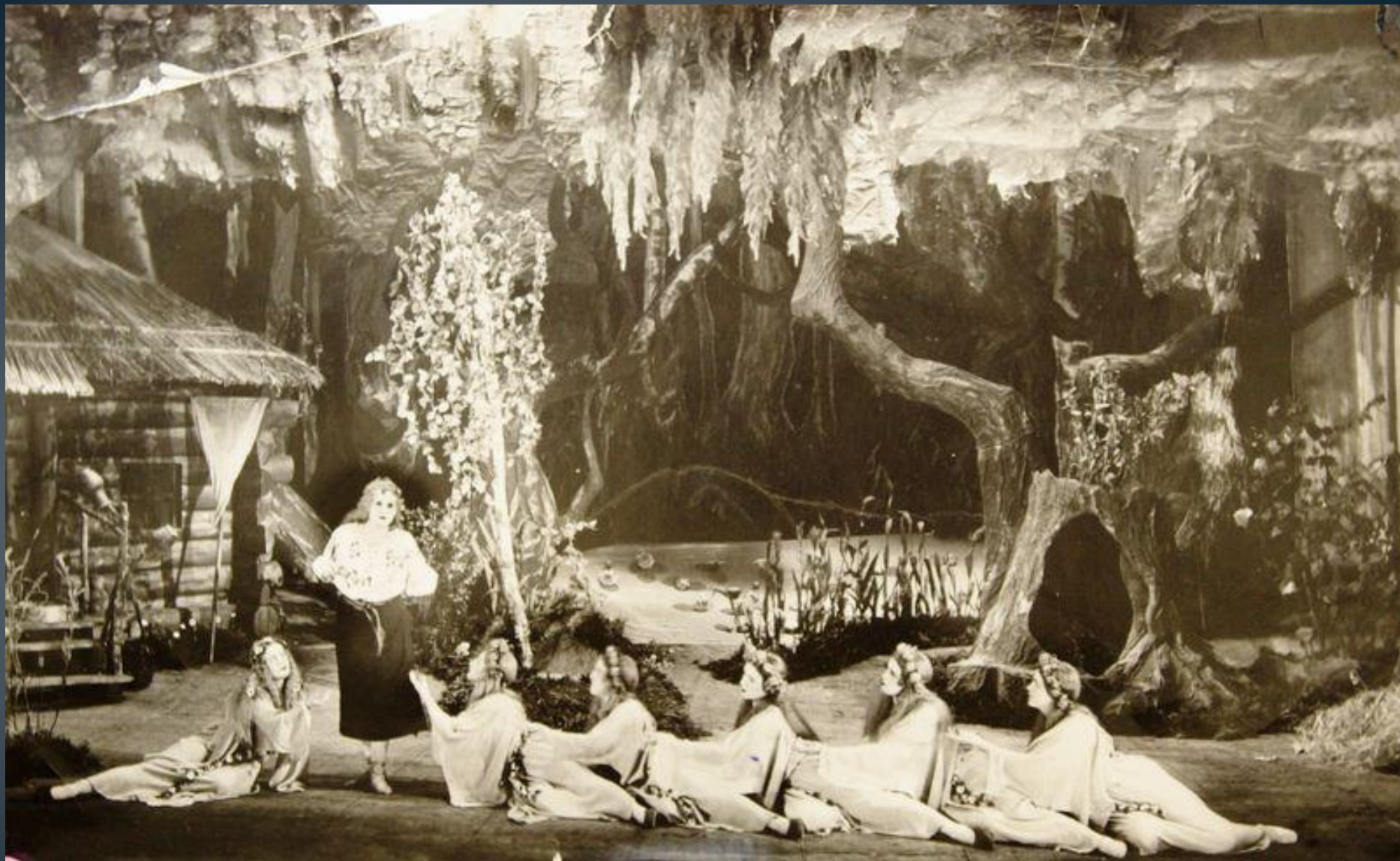
➤ «Лісова пісня» , постановка на сцені. Національний театр ім. М. Заньковецької, Київ, 1938.