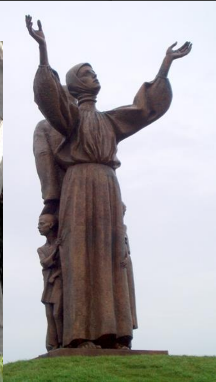
➤ Скульптор О.М. Рідний, Харків, 2008.