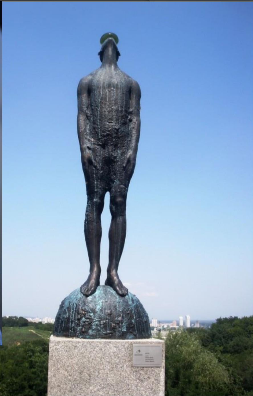
➤ «Дош», Назар Білик, Київ, 2010.