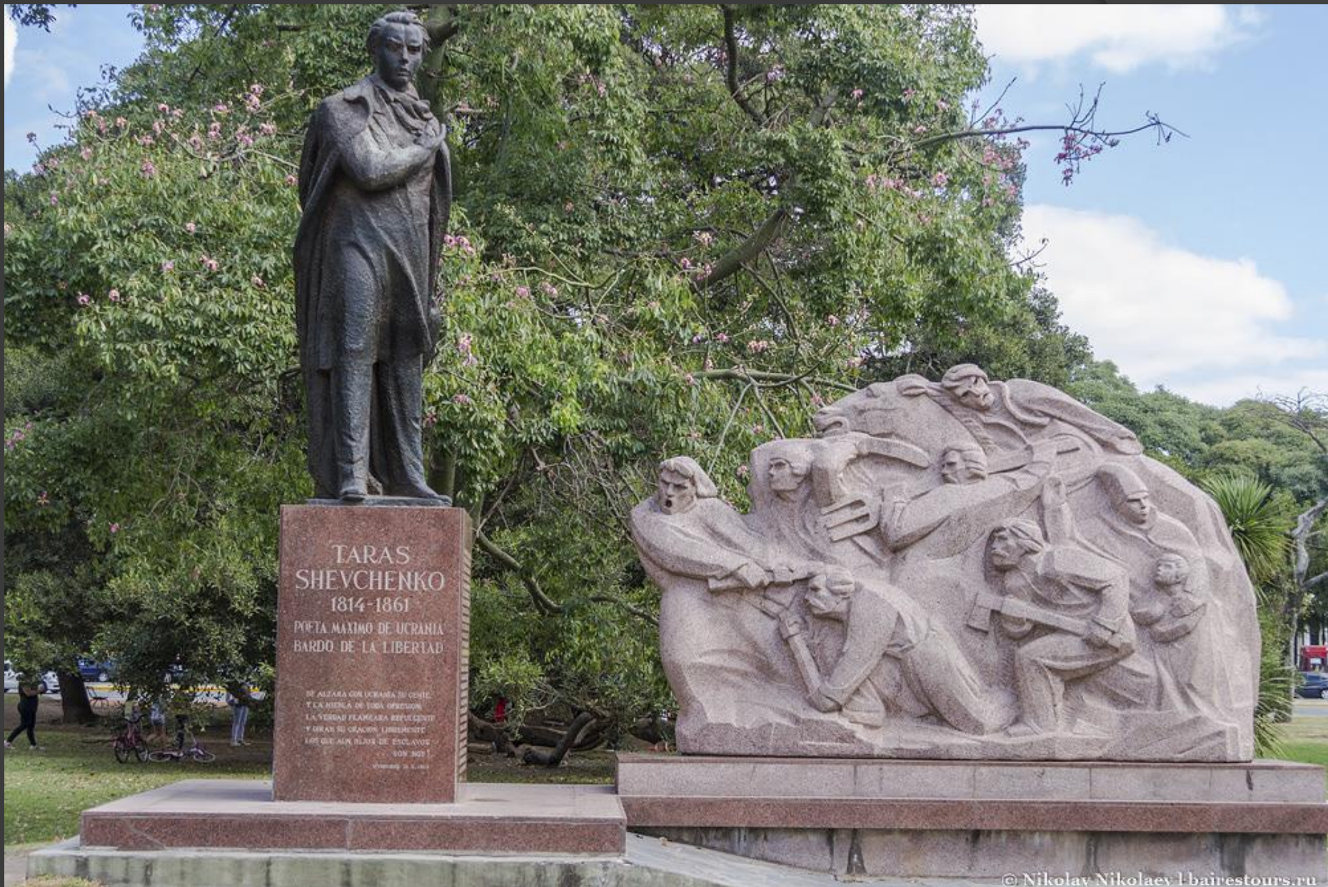
➤ Пам'ятник Т. Шевченку, у Биенос Айрес, Аргентина, 1971.