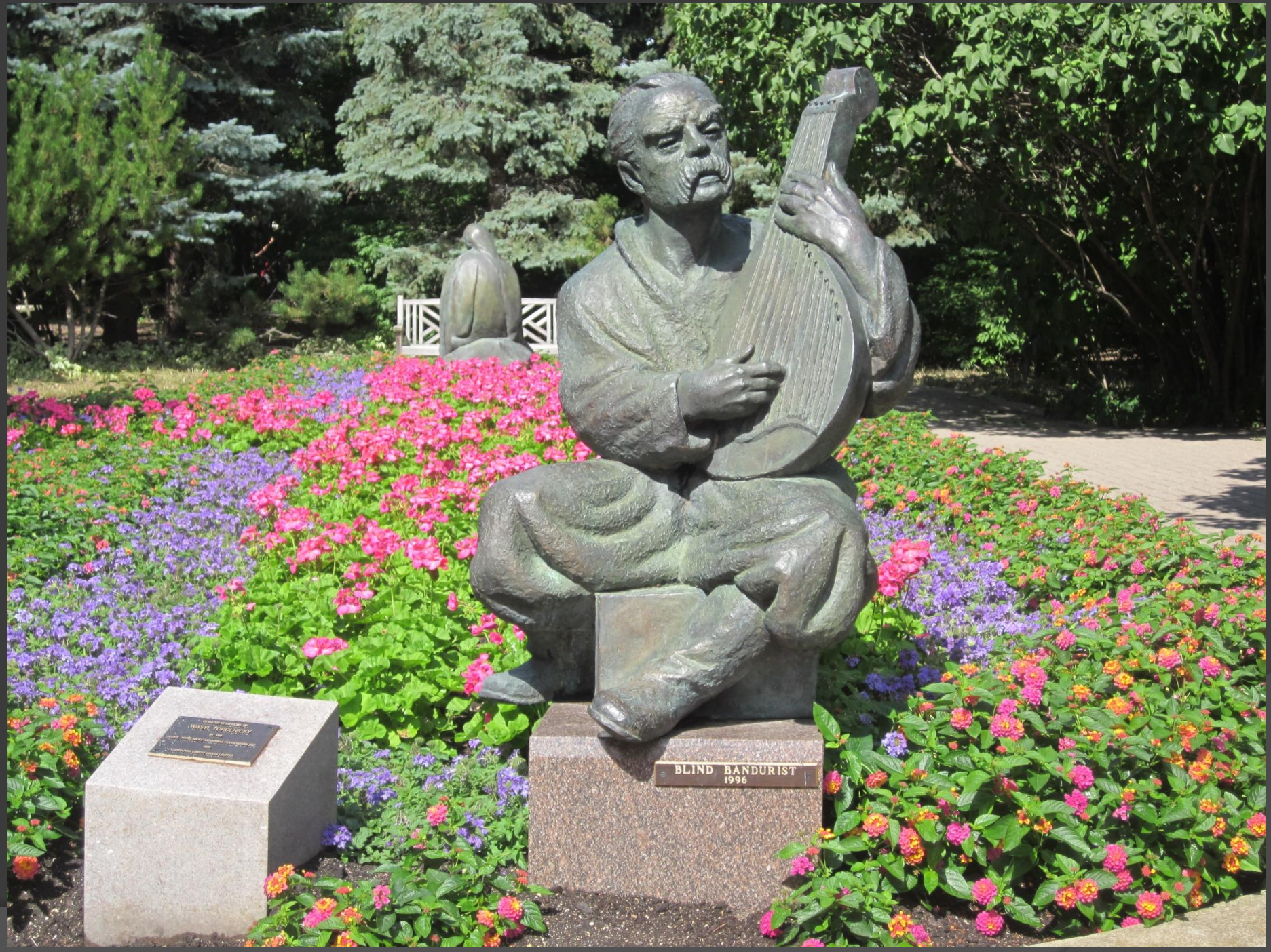
BLIND BANDURIST 1996