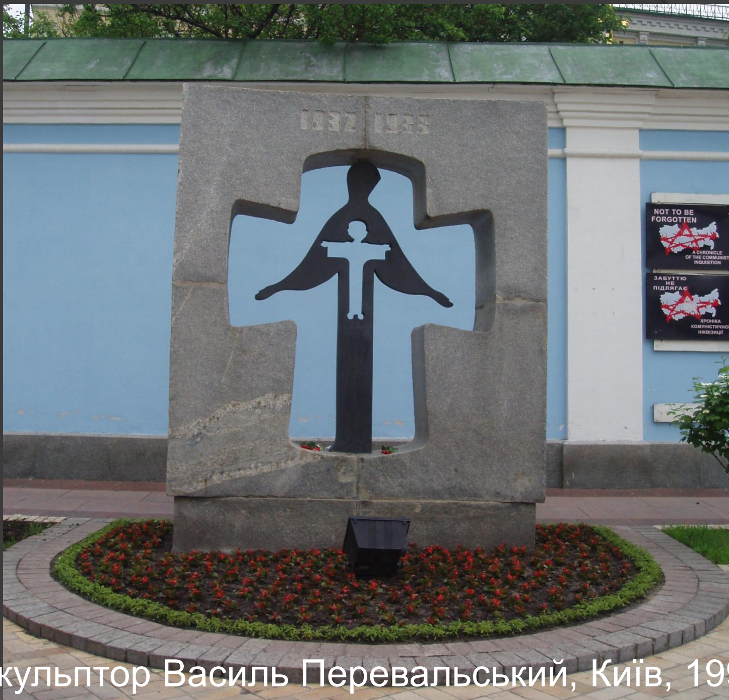
➤ Скульптор Василь Перевальський, Київ, 1993.