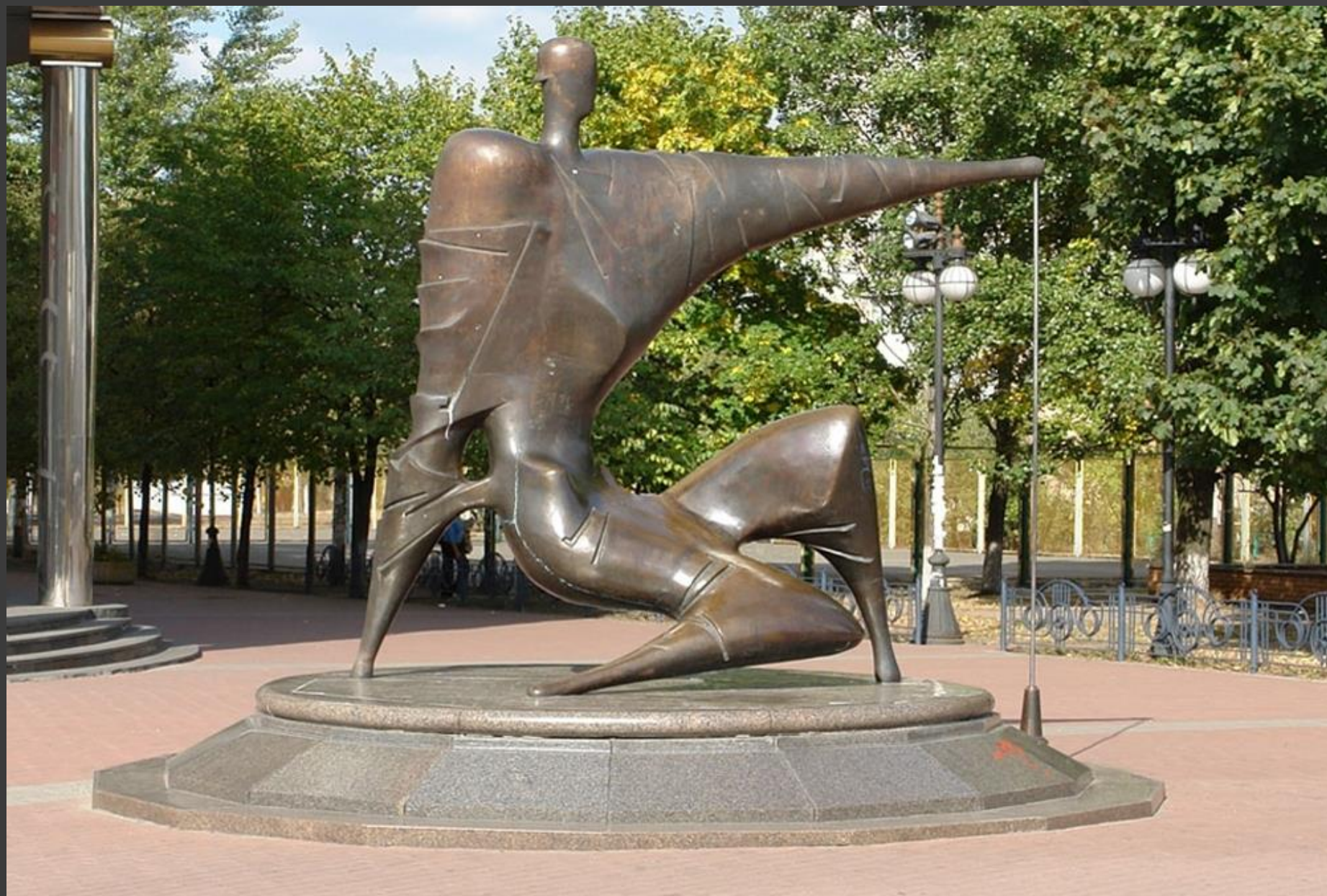
➤ «Будівельник,» скульптор Максим Луки, Київ, 2001.