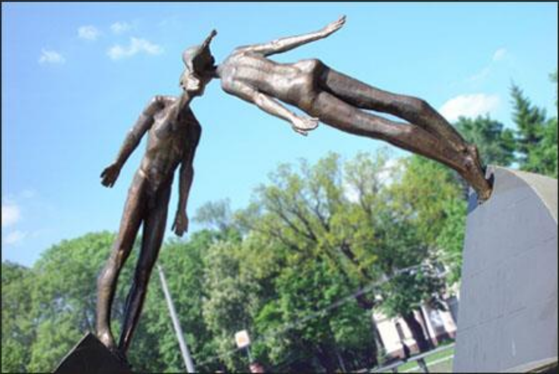
➤ «Дерево натхнення,» скульптор Дмитро Ів, Харків, 2001.