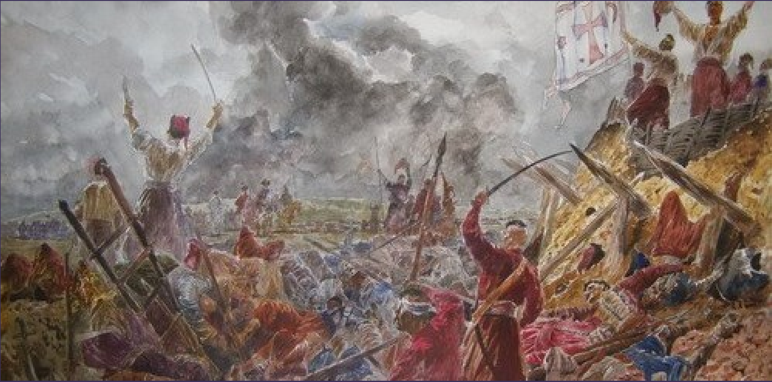
➤ Бій під П'яткою, 1593.