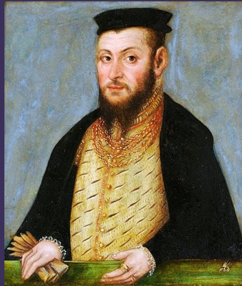
➤ Король Сигізмунд II Август, 1520-1572