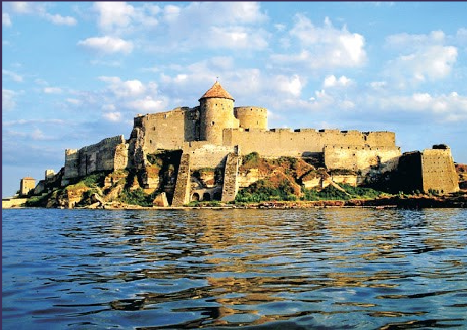
➤ Акерманська фортеця.