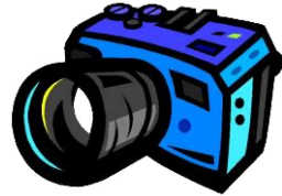
Преса і фото