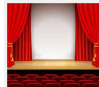
Костюми і сцена