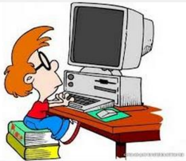
Комп'ютер та копіювальні машини