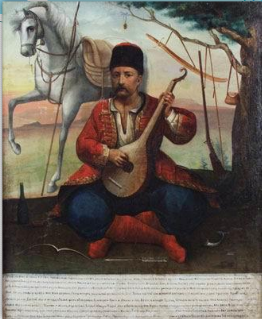
➤ «Козак Мамай», ХІХ ст.