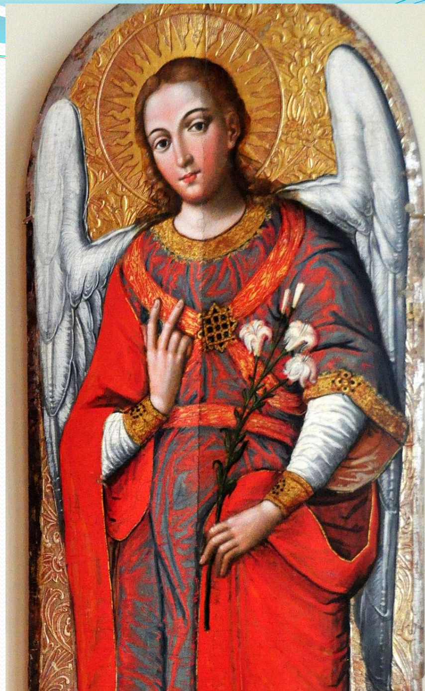
➤ Ікони «Архангел Михаїл» та Архангел Гавриїл,»; Іван Руткович, 1697-99.