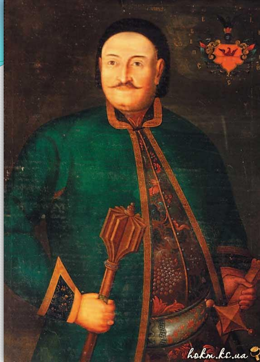
➤ Портрет Переяславського полковника Семена Сулими, середина XVIII ст.