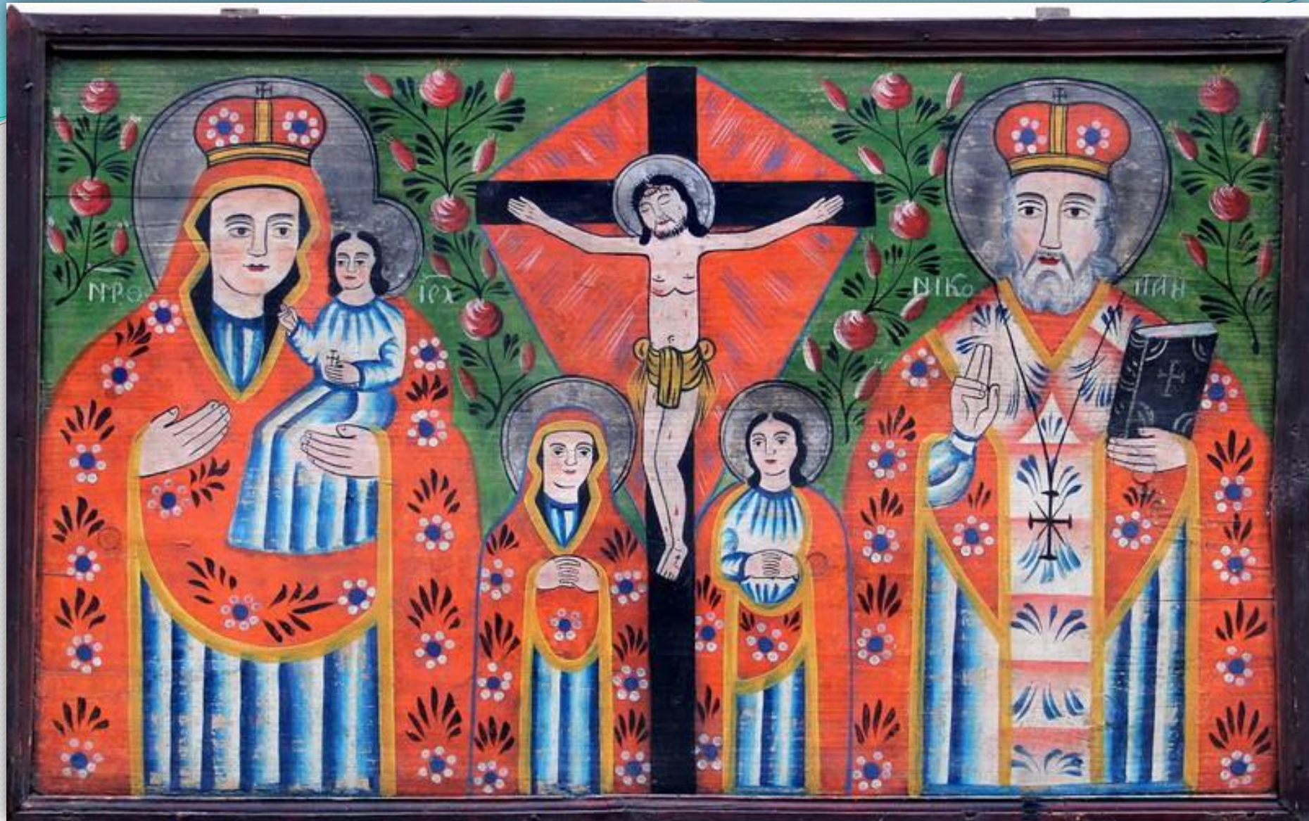
➤ Икона «Розпчття», Гуцульщина.