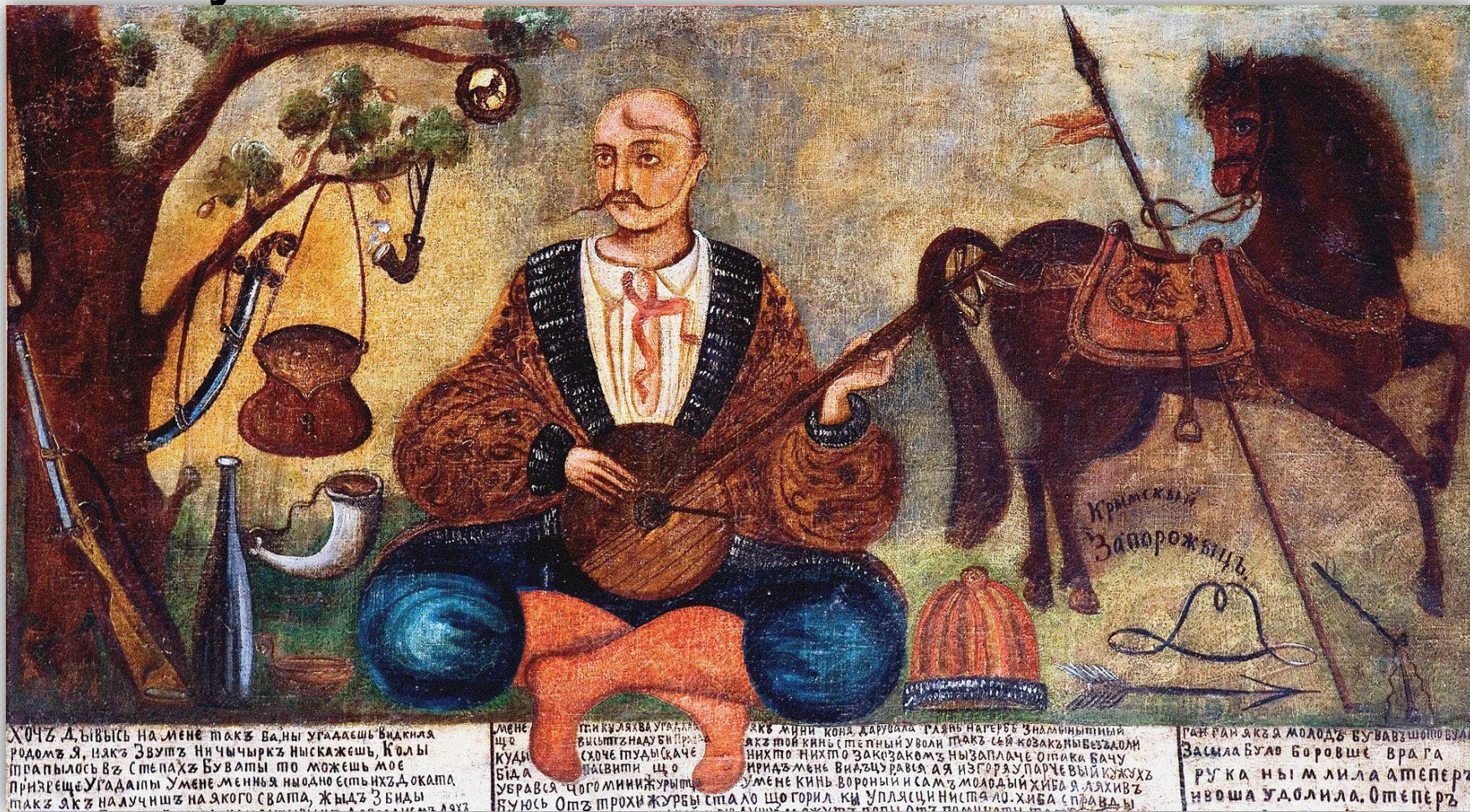
➤ «Козак Мамай», Крим 1780-1790 .