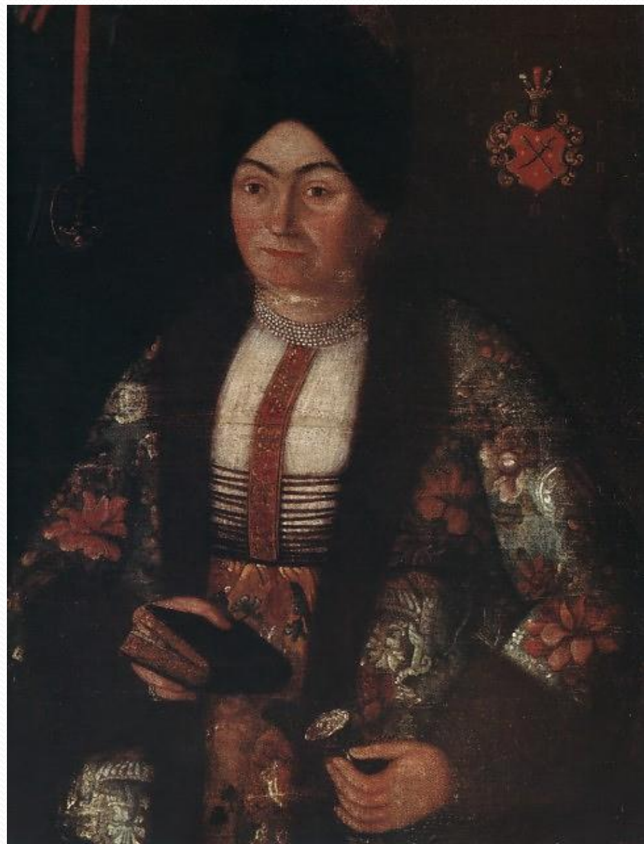
➤ Портрет Парасковії Сулими, середина XVIII ст.