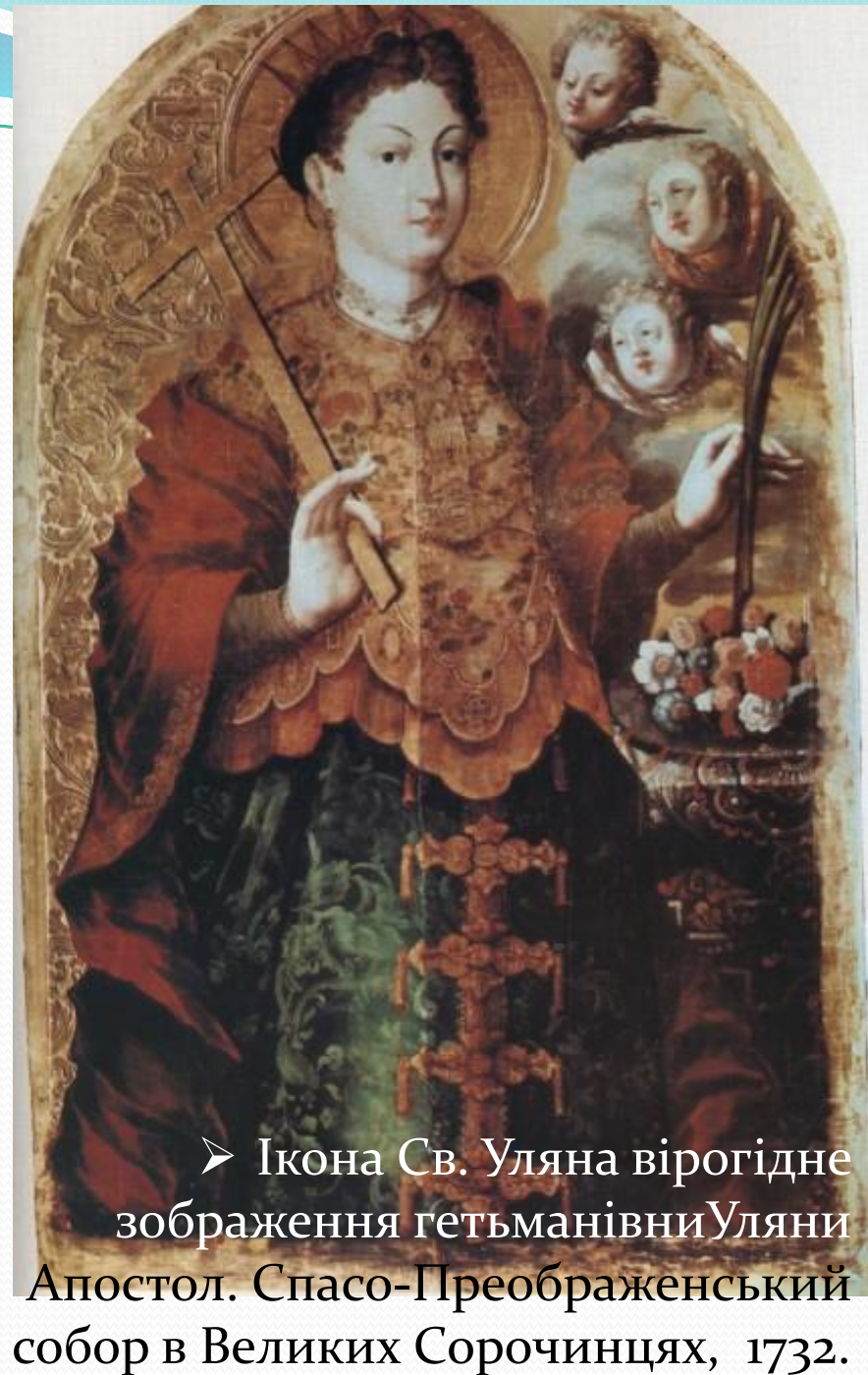
➤ Ікона Св. Уляна вірогідне зображення гетьманівни Уляни Апостол. Спасо-Преображенський собор в Великих Сорочинцях, 1732.

❖ Високо-освіченна еліта, велика кількість шкіл, та близькі зв'язки з Європою, дозволили українським мистцям стреміти (to pursue) до вершин європейського малярства.