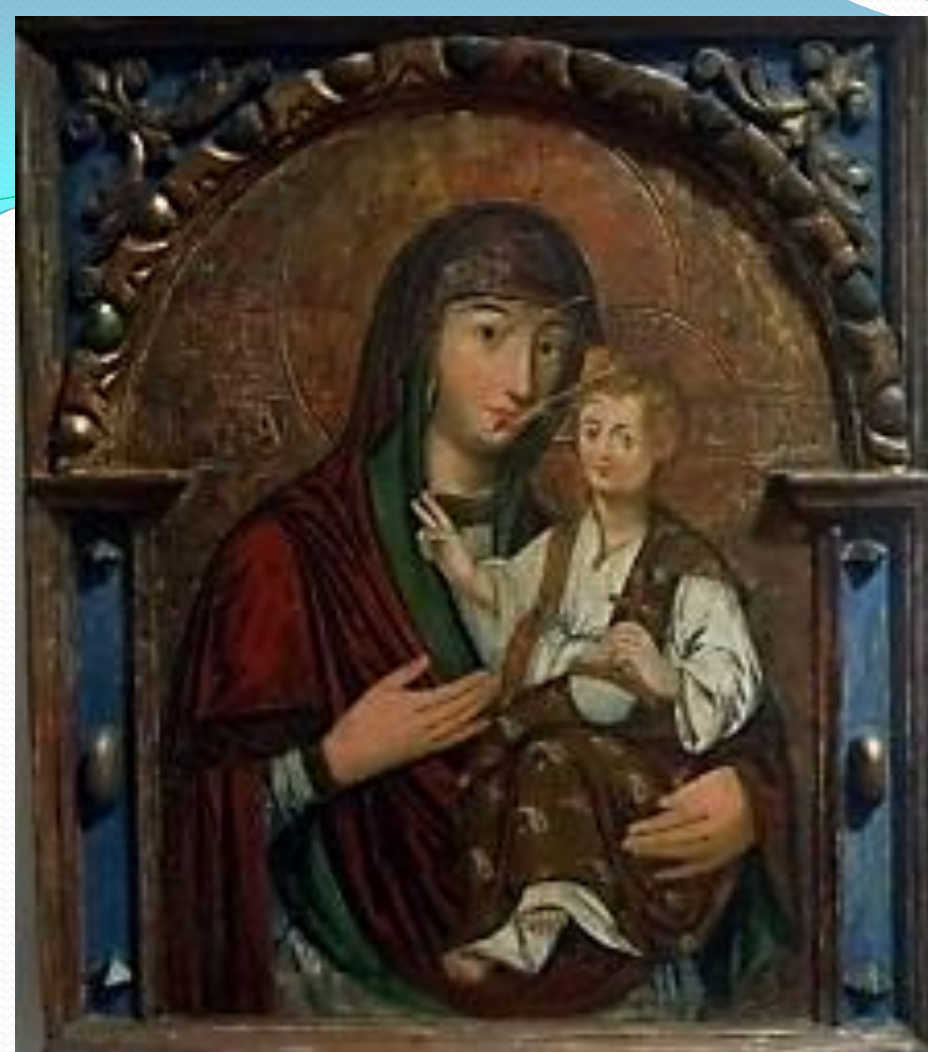
➤ Ікона: «Богородиця з Емануїлом», Наддніпрянщина.