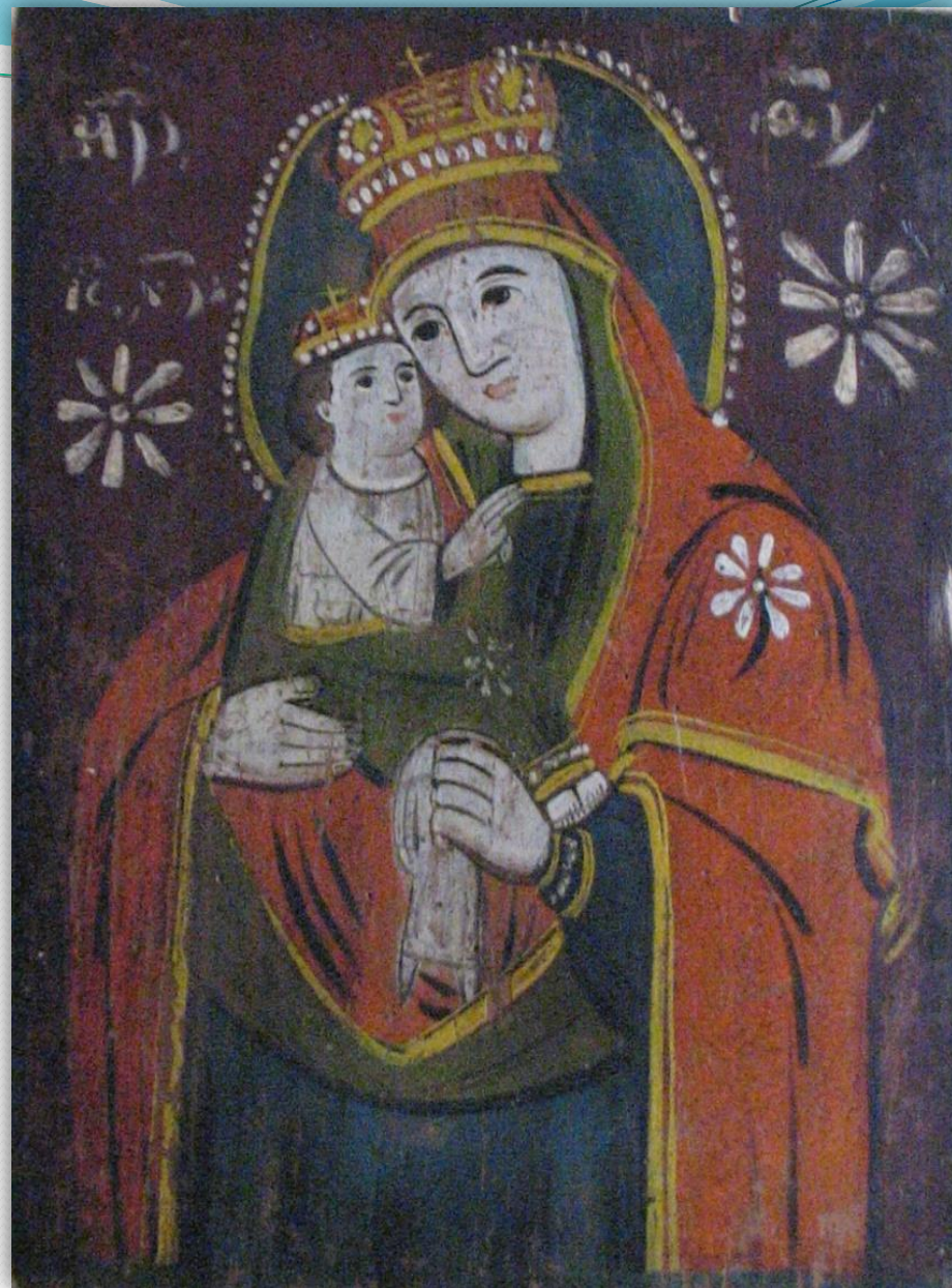
➤ Ікона з Львівщини