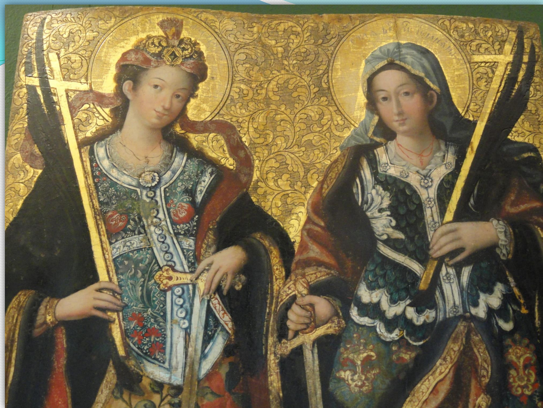
➤ Ікона: Великомучениці Анастасія і Іулянiя. 1740-ві. роки.