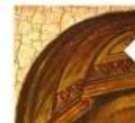
анатомічні пропорції дотримані, лик «відкритий», емоційно контактний