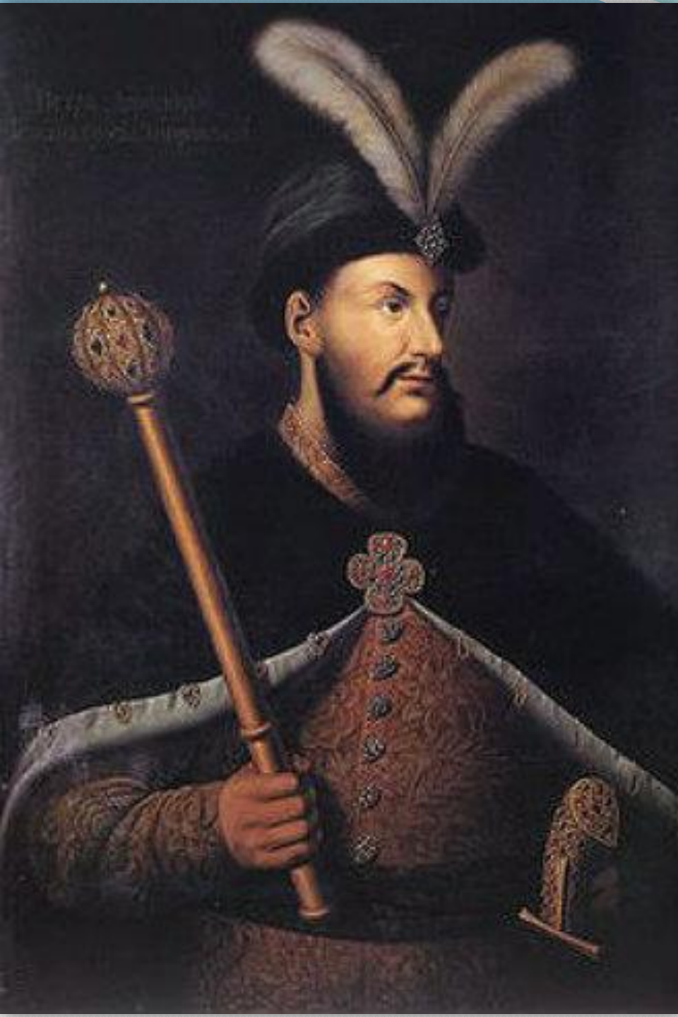
➤ Гетьман Петро Дорошенко. Портрет, XVII сторіччя