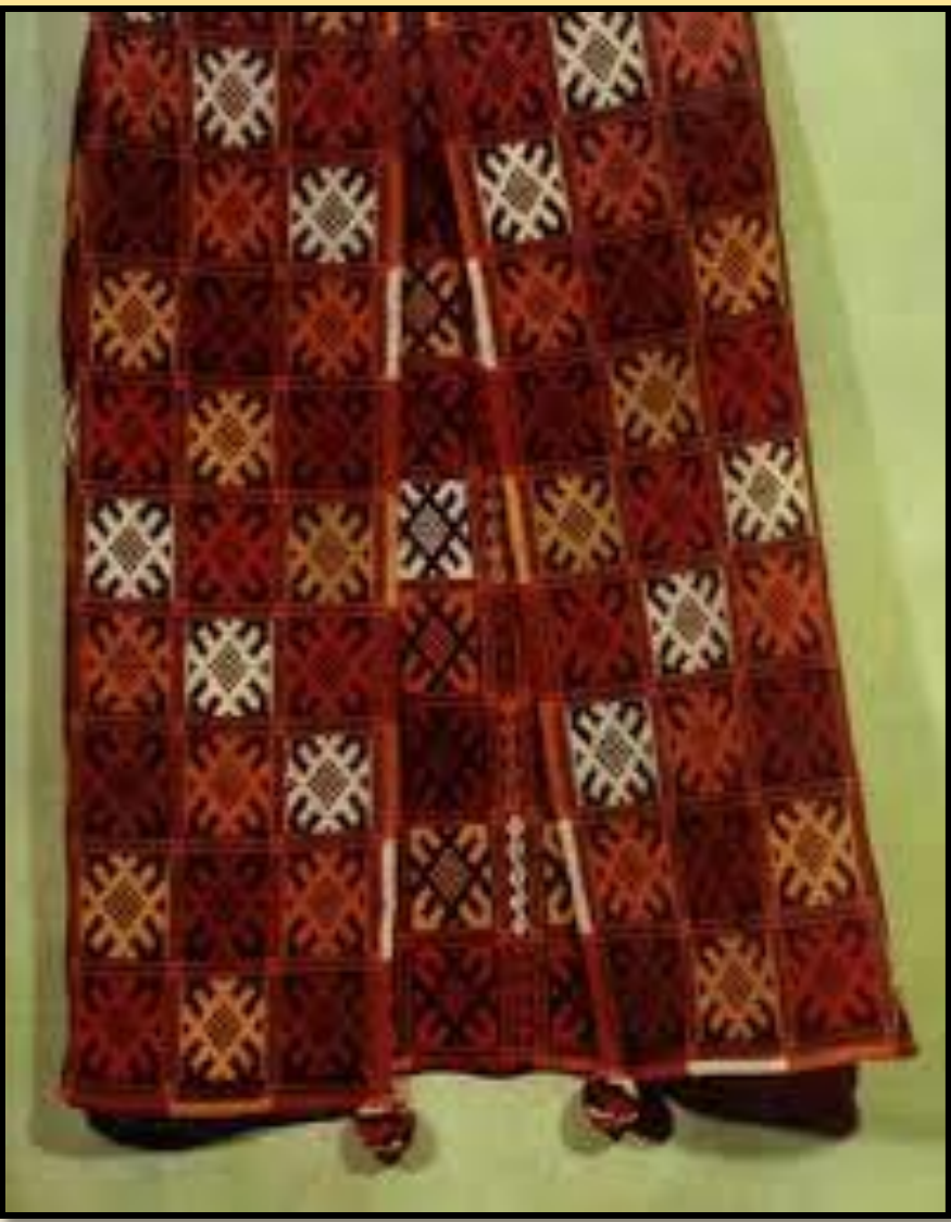
➤ Ткана огортка