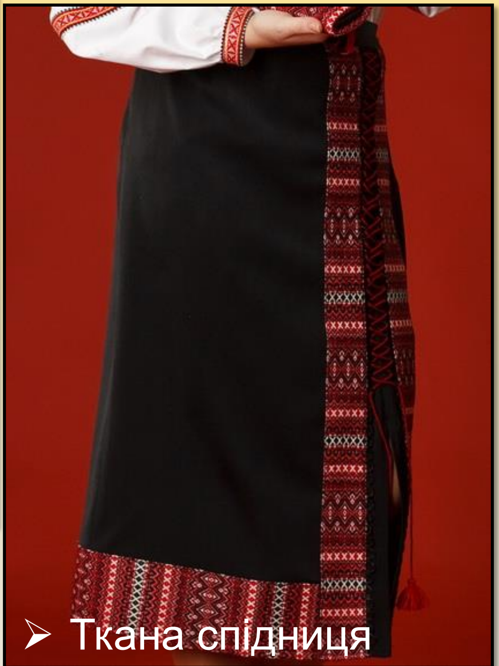
➤ Ткана спідниця