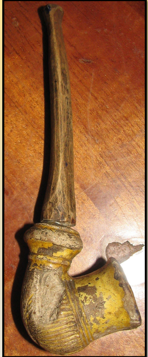
➤ Козацька порохівниця і люлька