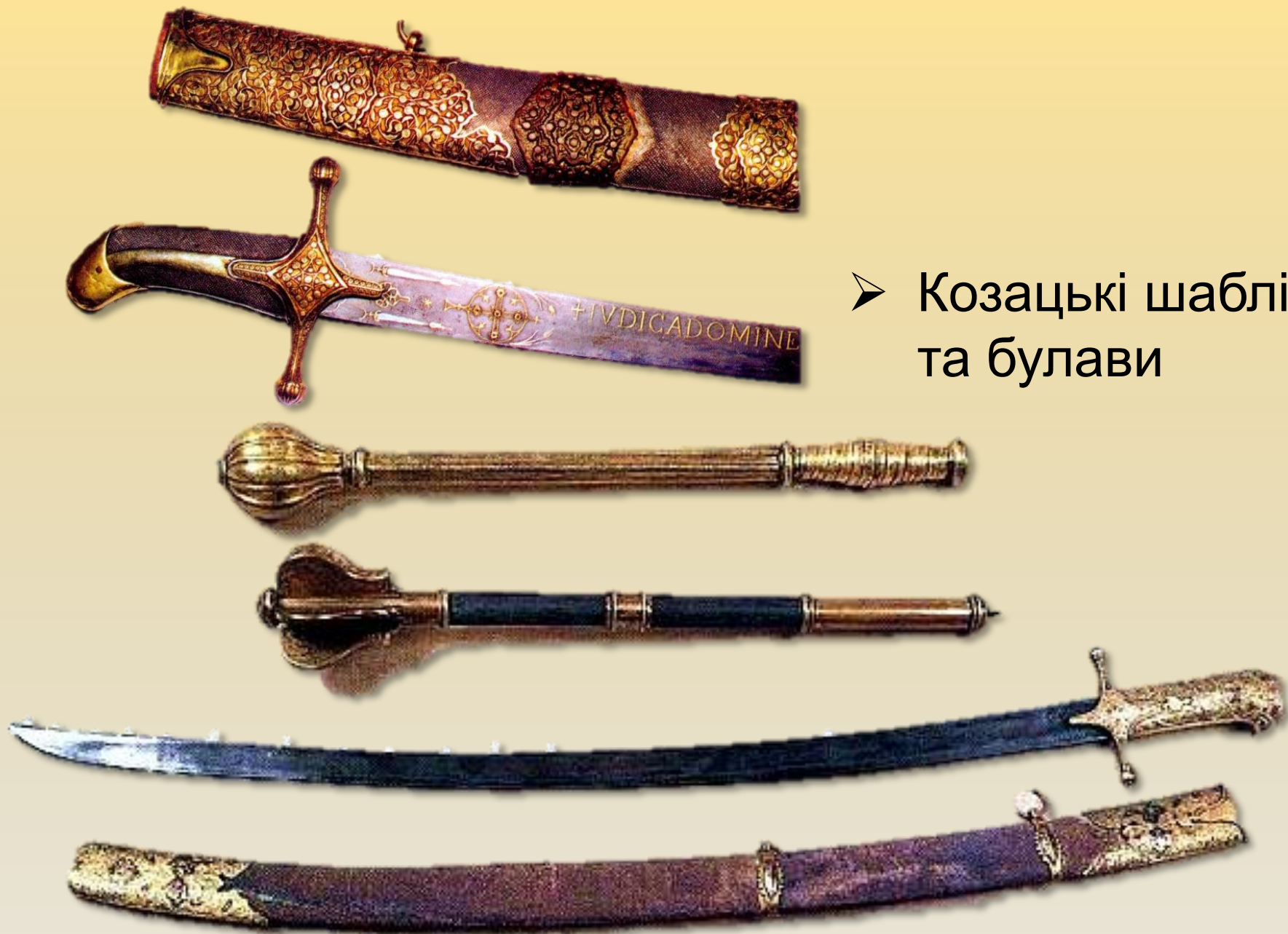
➤ Козацькі шаблі та булави