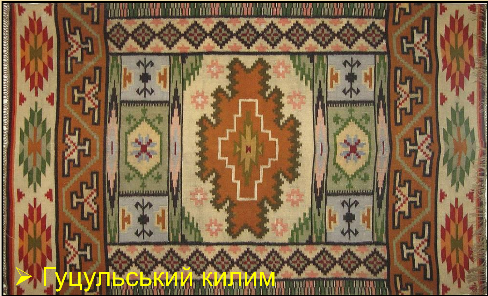
➤ Гуцульський килим