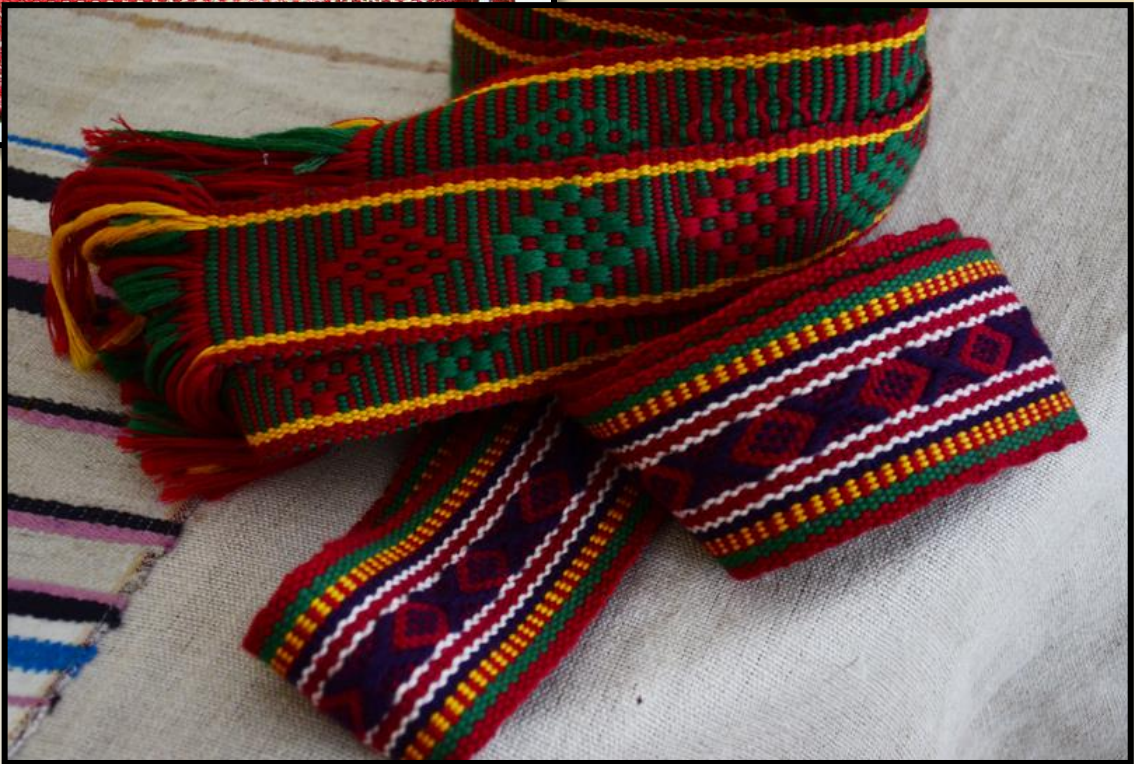
➤ Ткані пояси, крайки