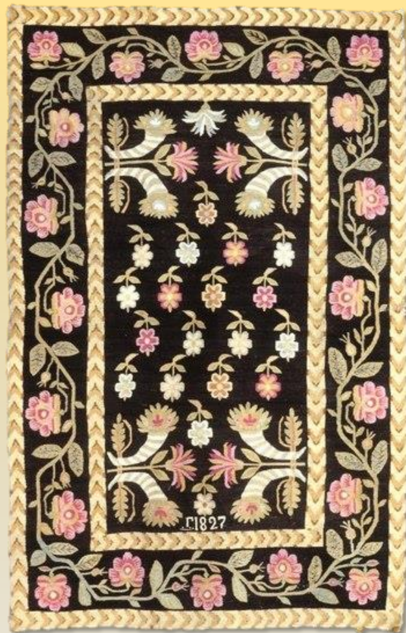
➤ Тканий вовняний килим 1827