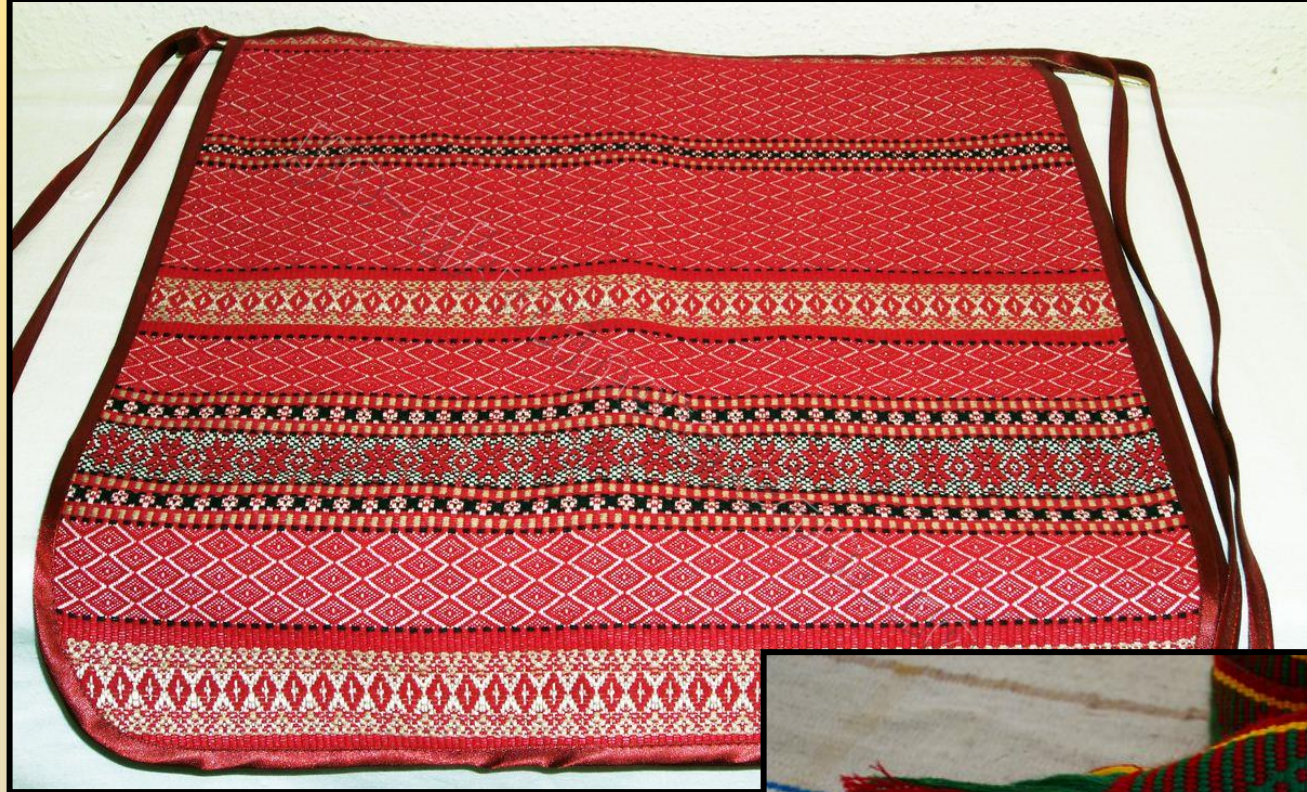
➤ Ткана плахта