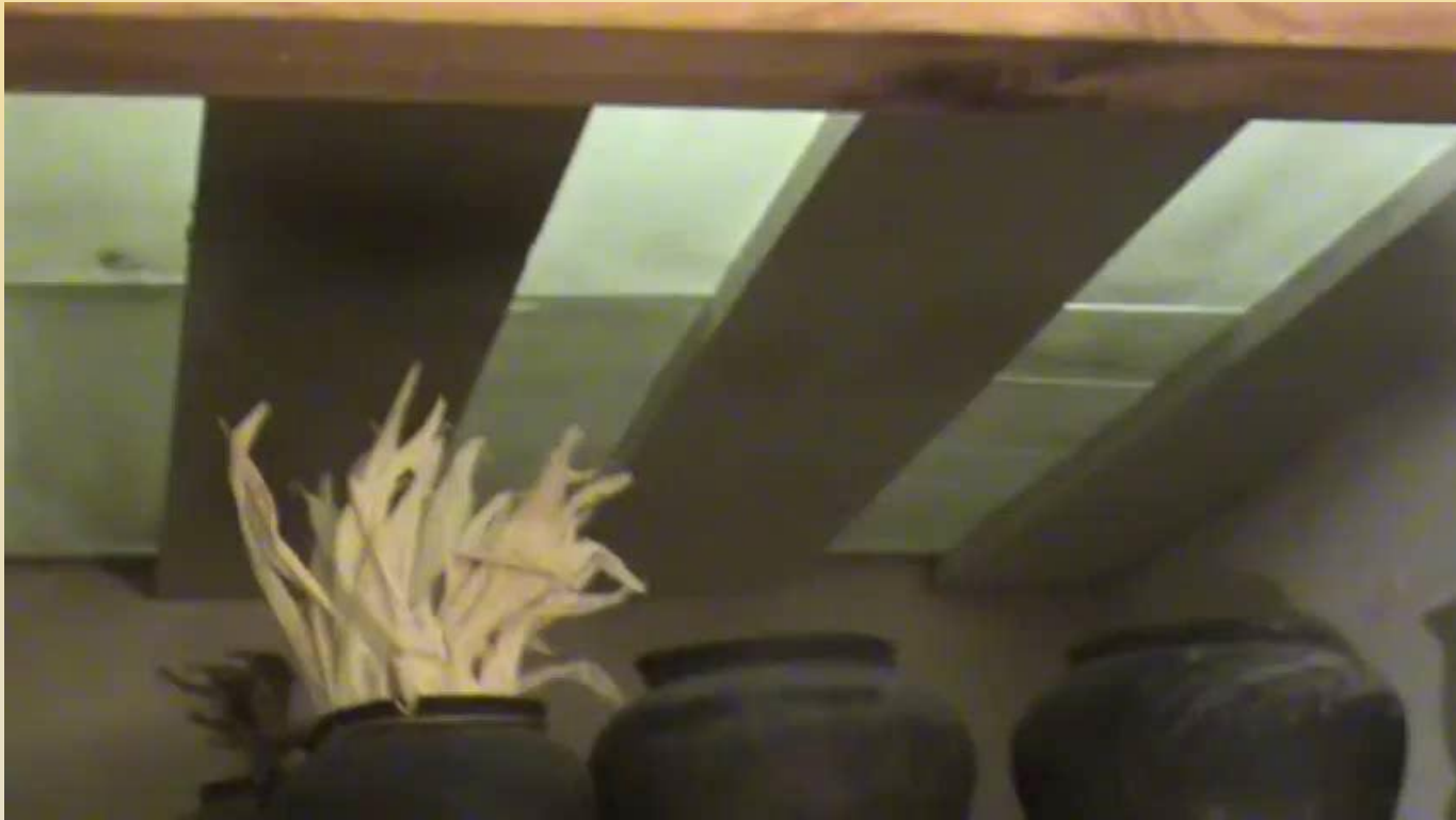
Дівич-Вечір - Ансамбль "Співограй" (м. Біла Церква, Київська область)