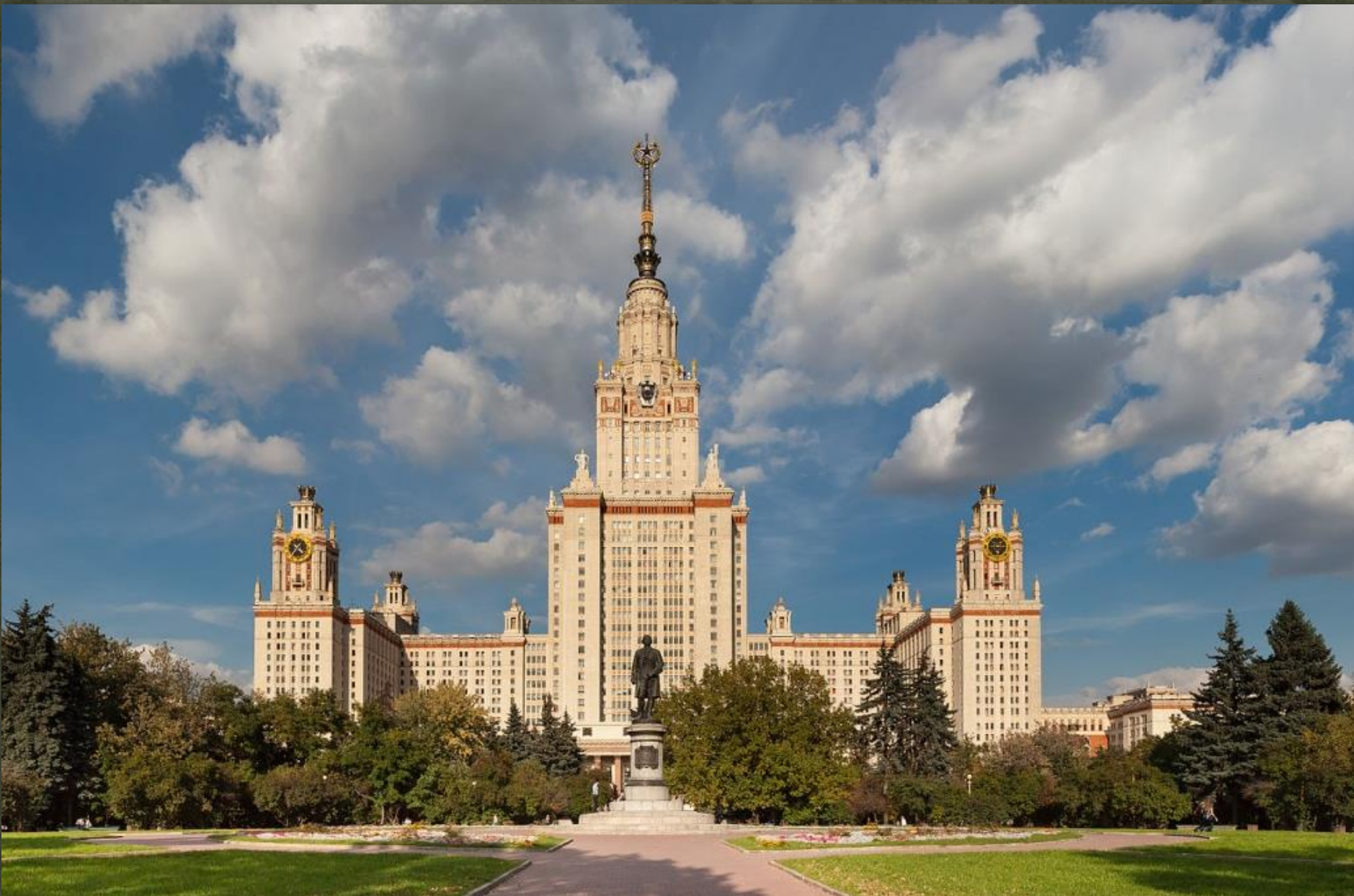
Московський університет, Москва, закінчено в 1954 р.