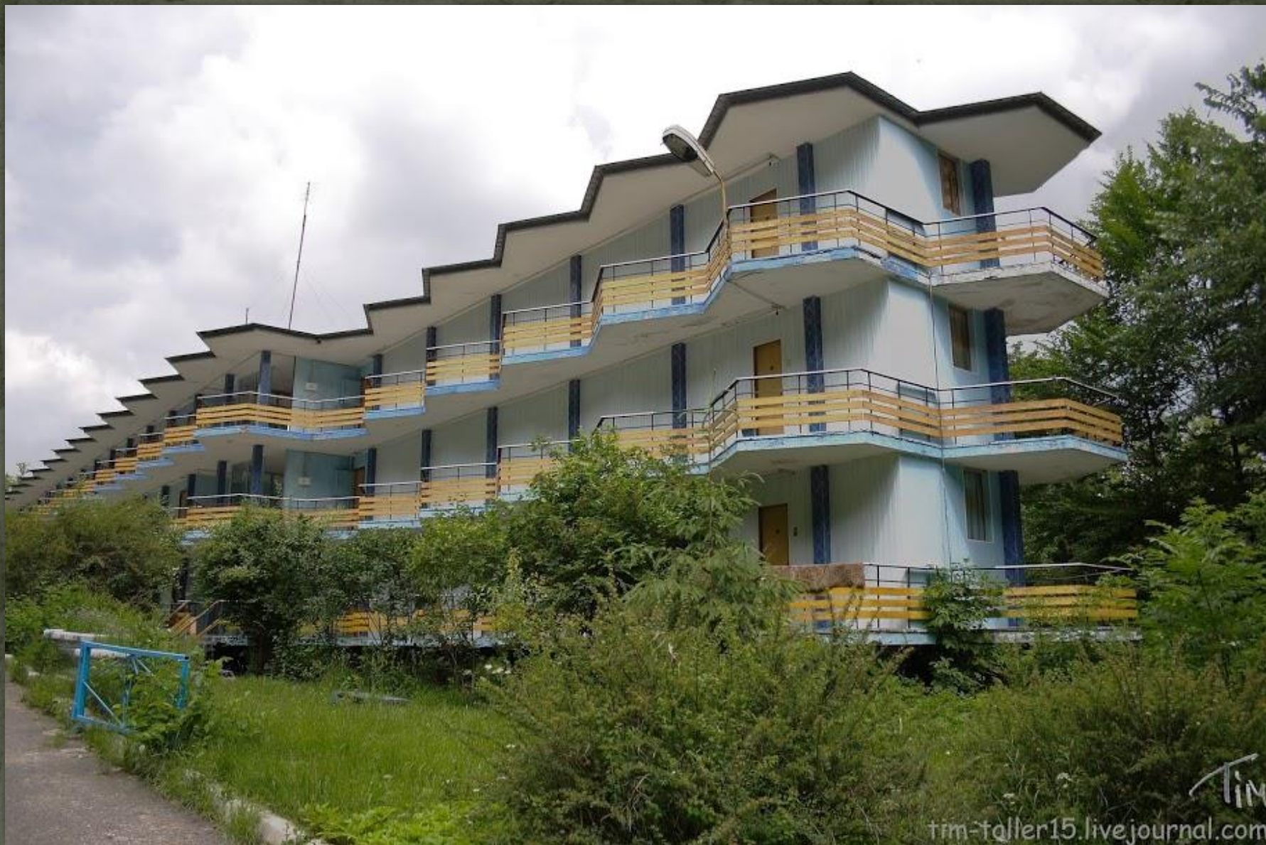
➤ Готель «Тарасова Гора», Канів, 1961.