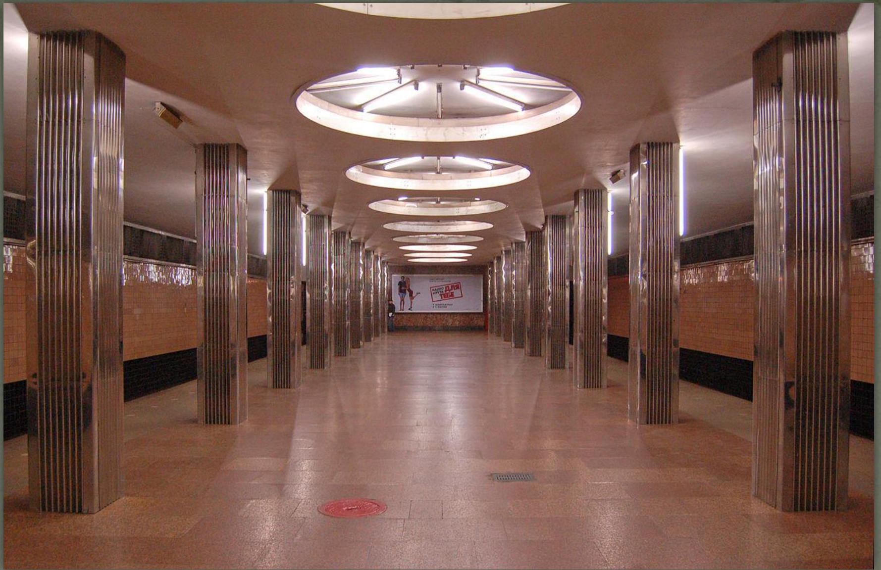
➤ Метро станція «Жовтнева», Київ 1971.