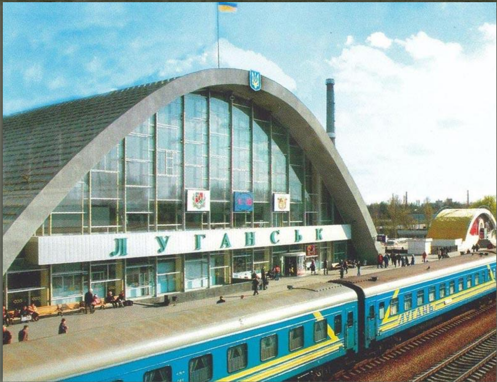
➤ Зеленодорожний вокзал в Луганську, 1978.