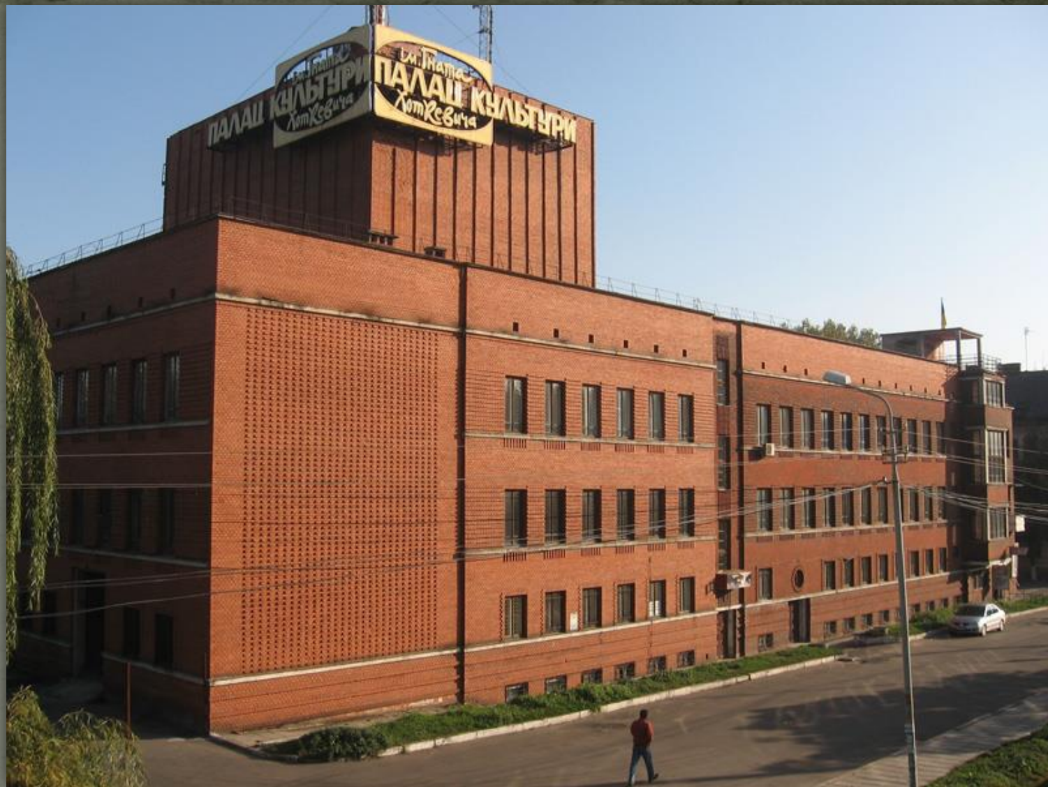
❖ Будинок культури ім. Гната Хоткевича, Львів, 1934.