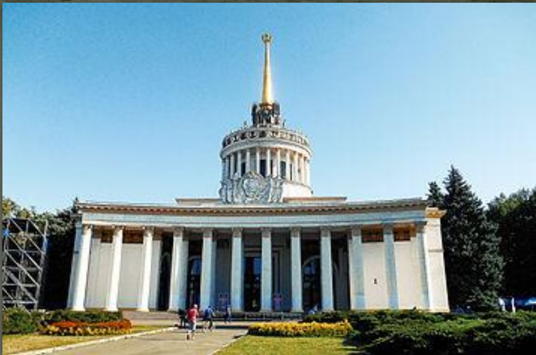
❖ Національний комплекс «Експоцентр України», Київ, 1948 р.