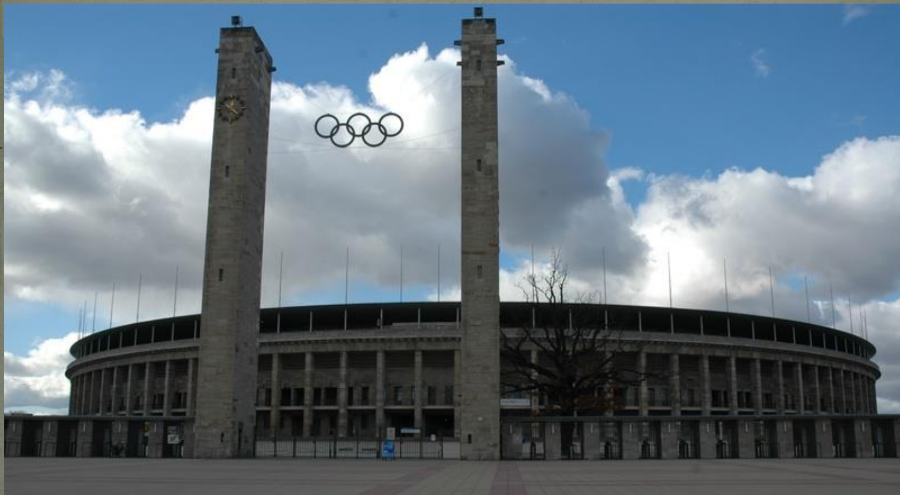
Олімпійський стадіон, Берлін, Німеччина, 1936 рр.

❖ Це період фашизму та диктаторів – Гітлер, Мусоліні, Сталін.