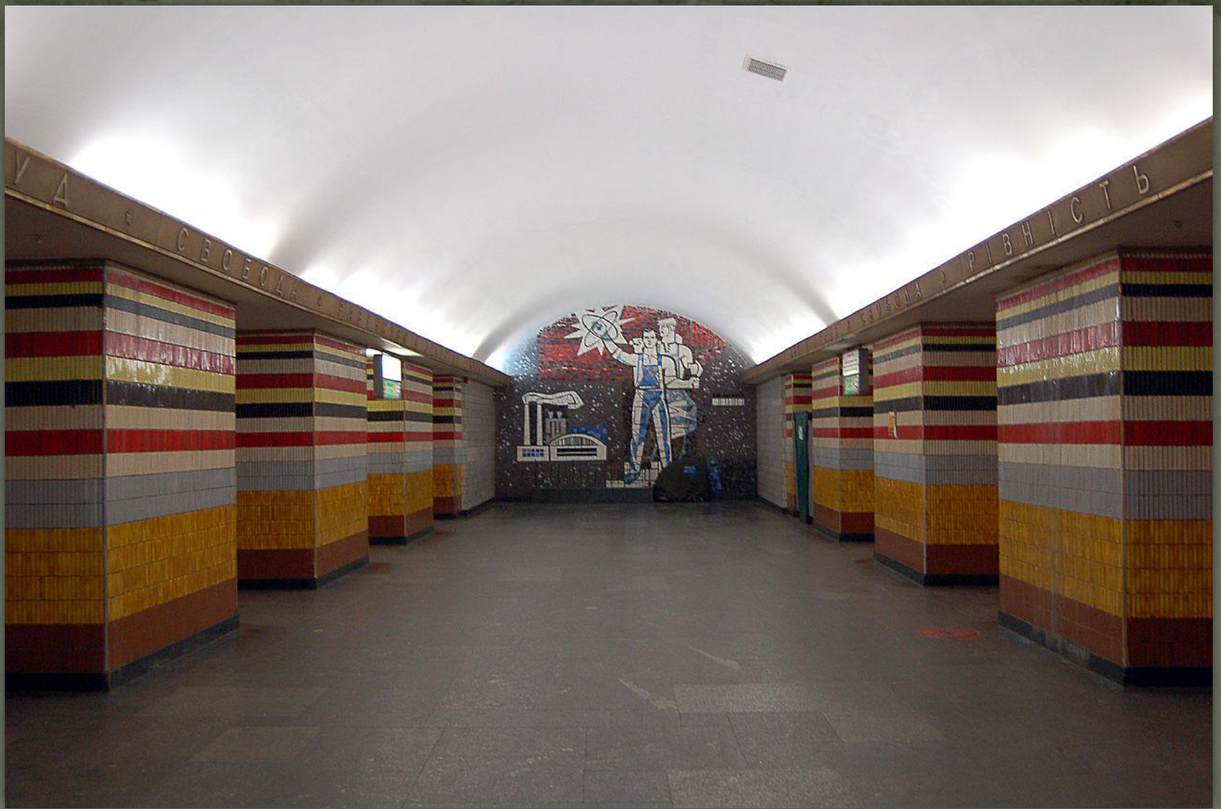
➤ Метро станція «Завод Більшовик», Київ 1963.