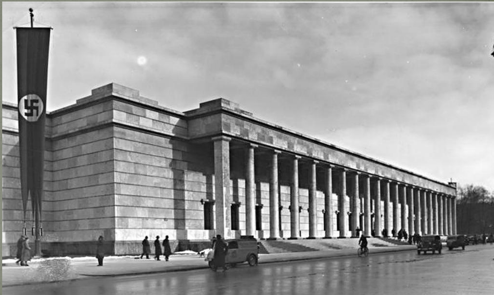
Haus der Kunst (House of Art) музей мистецтва Мюнхен, Німеччина, 1933-36 рр.

❖ Цей стиль дуже подібний до псевдо-класицизму 30-тих років в Німеччині та Італії .