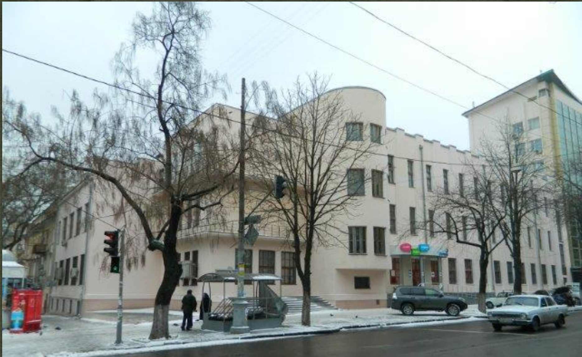
➤ Одеса. Телефонічна станція, 1929-1930 рр.