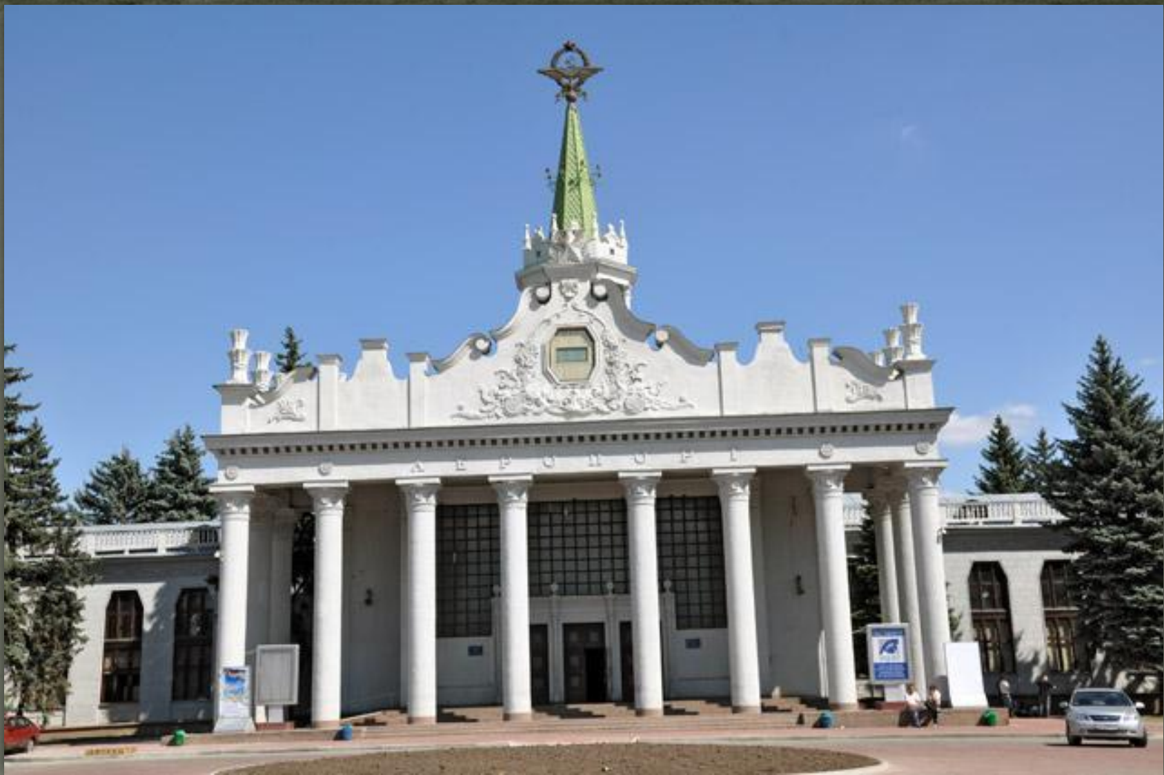
❖ Аеровокзал, Харків, 1951-54 рр.