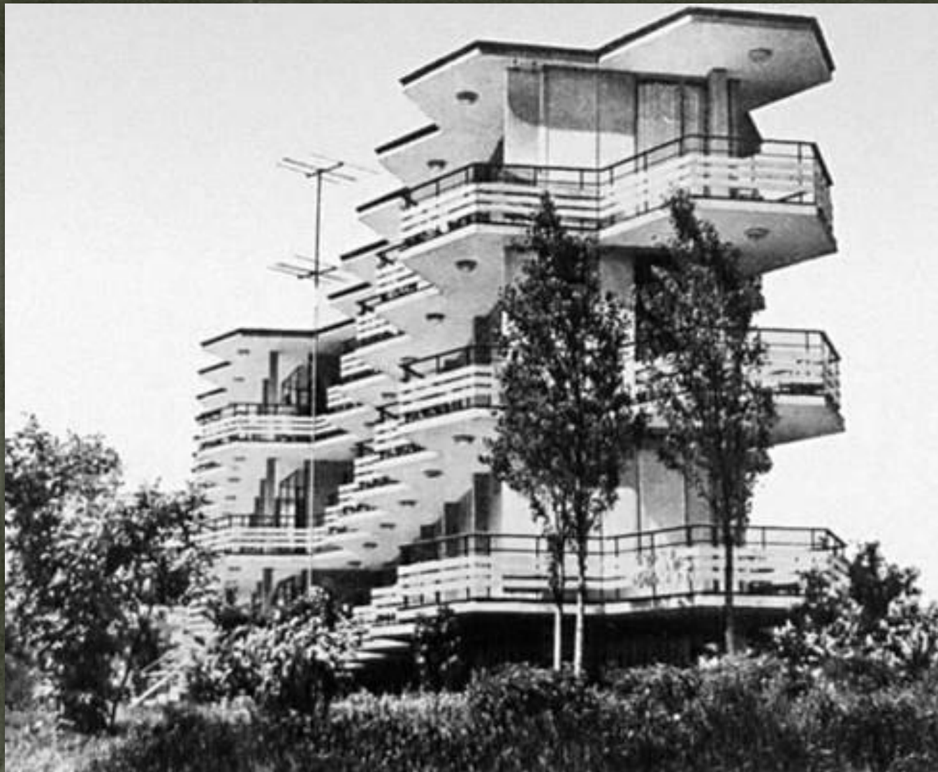
➤ Готель «Тарасова Гора», Канів, 1961.