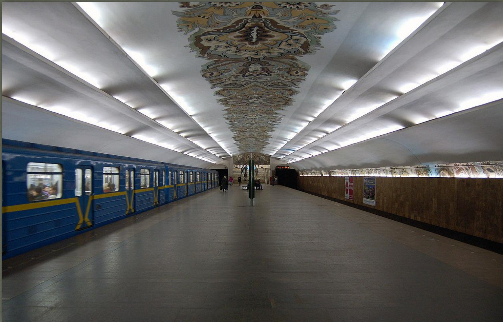
➤ Метро станція «Мінська», Київ 1982.