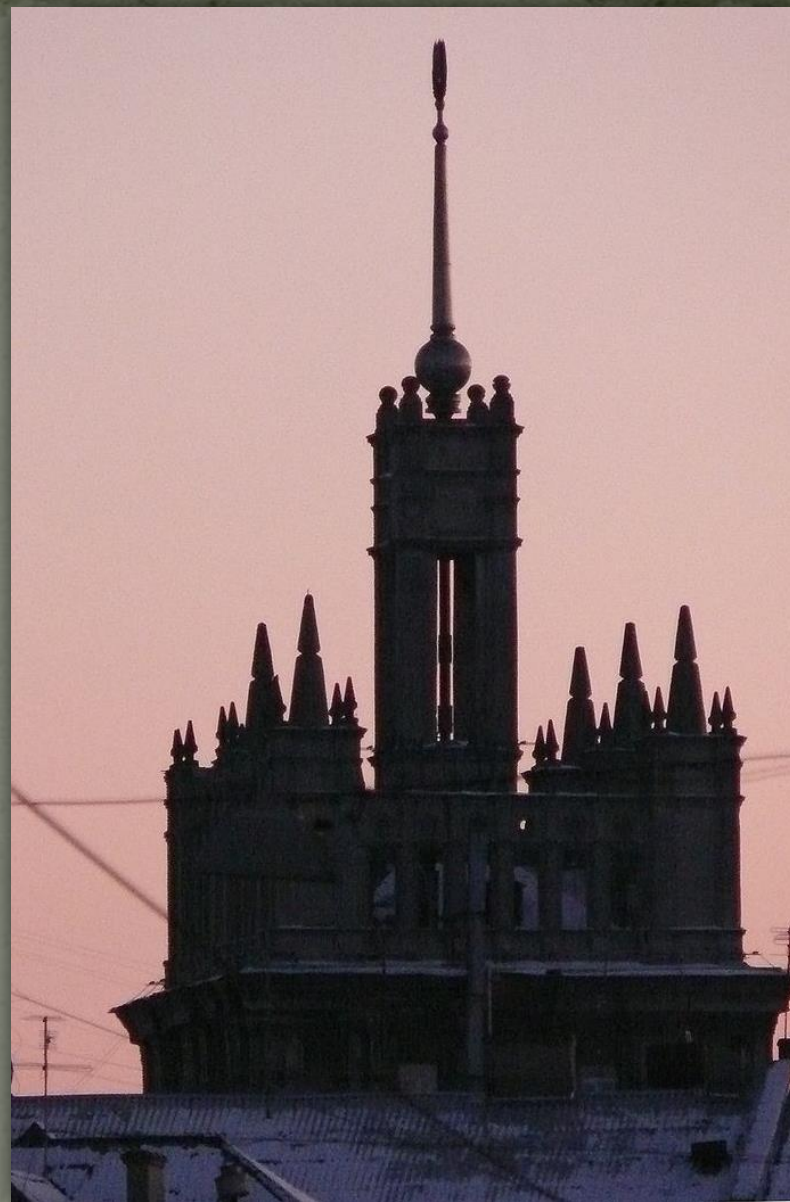
Будинок зі шпилем, Харків, 1950 р.