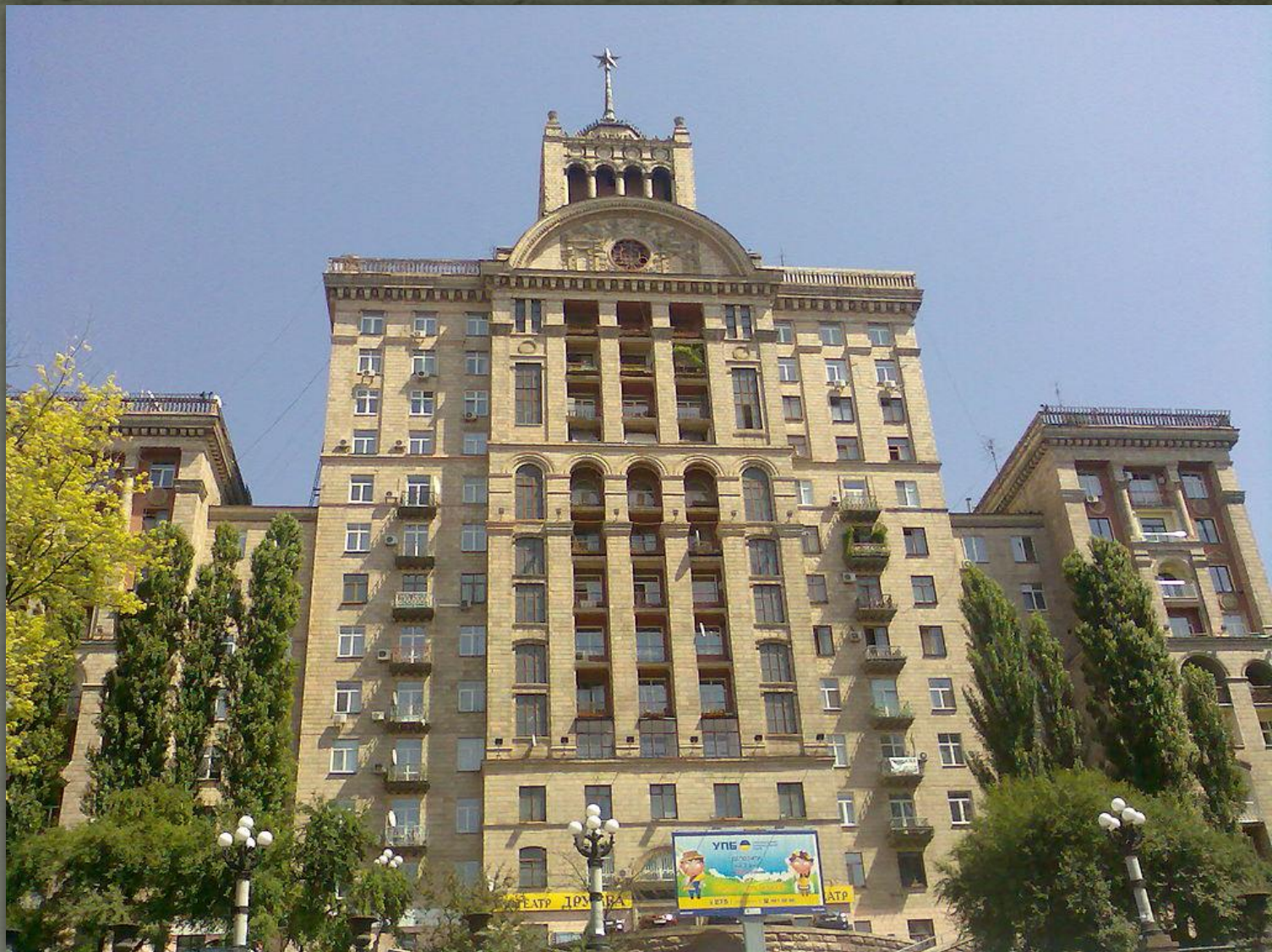
❖ Житловий будинок, Київ, 1953