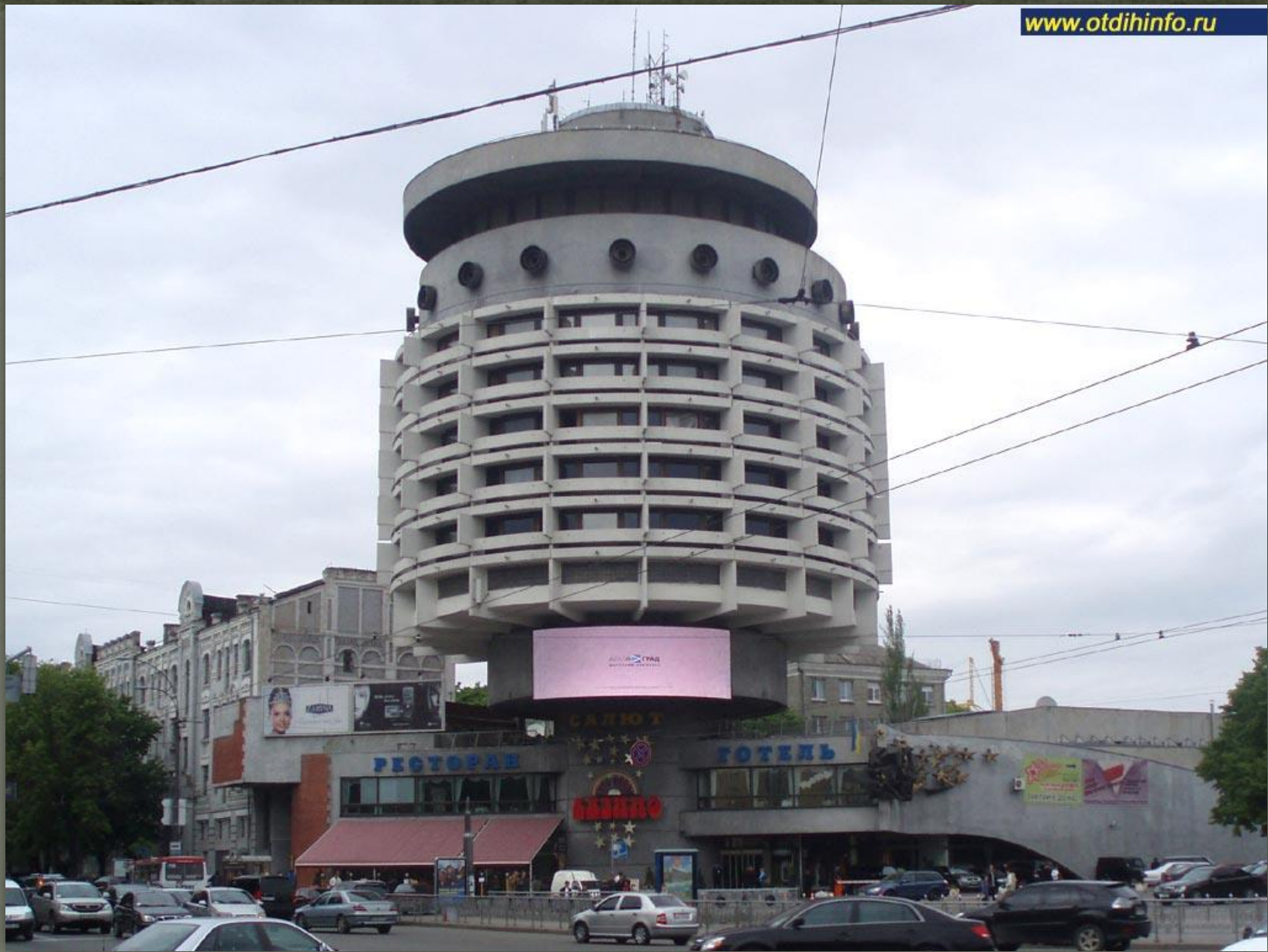
➤ Гостиниця (hotel) «Салют» в Києві, 1984.