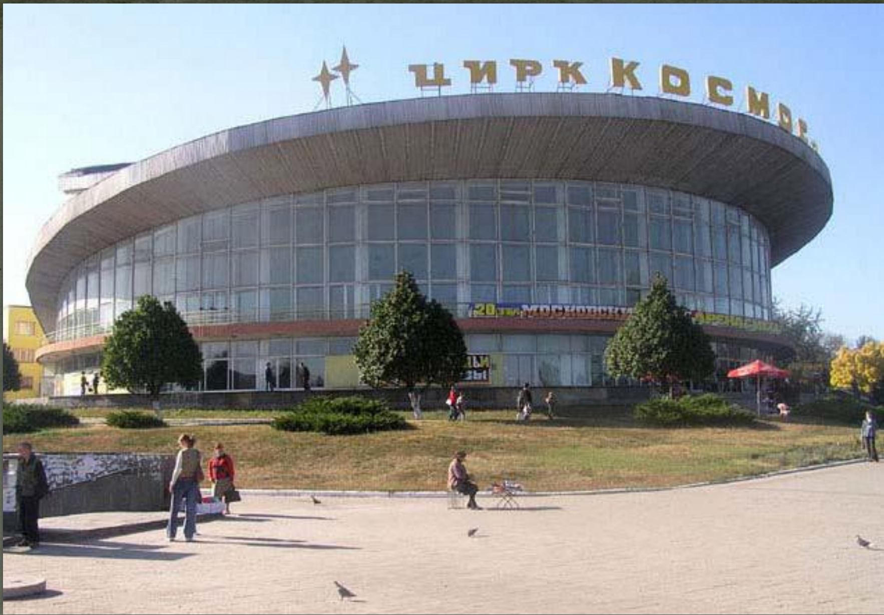
➤ Цирк «Космос» в Донецьку, 1969.