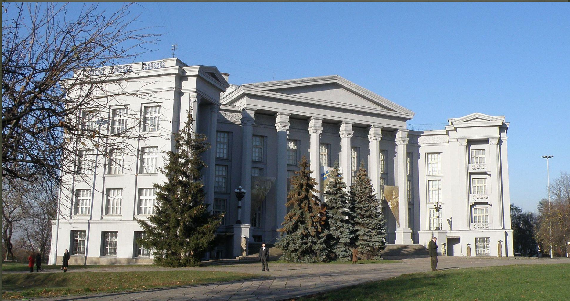
❖ Національний музей історії, Київ, 1937-39 рр.