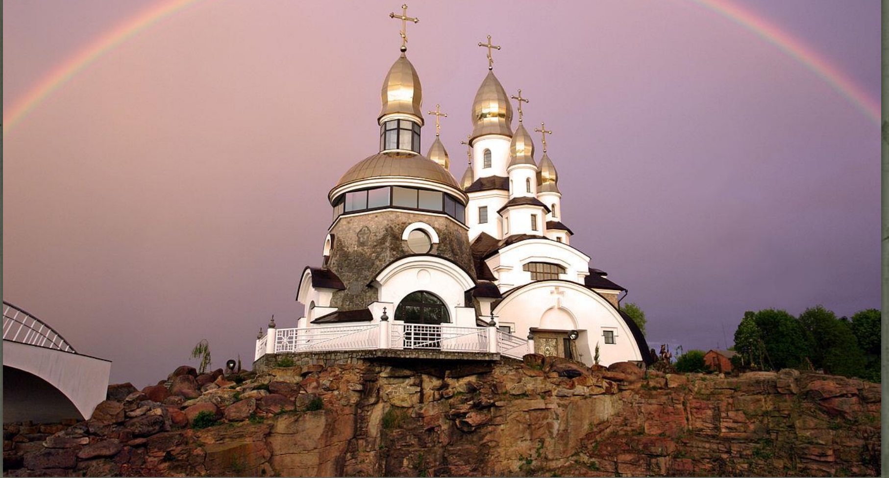
➤ Храм святого Євгенія у селі Буки.