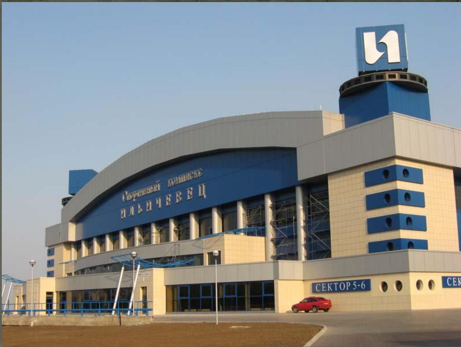
➤ Спортивний комплекс «Іллічівець», Маріупіль.