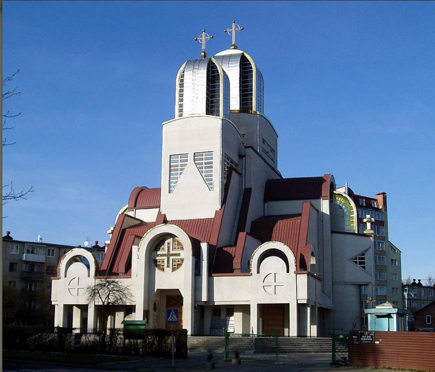
➤ Церква Положення Пояса Пресвятої Богородиці, Львів.