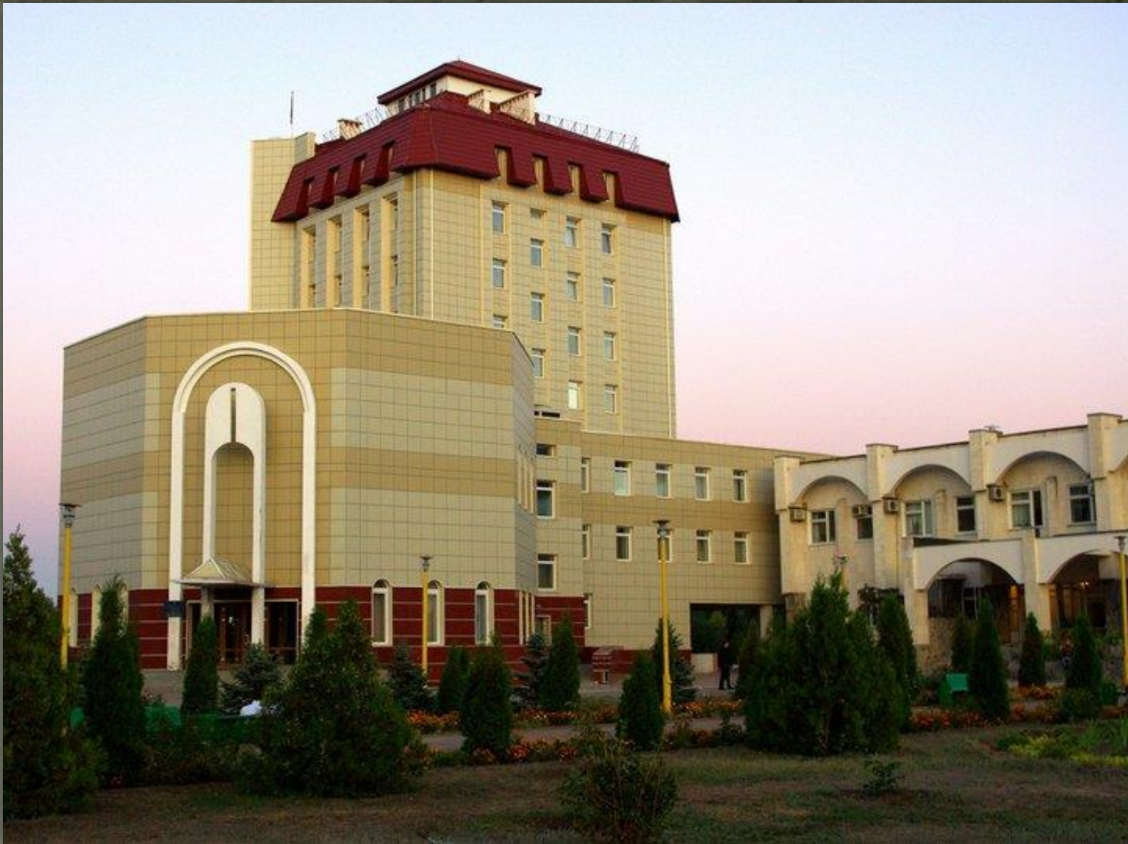
➤ Мерія – ратуша міста Енергодар, Запорізька обл.