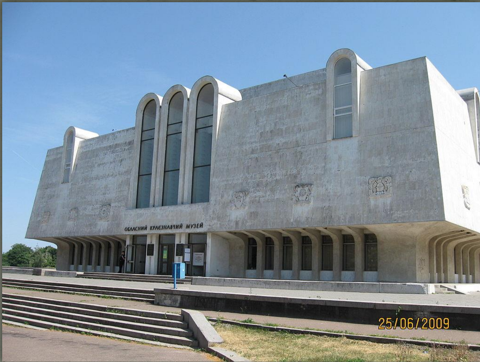
➤ Черкаський обласний краєзнавчий музей, Черкаси.