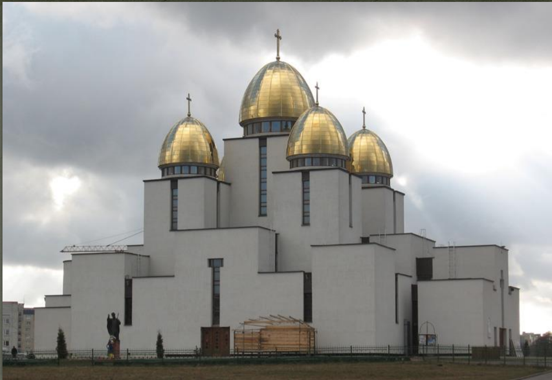
➤ Церква Різдва Пресвятої Богородиці, Сихів.