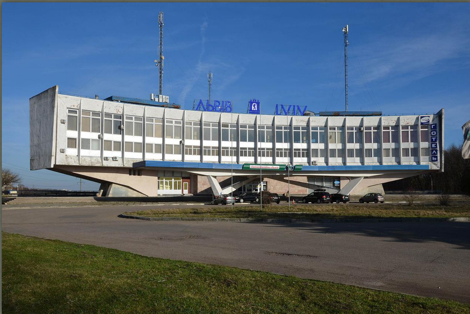
➤ Львів, Автовокзал (motel).