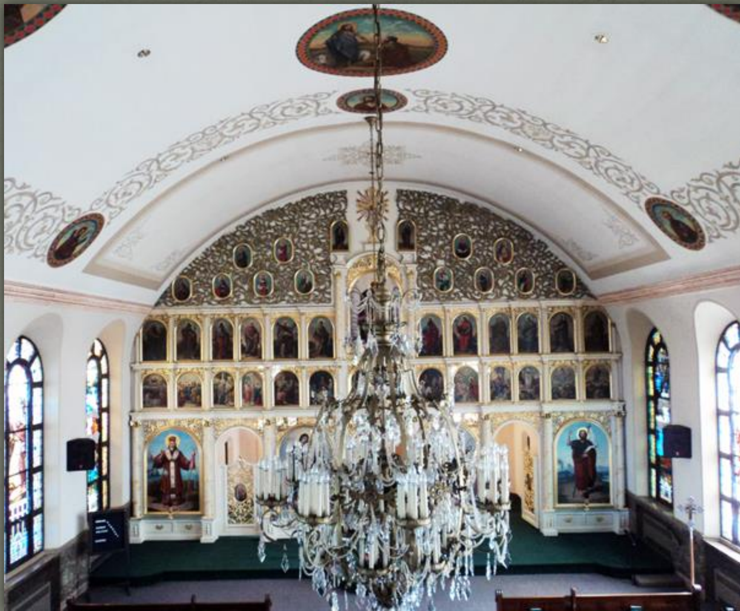
➤ Церква Святого Івана, Lansford, Pennsylvania, 1912 р.