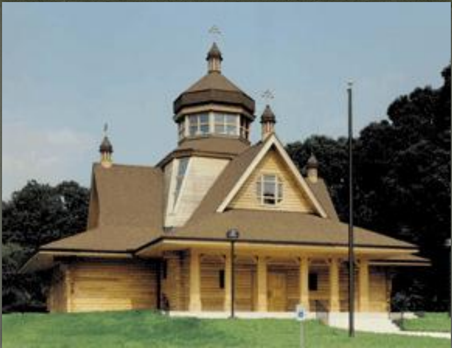
➤ Церква Архістратиґа Михаїла, Jenkinstown, PA, 1992.