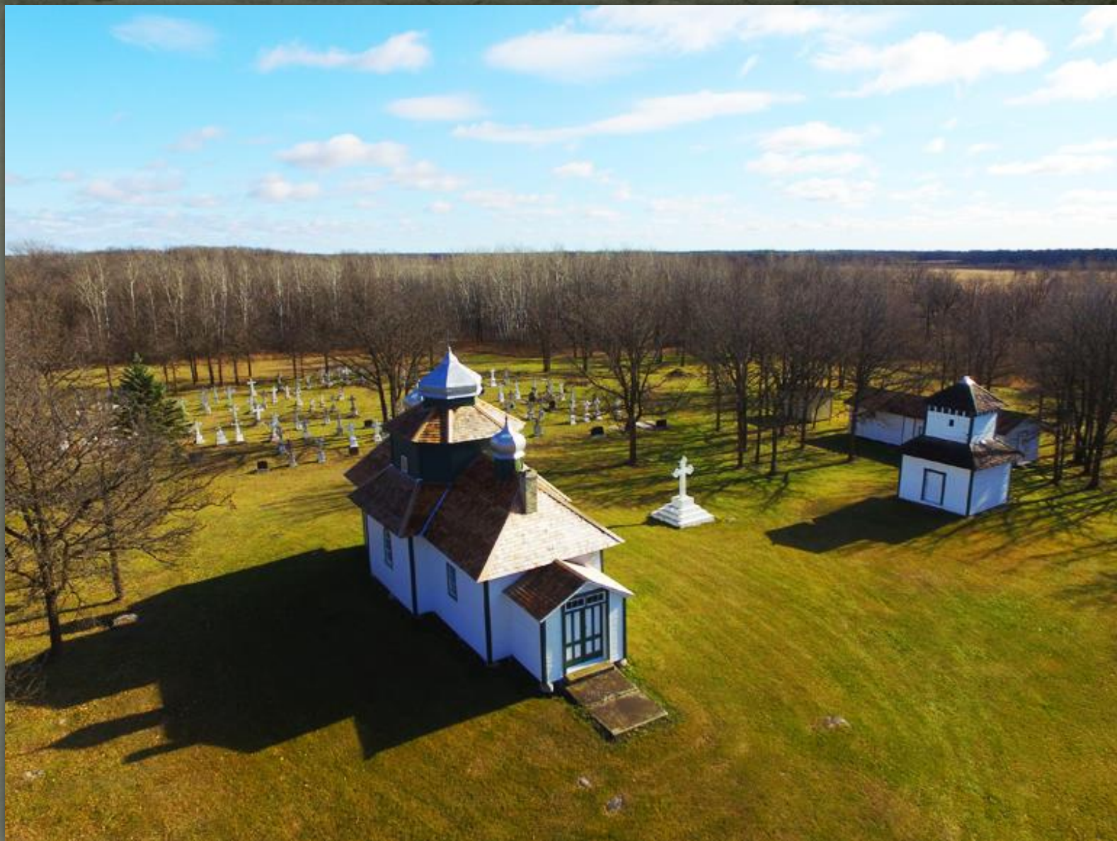
➤ Церква св. Михаїла, Манітоба, 1898.