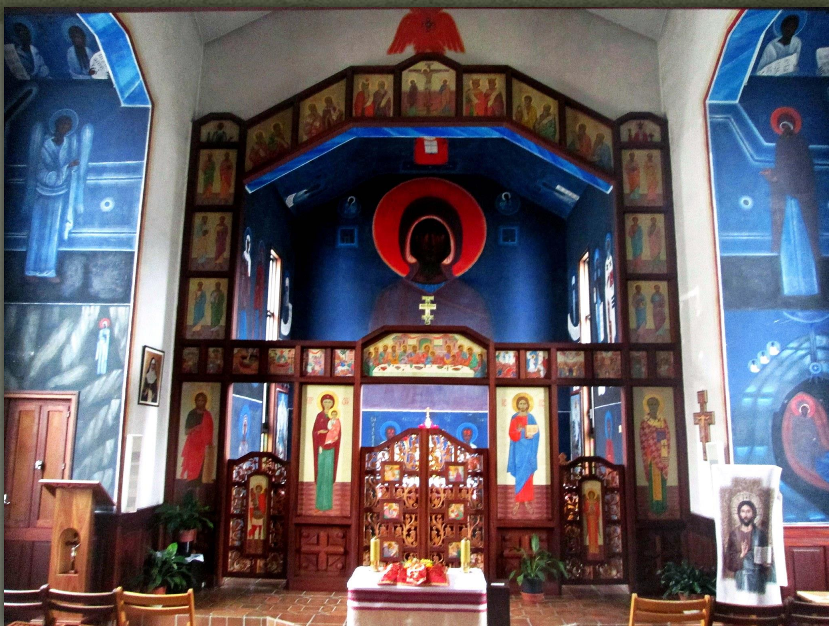
➤ Іконостас, церква Успіння Пресвятої Богородиці в Лурді, Франція, 1982.