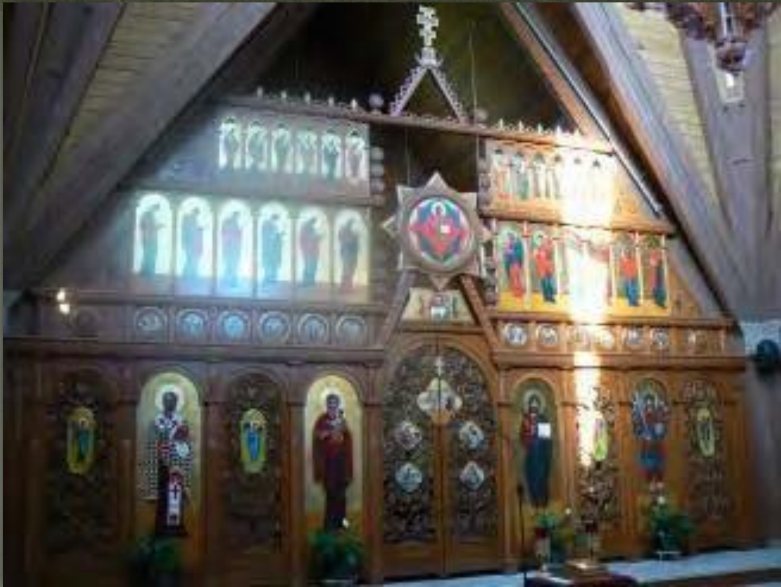
➤ Іконостас, церква Архістратиґа Михаїла, Jenkinstown, PA, 1992.