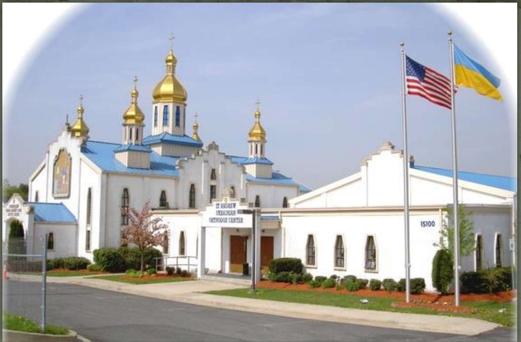
➤ Собор св. Андрея Первозванного, Silver Springs, MD, 1987.