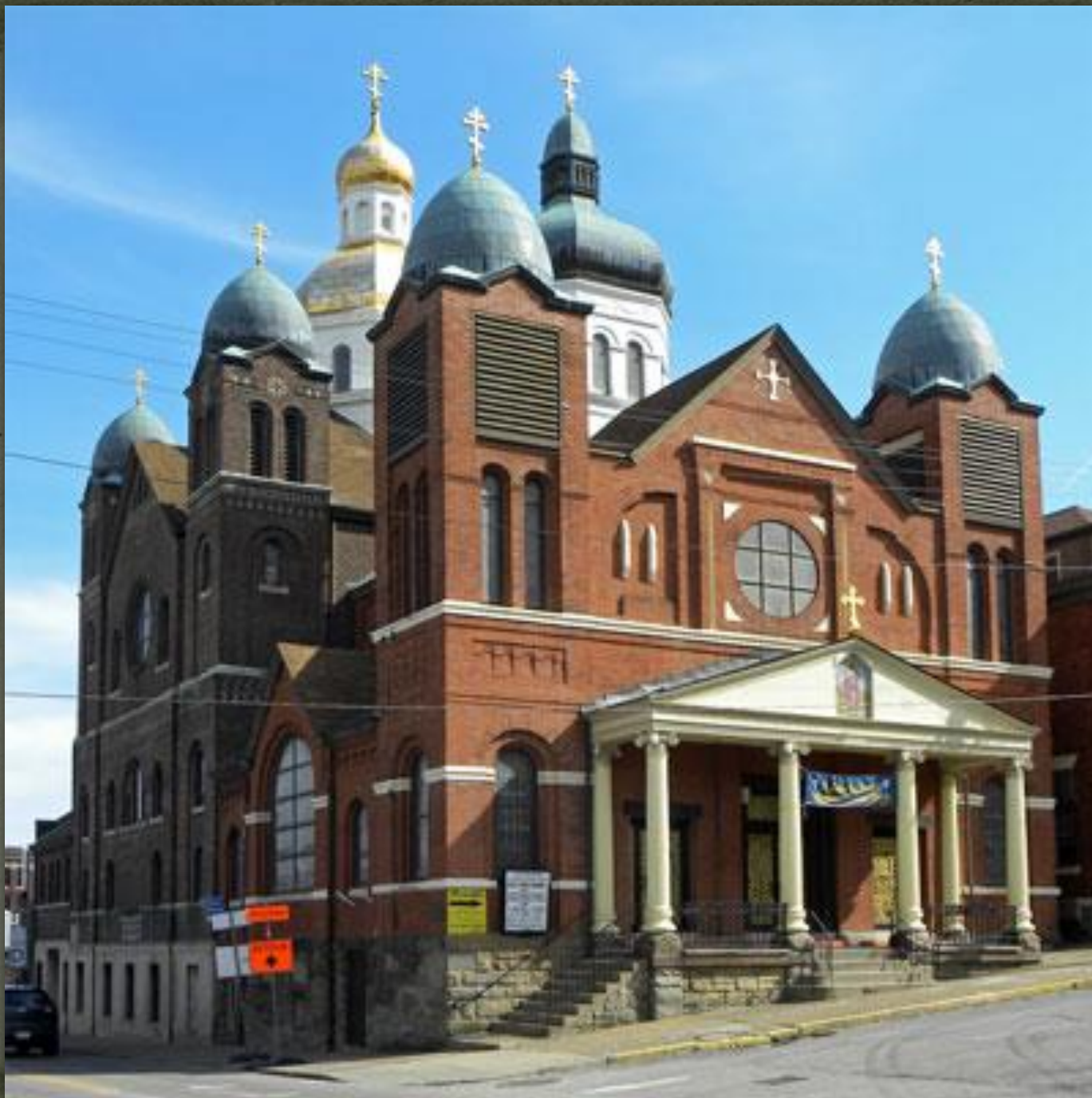
➤ Церква Івана Христителя, Пітсбург, 1895 р.