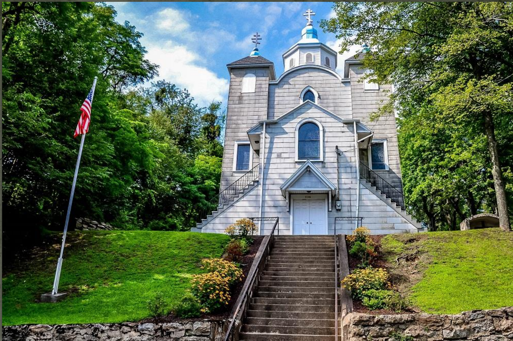
➤ Церква Успіння Пресвятої Богородиці, Centralia, Pennsylvania, 1911 р.