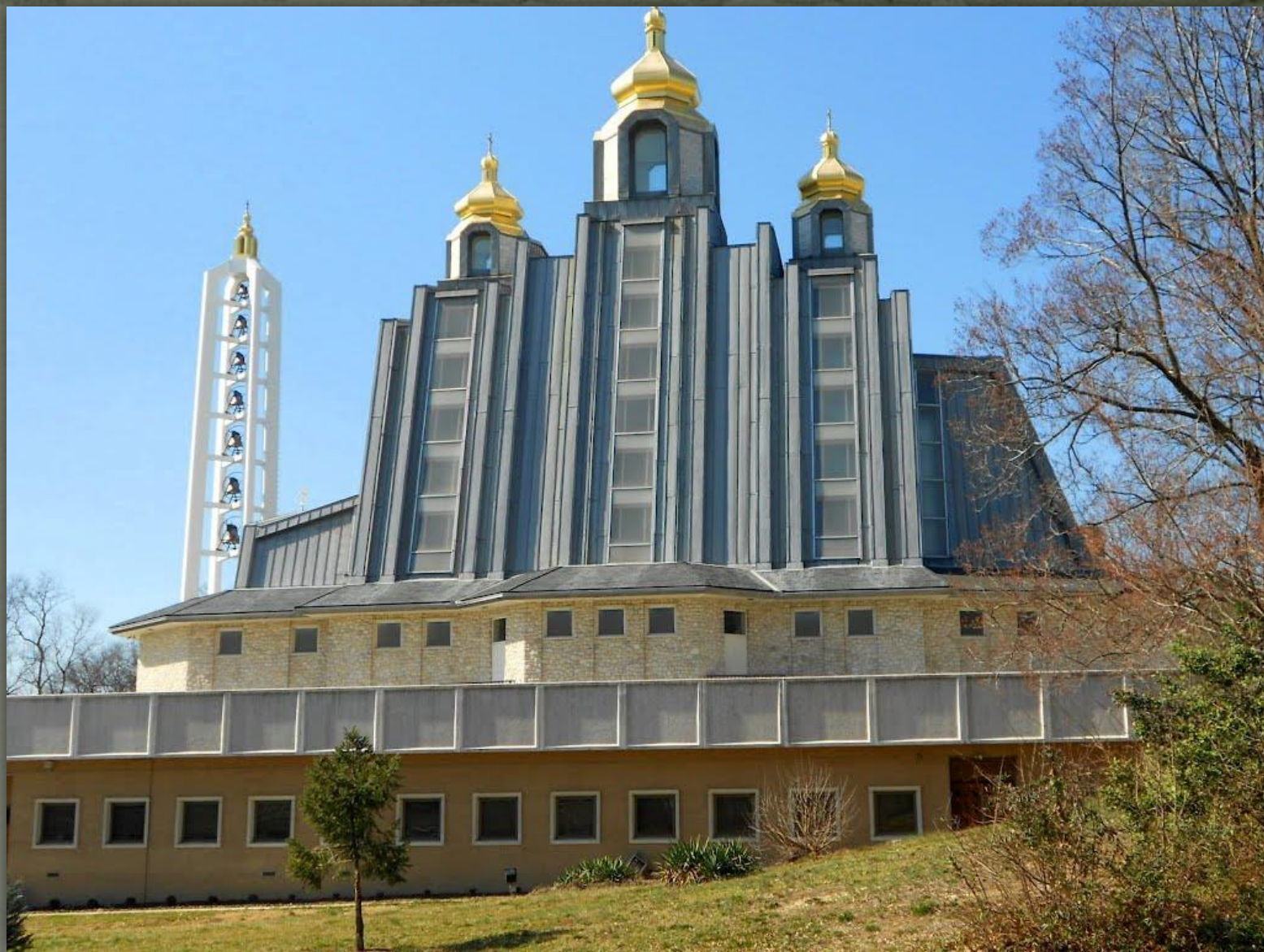
➤ Собор УГКЦ Пресвятої Родини, Вашингтон, МД, 1999.