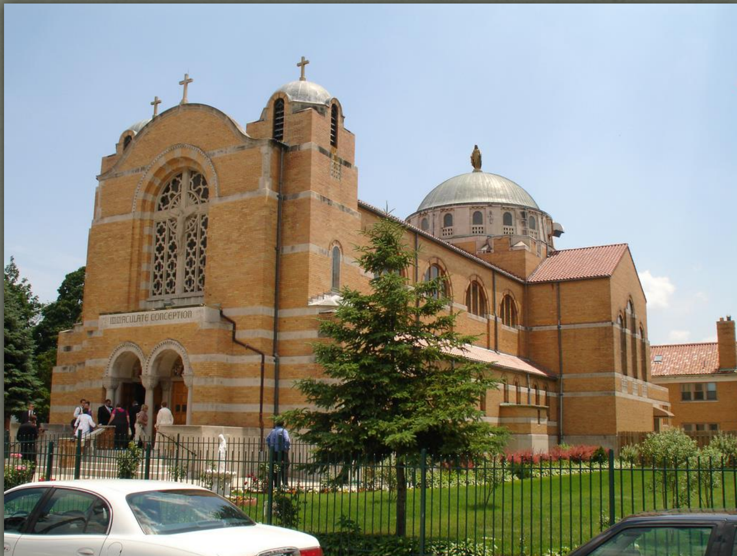
➤ Церква Непорочного Зачаття, Hamtramck, MI, 1942 р.