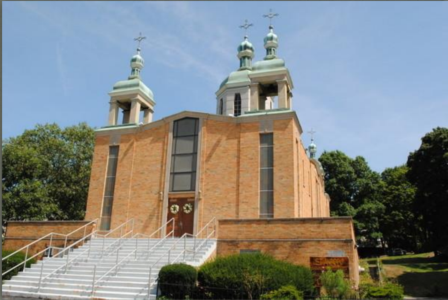
➤ Українська православна церква св. Андрія в Бостоні, 1954 р.