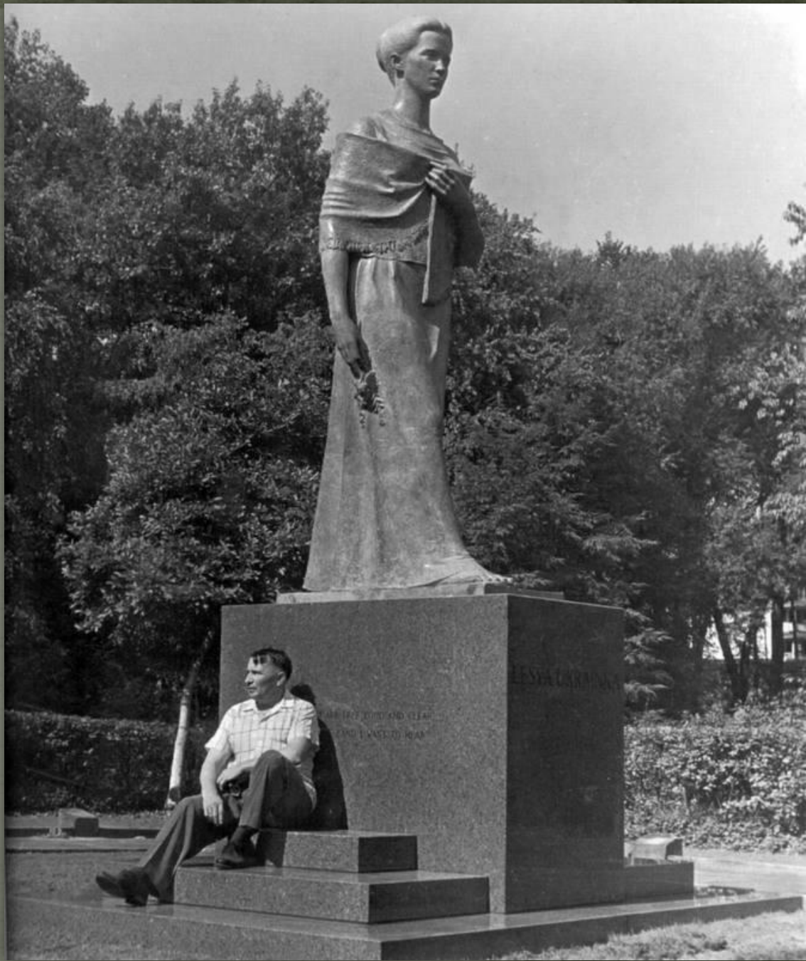
➤ Л. Українка, Клівеланд, 1961