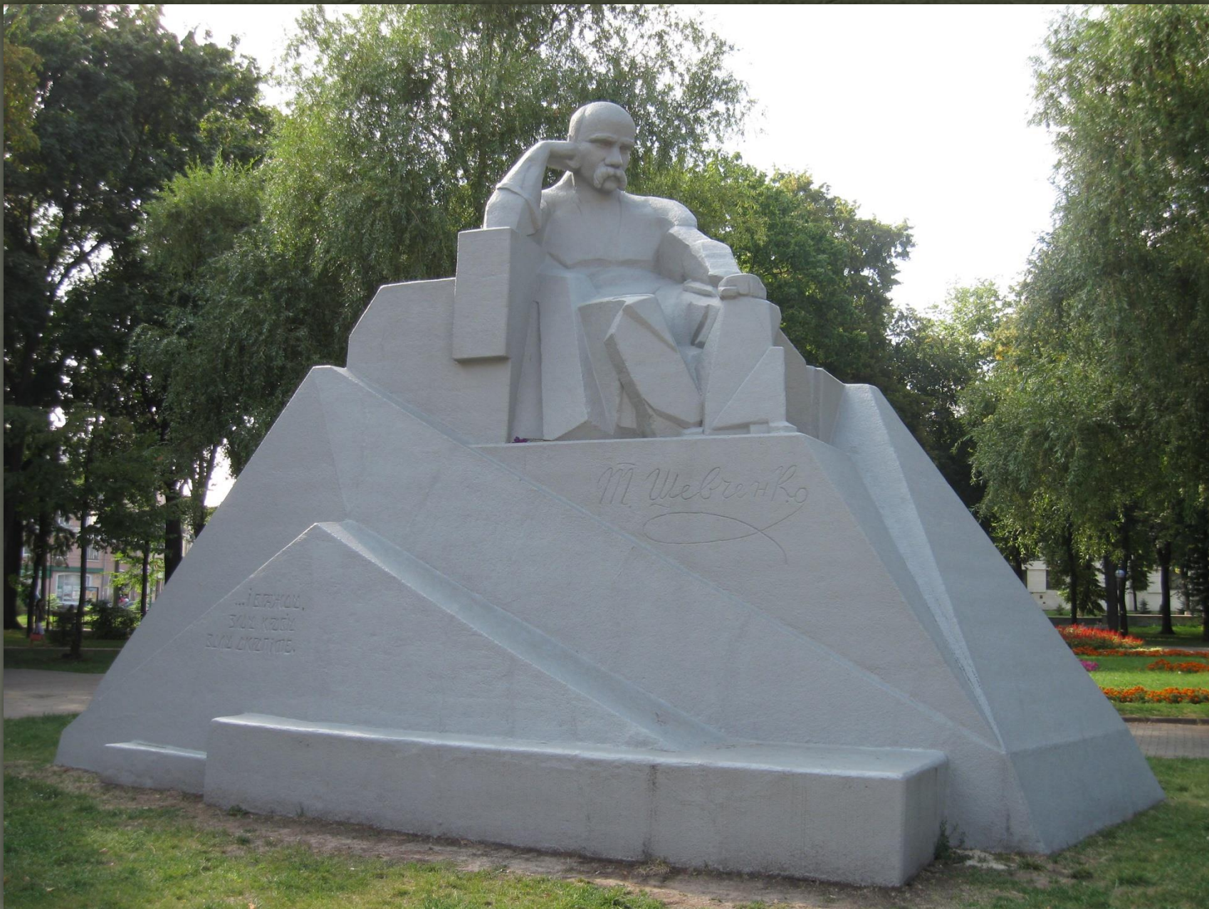
➤ Пам'ятник Тарасу Шевченку в Полтаві, 1926.