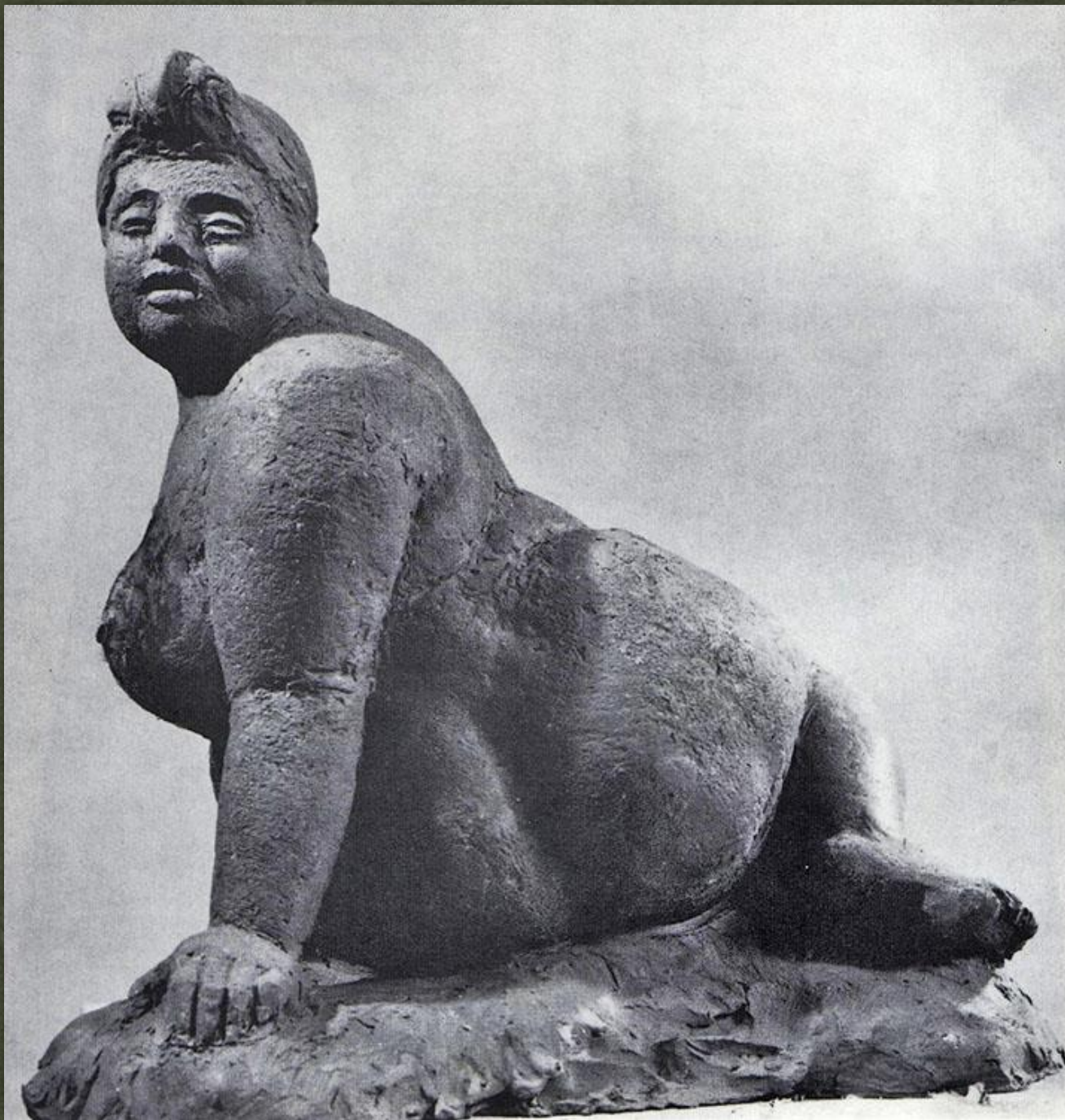
➤ Оголена (Нудистка). 1972. теракота