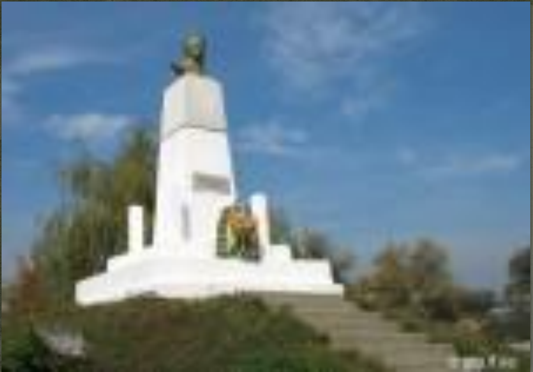
➤ Пам'ятник Тарасу Шевченку в Косові.