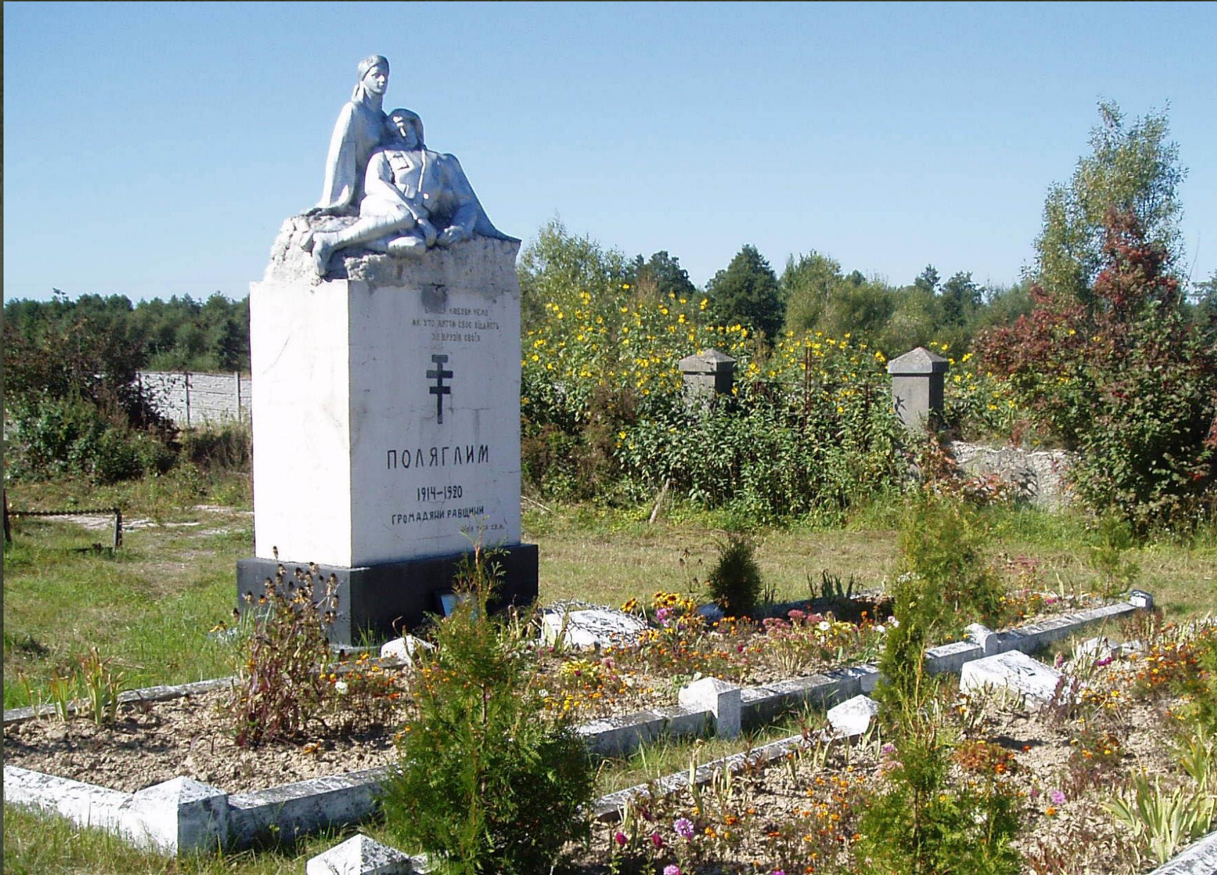
➤ Пам'ятник українцям, полеглим в Українсько-польській війні у Раві-Руській.