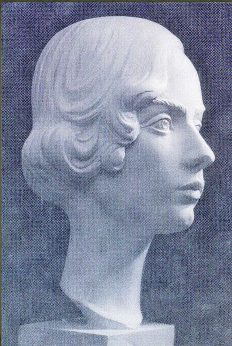
➤ Панна Демянів. 1971. Пластер.