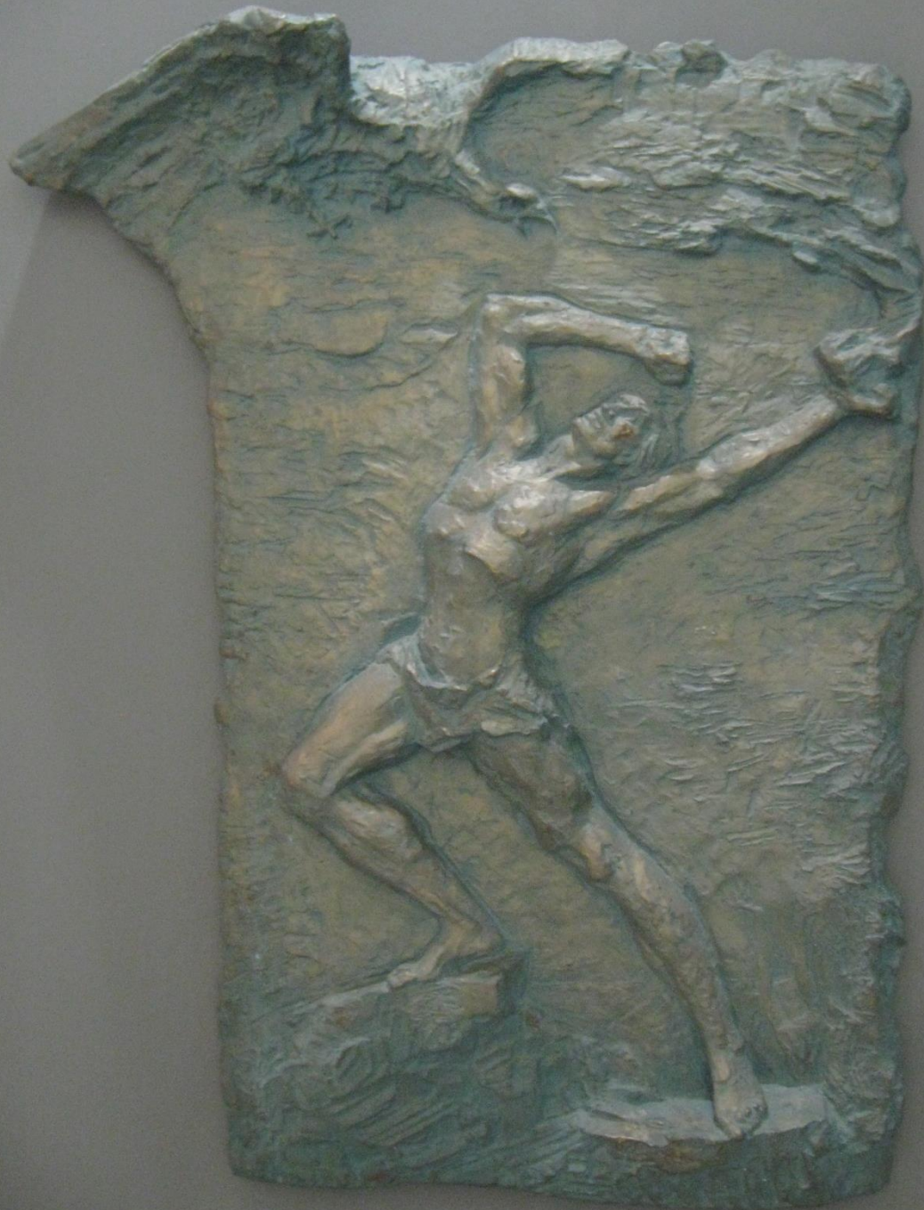
➤ Прометей 1962