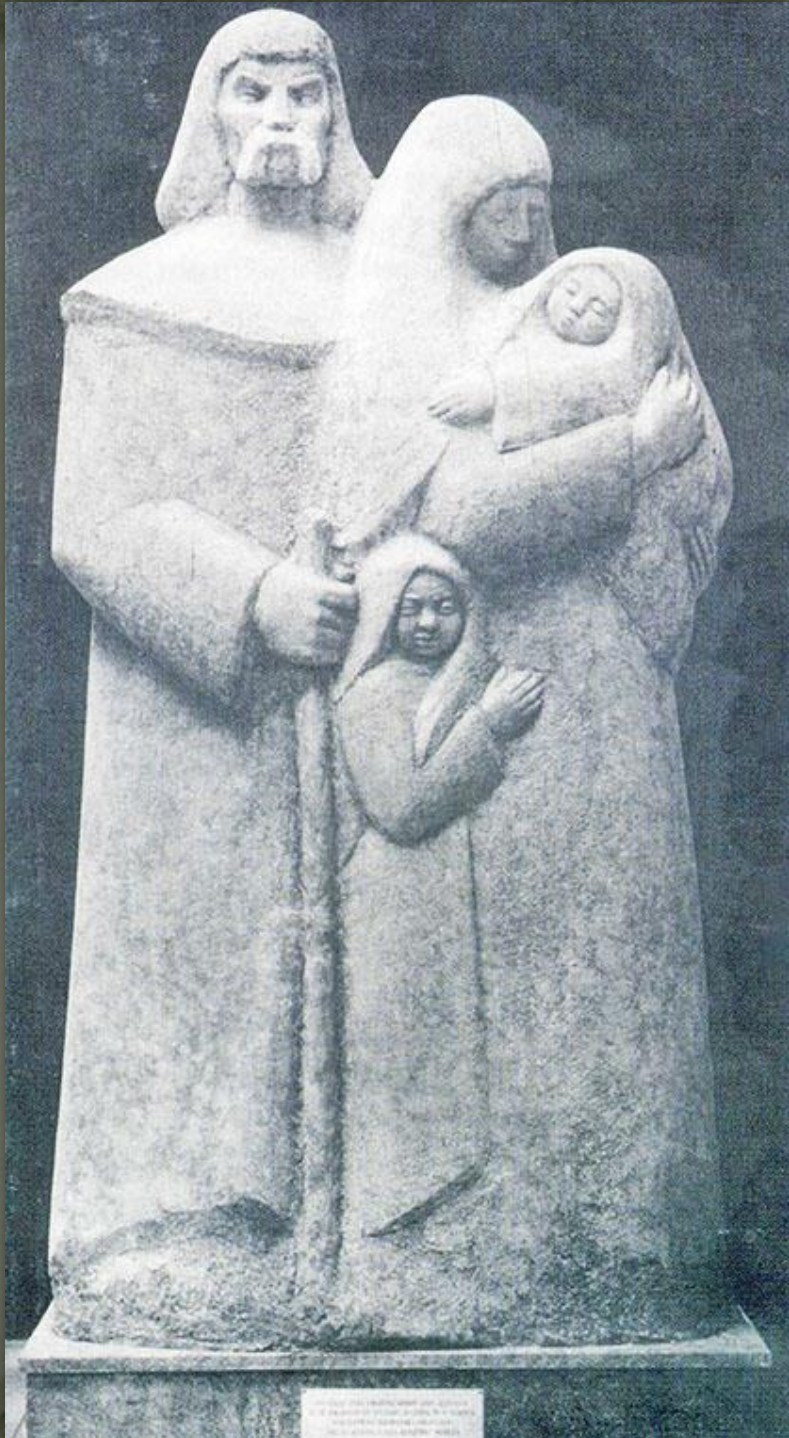
➤ Родина біженців. 1938. Бетон.