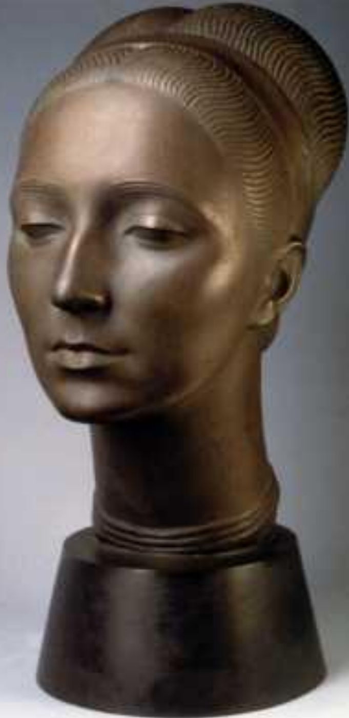
➤ Портрет дружини. 1950 р.