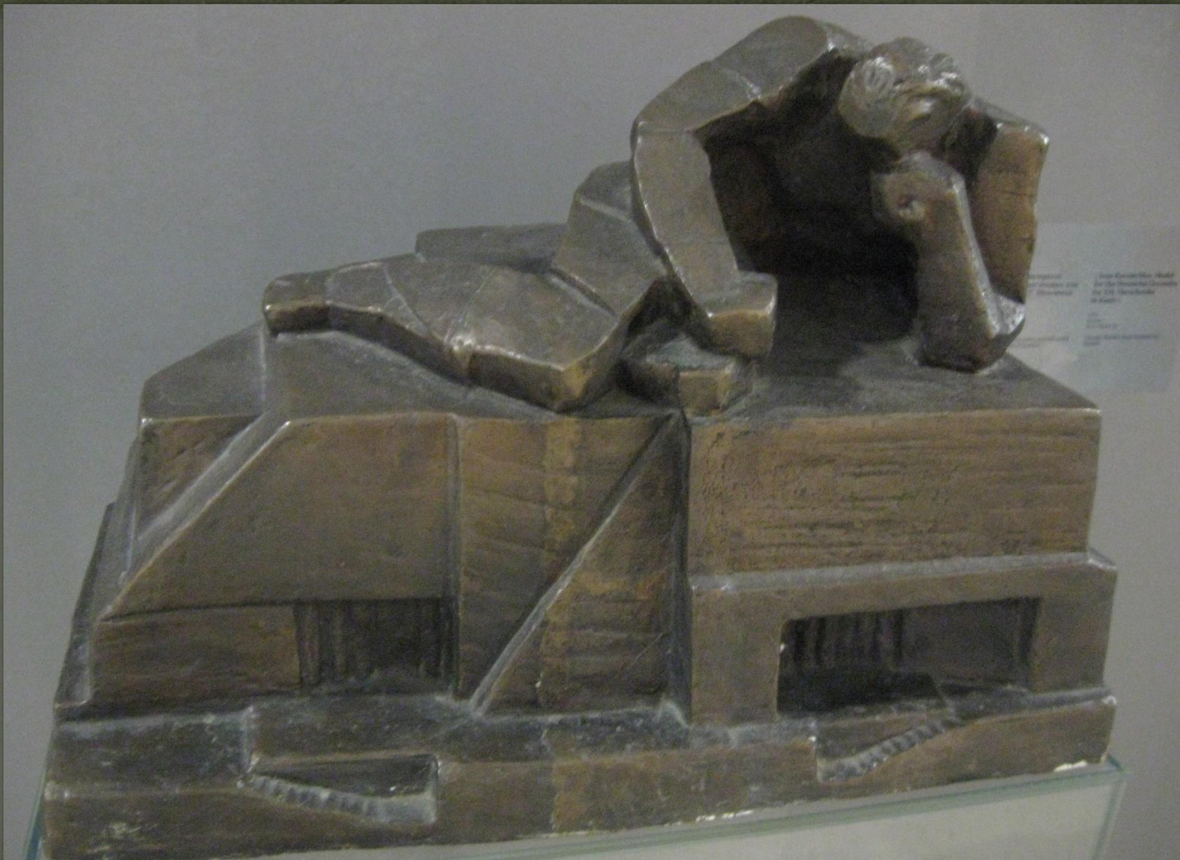
➤ Проект пам'ятника для могили Т.Г. Шевченка в Каневі (1936 р. бронза).