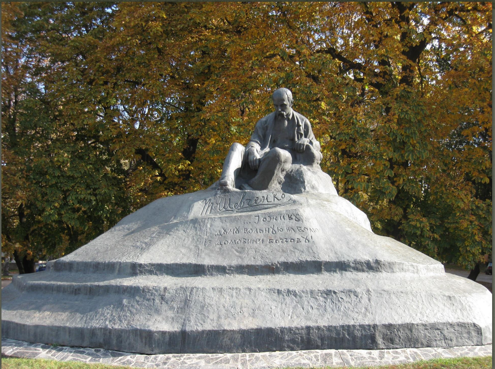
➤ Пам'ятник Тарасу Шевченку місто Суми, .