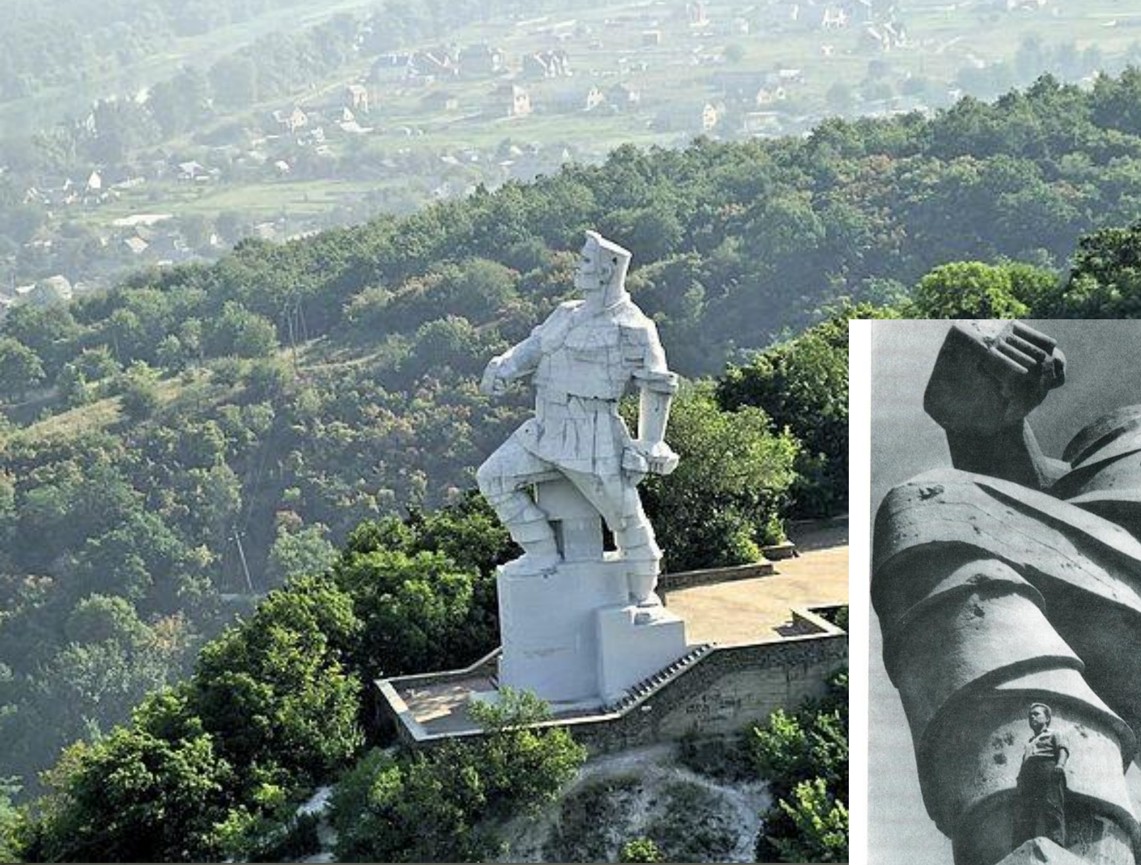
➤ Пам'ятник Артему, Святогорськ, 1927.