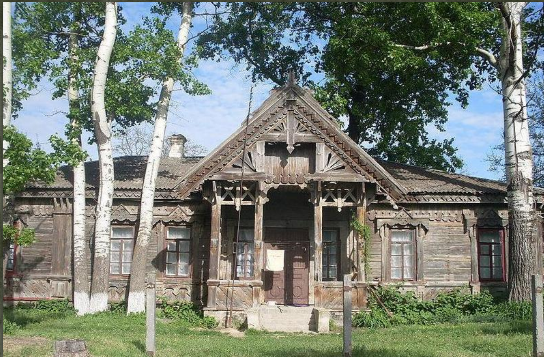
➤ Хата, с. Мошні, Черкащина, пол. 19-го ст.