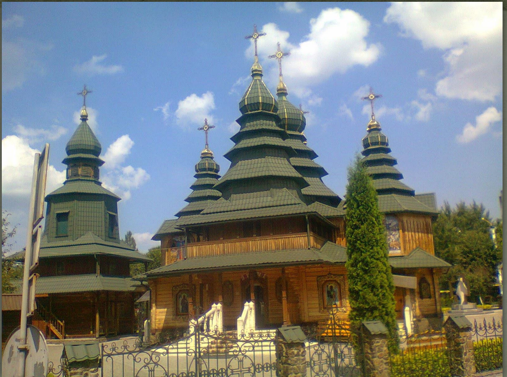
➤ Храм Покрови Пресвятої Богородиці, Львів, 2003.