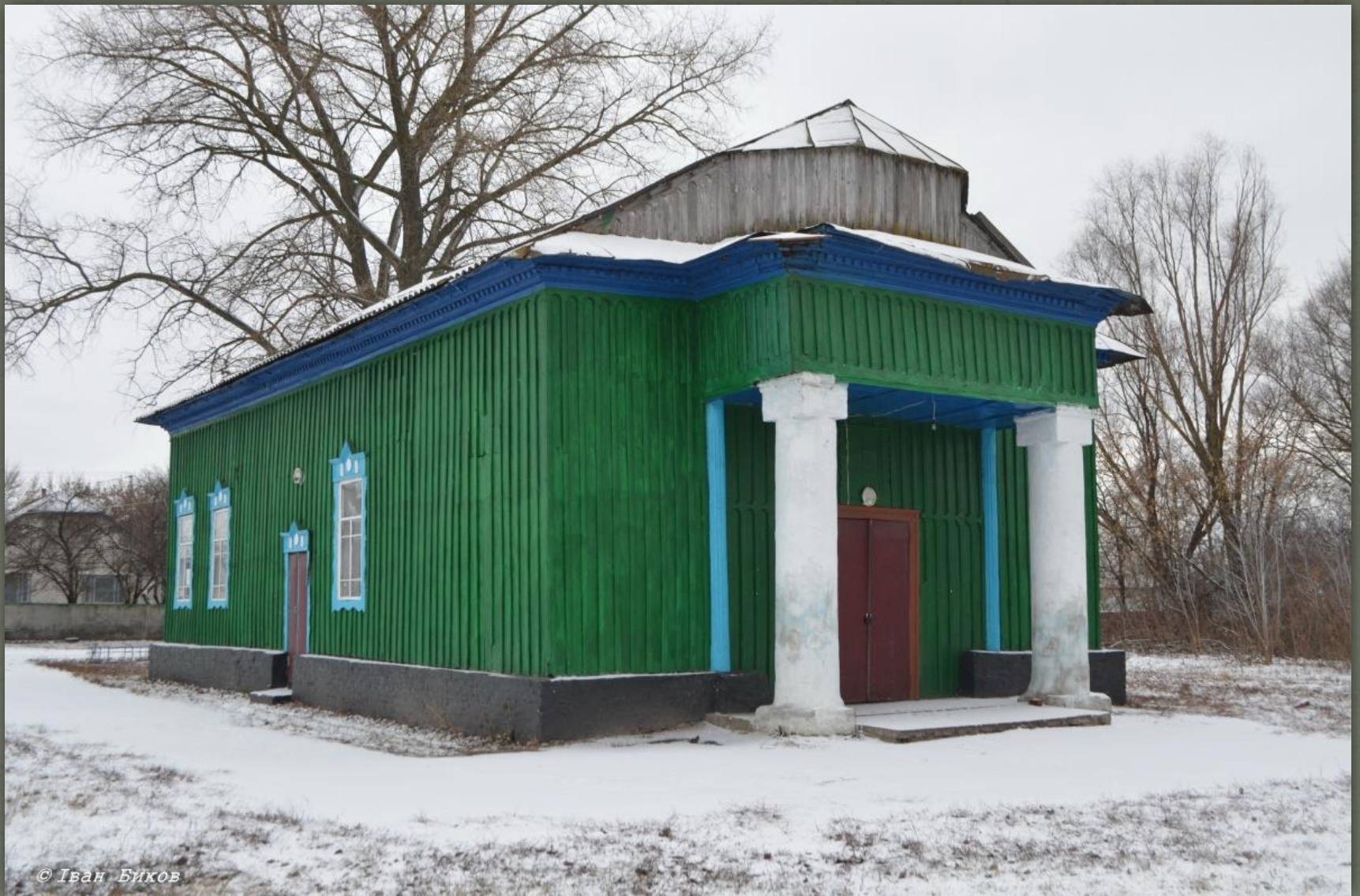
➤ Дерев'яний німецький костел з 18-го ст.