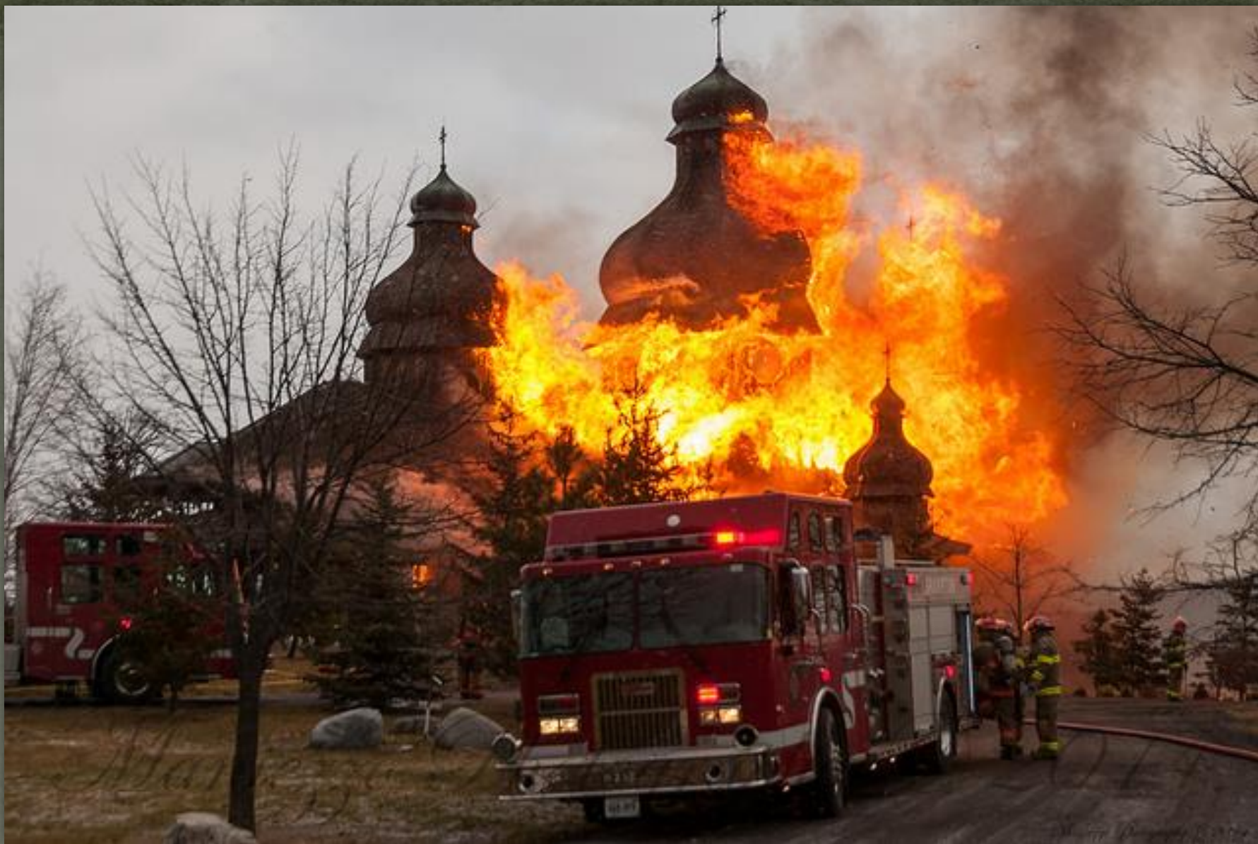
➤ Церква св. Іллі, Торонто, 1995-2014.