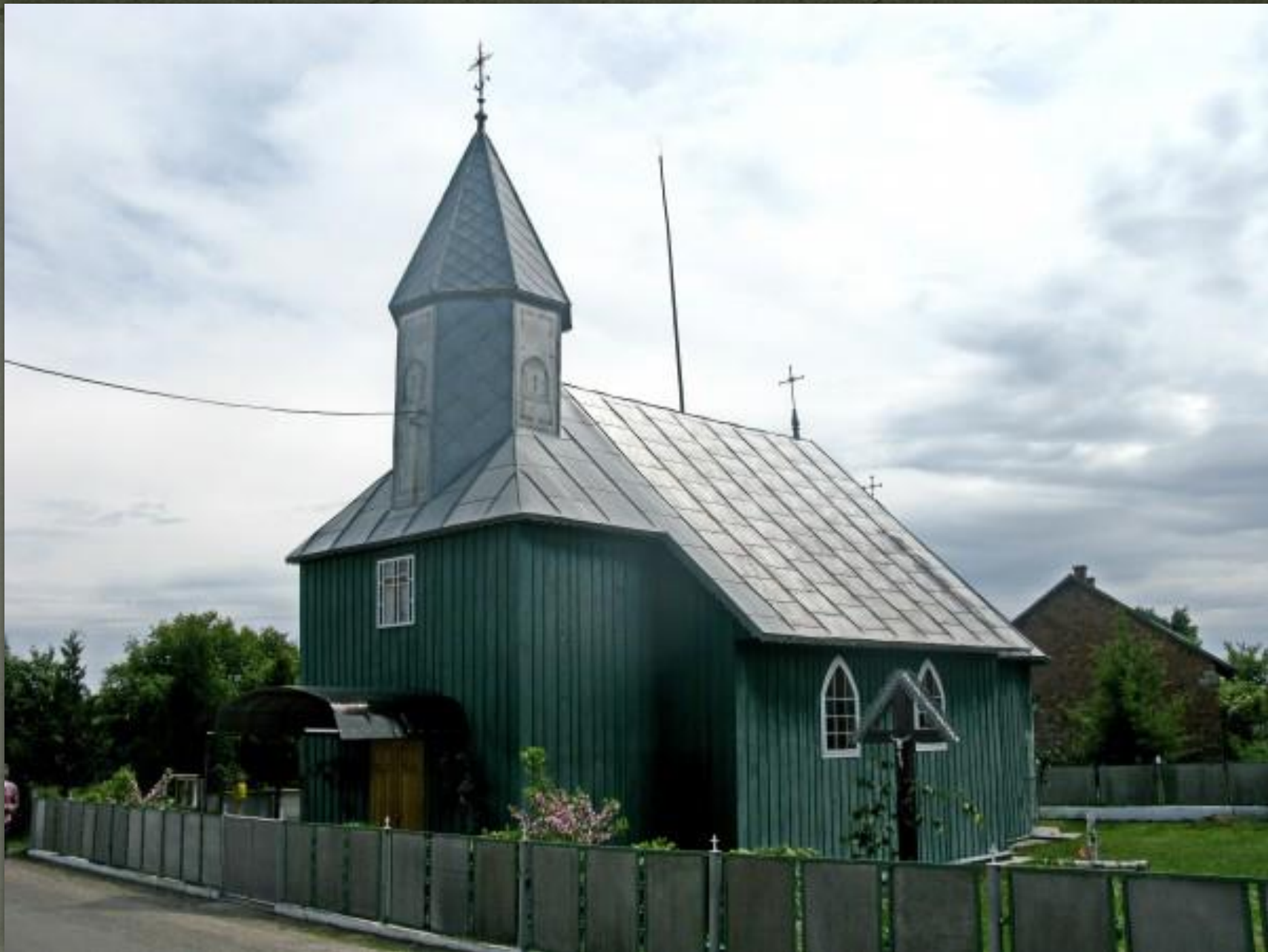
➤ Костел Св. Архангела Михаїла, Буковина, 1882.