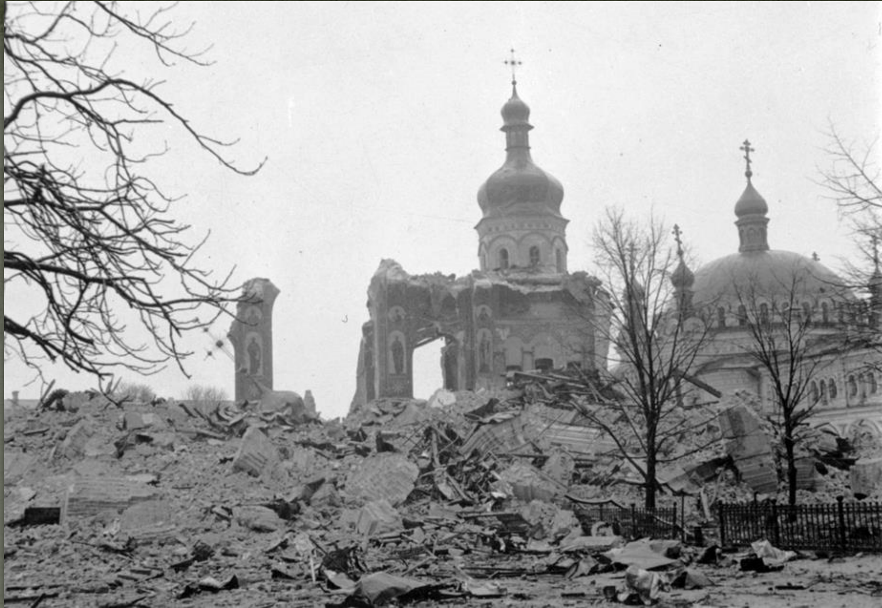
➤ Руїни Успенського собору Печерської Лаври, Київ, 1941-42.