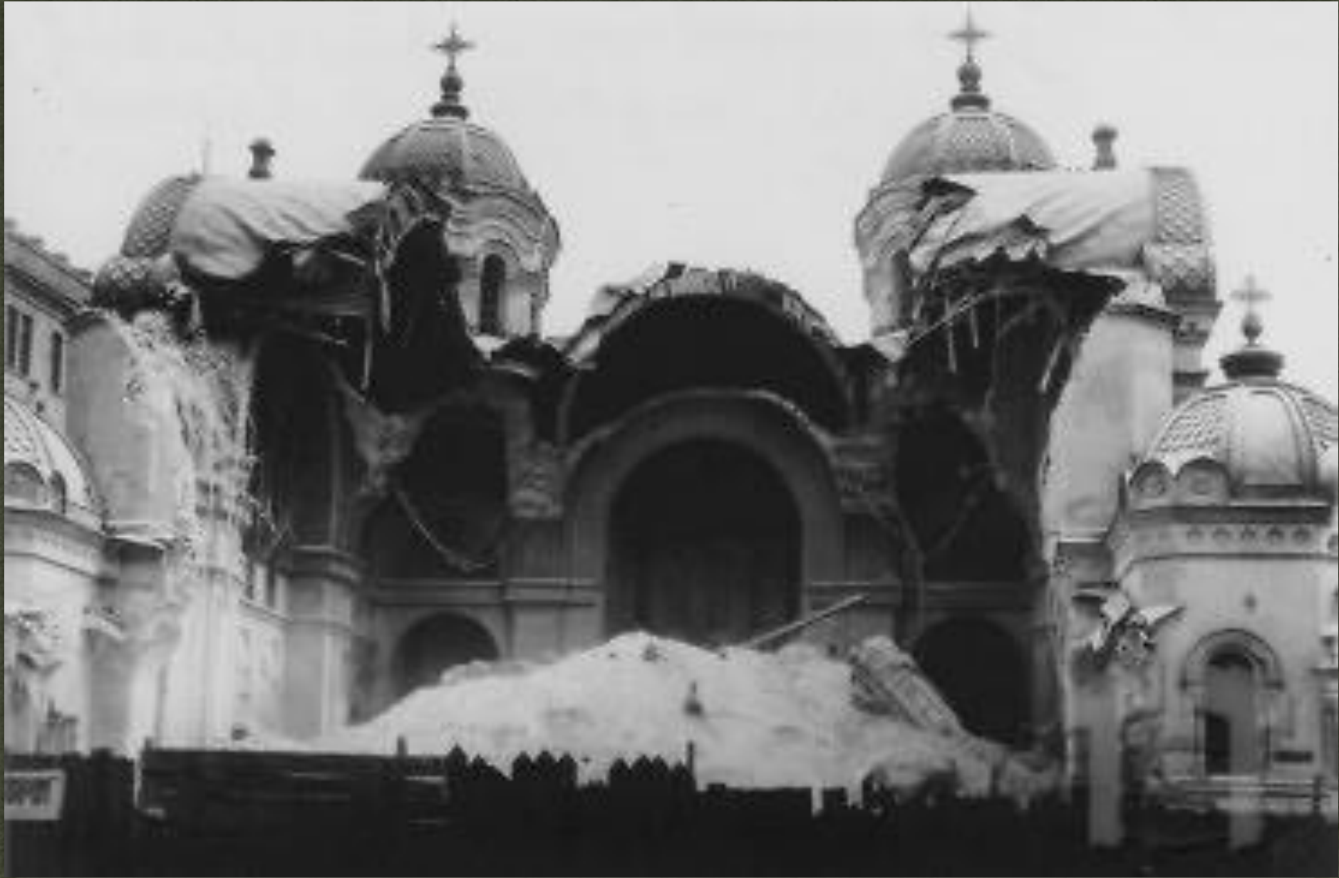
➤ Михайлівська церква у Харкові, руїни після знищення, 1930-ті роки.