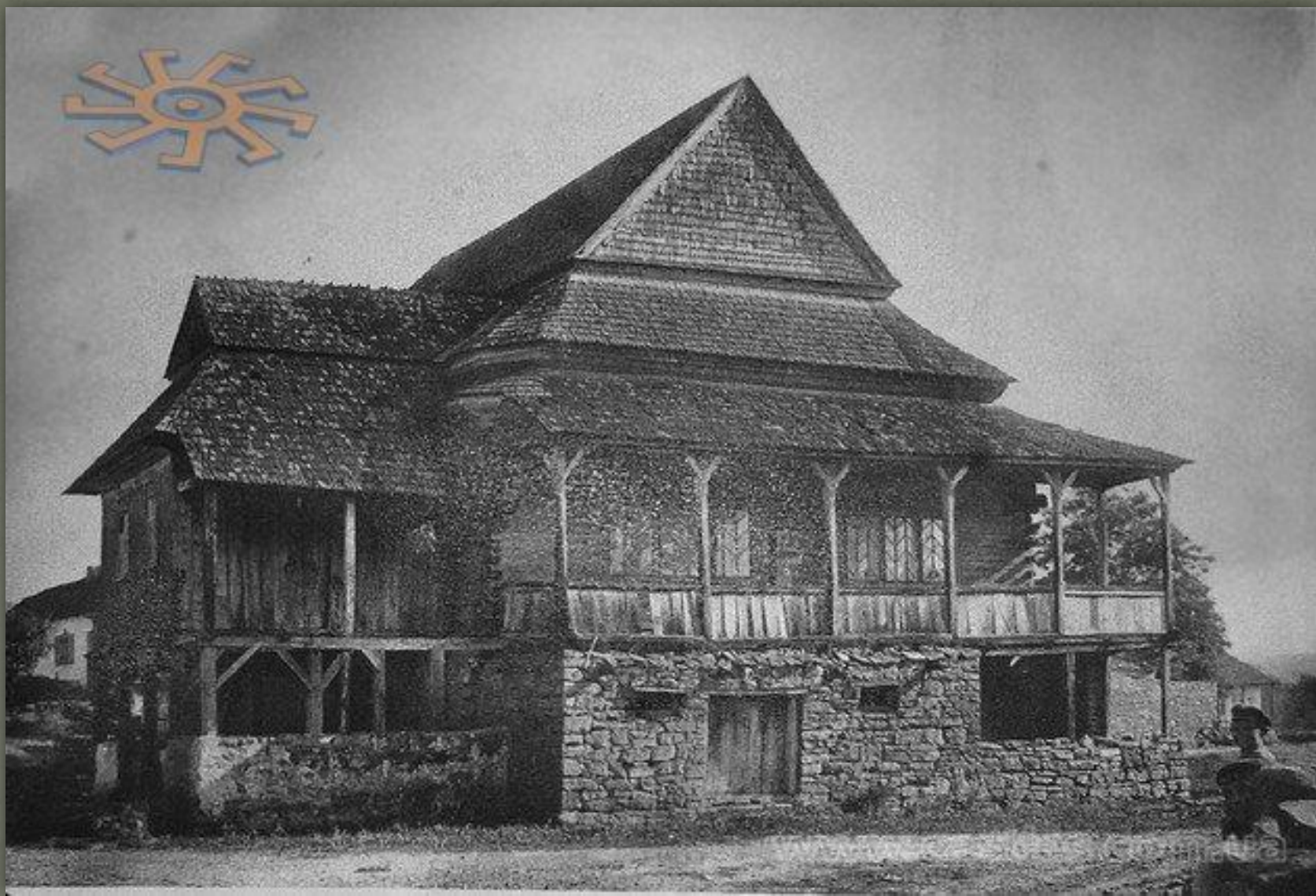
➤ Дерев'яна синагога у Яришеві, Вінницька обл., фото із 1930-тих р.