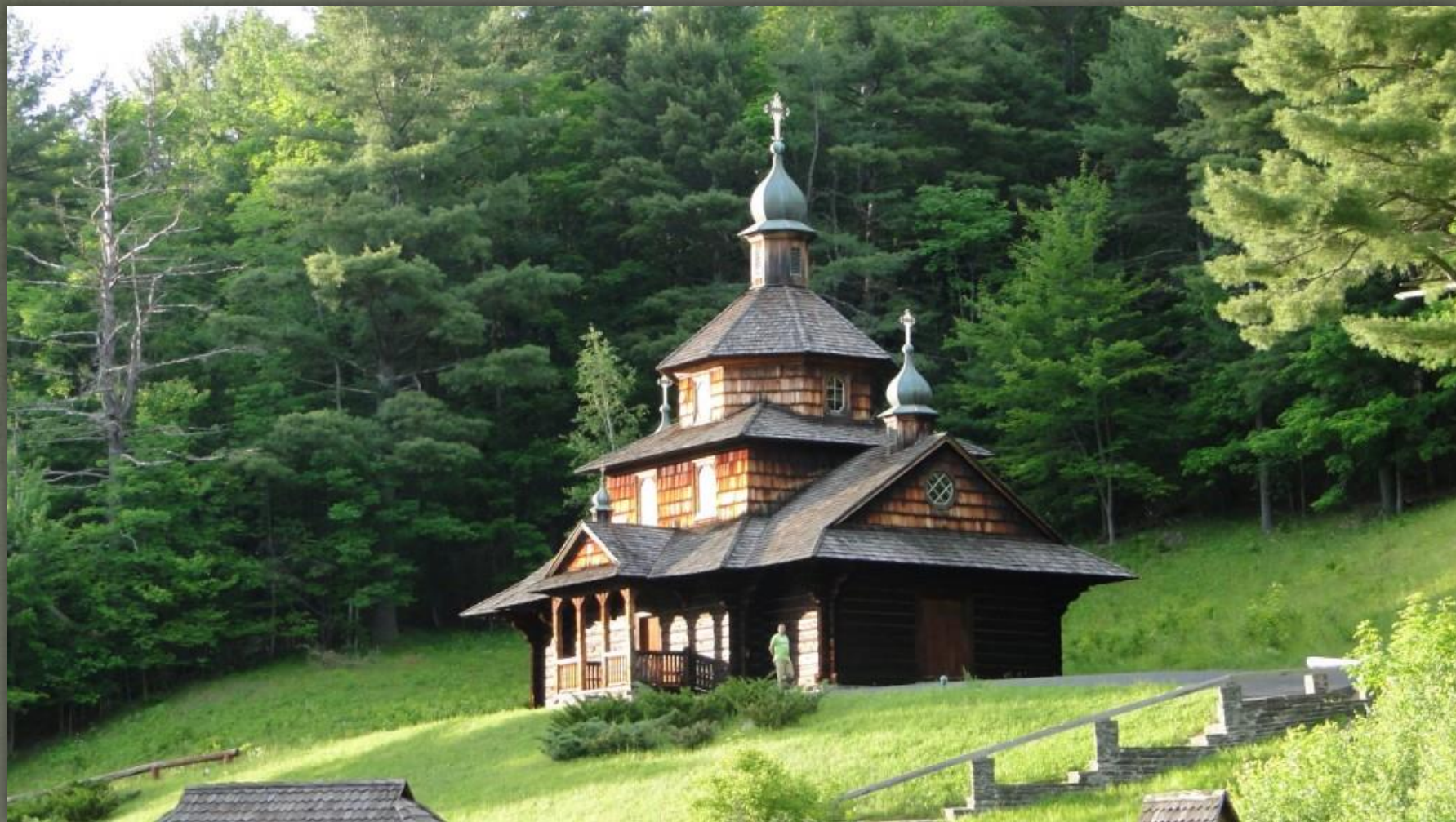
➤ Церква св. Івана Хрестителя, Гантер Нью Йорк, 1964.