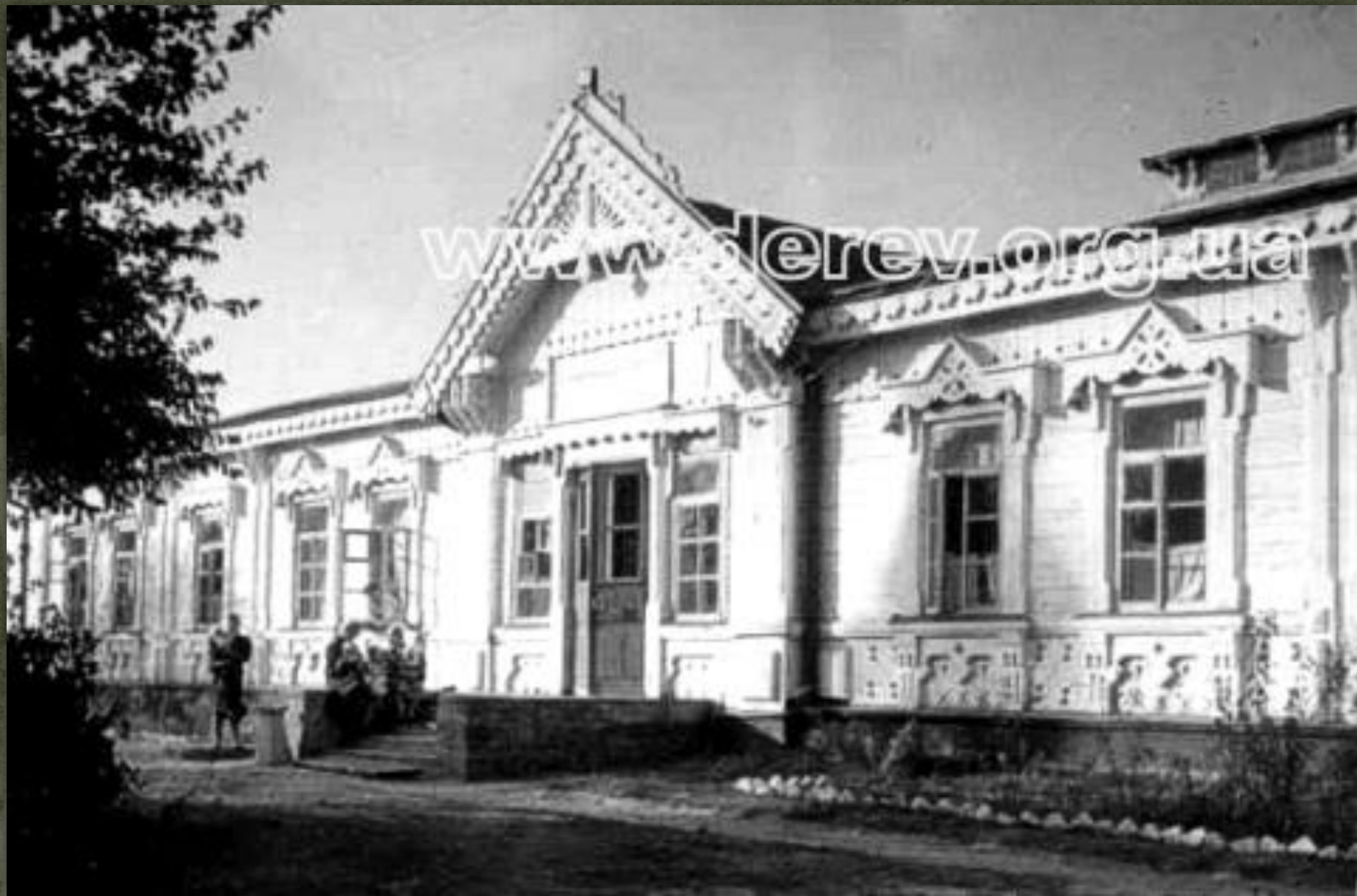
➤ Лікарня, Київщина 1909.