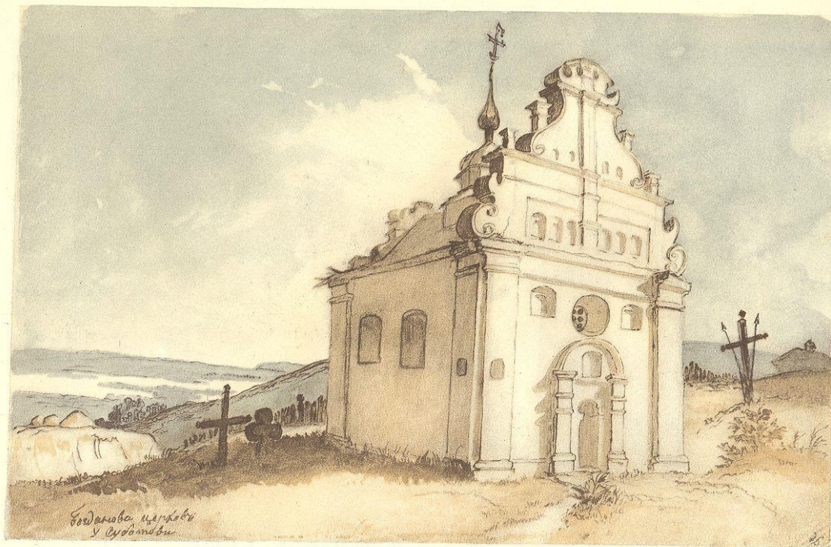
222. БОГДАНОВА ЦЕРКВА В СУБОТОВІ. Акварель. [IV—X 1845].

➤ Тарас Шевченко, «Богданова церква у Суботіві», 1845.