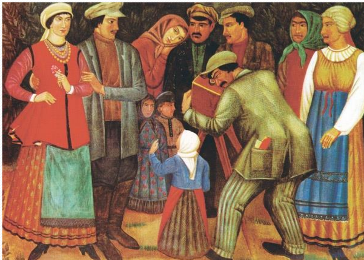
➤ Іван Падалка, «Фотограф», 1927.