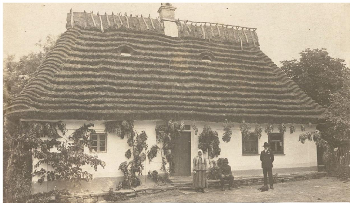
Plebanówka. Dekoracja domu na Zielone Święta. 1924r.

❖ Ці прикраси мали охоронити хату та її жителів від злого, і теж вітали прихід літа, як і заохочували добрий урожай.