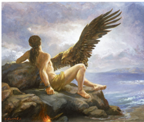
Прометей прикутий до кавказьких гір

В цій поемі Шевченко прославляє кавказькі народи, які довгі роки провадили боротьбу проти московського поневолення (і ще далше провадять) . Шевченко пише, що ніхто не може скувати душу людини і що людина завжди буде