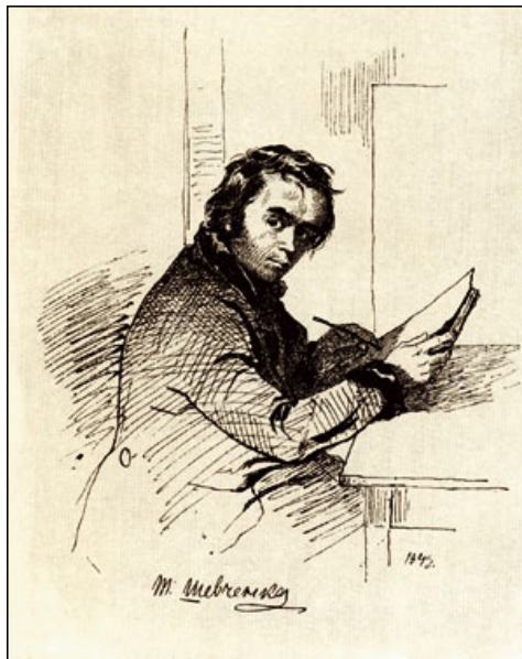
Self-portrait. Indian ink, 1843.

Коли б не Він, то й люди б нас не знали, Коли б не Він, про нас не чув би світ.