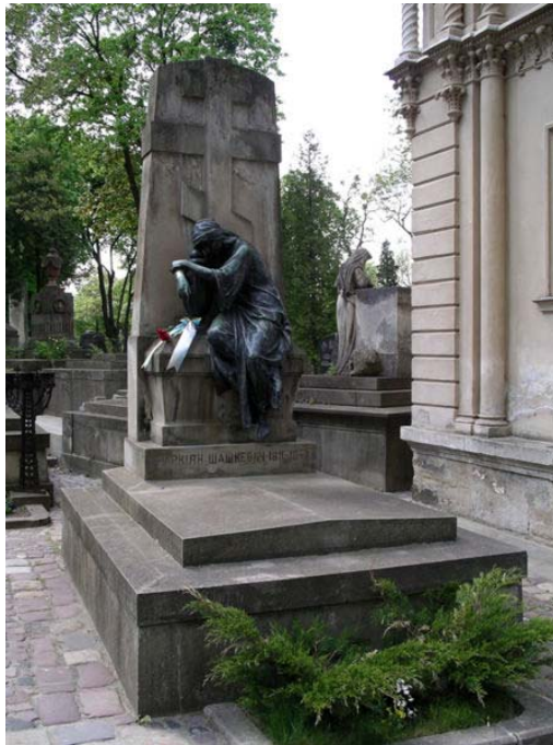
пам'ятник на могилі Маркіяна Шашкевича у Львові

Головна заслуга Маркіяна Шашкевича це те, що він перший в Галичині почав писати українською мовою і тим підніс українську мову на літературну мову. Його наслідували інші письменники і так почала розвиватися українська мова й література в Галичині. Це був початок літературного й національного відродження на західних землях України.