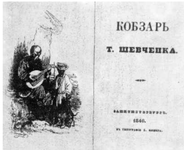
Кобзар – виданий 1840 р.

В 1840-ому році вийшов друком перший Кобзар - збірка його віршів. Московські критики неприхильно поставились до Кобзаря , але в Україні Кобзар викликав велике захоплення.