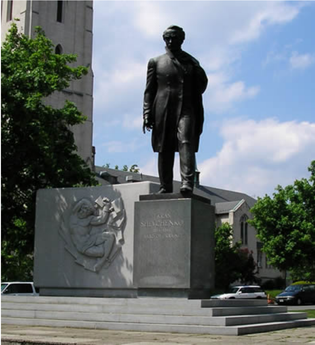
пам'ятник Шевченка у Вашингтоні