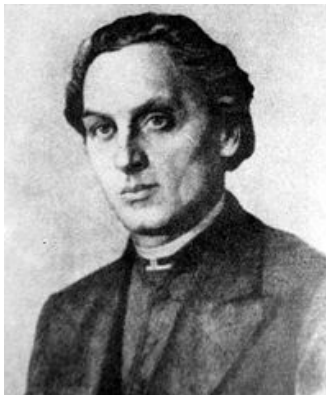
о. Маркіян Шашкевич