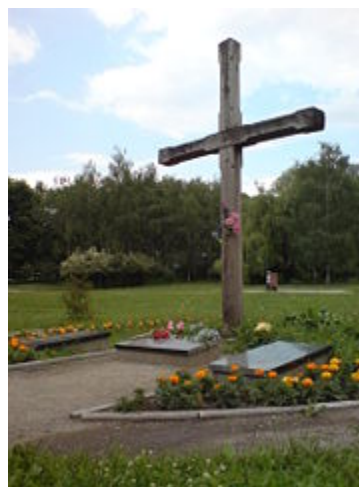
хрест на могилі Олени Теліги в Києві (Бабин Яр)