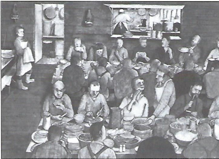
В. Курилек, Снідання лісорубів, 1973, олія на месоніті.

Високопрофесійними послідовниками традицій реалізму у діаспорі були