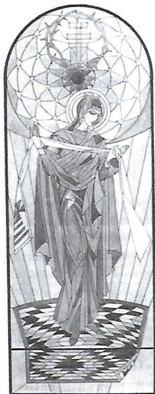
П. Холодний, Богоматір. Вітраж в Успенській церкві у Львова, 1920-і роки.

Мабуть кожний модерний стиль придбав собі послідовників серед українських малярів. Чимало з них — це мистці великого таланту, якими українське мистецтво може гордитися перед світом.