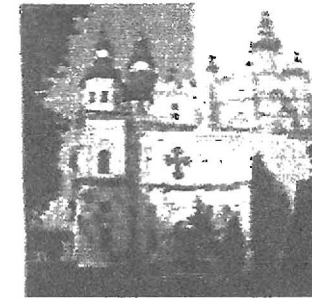
Троїцький собор Троїцько-Іллінського монастиря, Чернігів. 1679–1689 роки