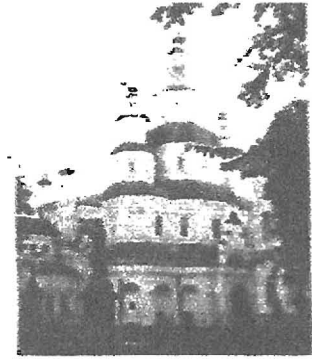
Покровський собор, Харків. 1689 рік

Значний внесок у розвиток української архітектури зробив Іван Мазепа. Він не тільки фундував нові церкви, але й турбувався про реставрацію давніх храмів. Будівлі в стилі мазепинського бароко (а він має децю відмінні риси від раннього козацького бароко) будували сучасники, соратники Івана Мазепи. Кращими зразками козацького бароко є Покровський собор у Харкові, Густинський Свято-Троїцький монастир у Прилуках, Троїцько-Іллінський монастир у Чернігові, Георгіївський собор Видуцького монастиря в Києві. В бароковому стилі