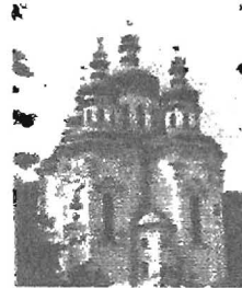
Георгієвський собор Видубицького монастиря. Київ. 1701 рік