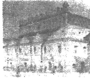
Оборонна синагога в Жовкві. 1698 рік. Світлина 1905 року.