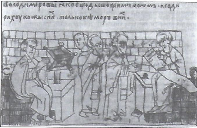
Переписування книжок у бібліотеці Софійського собору. Мініатюра з Радзивілівського літопису.

Заставки — орнаменти вгорі першої сторінки тексту книжки або на початку розділу. Заставки були переважно вміщені в прямокутник і складались з геометричних орнаментів — кубиків, гарно сплетених між собою, рослинних мотивів (наприклад, в'язки квітів та листків) і не раз включали зображення фантастичних тварин, птахів чи людських постатей.