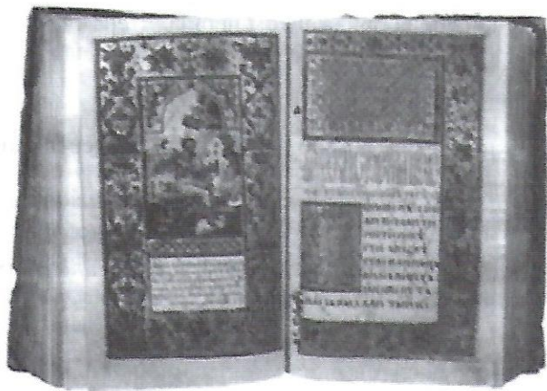
Пересопницьке Євангеліє (1556-1561 pp.) — реліквія українського народу. На ньому присягають новообрані президенти.

Радзивіллівський літопис з XV ст. (названий так тому, що останніми його власниками були литовські князі Радзивілли). Книжка багата на ілюстрації — їх понад 600, які представляють картини з історії й побуту давньої України. Саме цим літописом поширився звичай давати до книжок більше картин з історії та побуту українського народу.