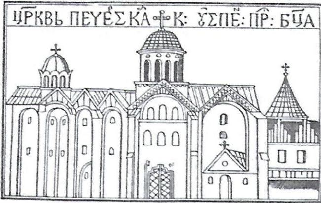
Успенський собор Києво-Печерської лаври. 1623 р.

ОЛЕКСАНДЕР ТАРАСЕВИЧ — найвизначніший тогочасний гравер на цілу Східню Європу. Тарасевич був основоположником української школи граверства і виховав цілу плеяду майстрів. Він ілюстрував багато книжок і виконав багато "тез" на прославу різних діячів, гербові композиції (родовідні дерева), атласи і т. д. Він був монахом Печерської Лаври та очолював її друкарню.