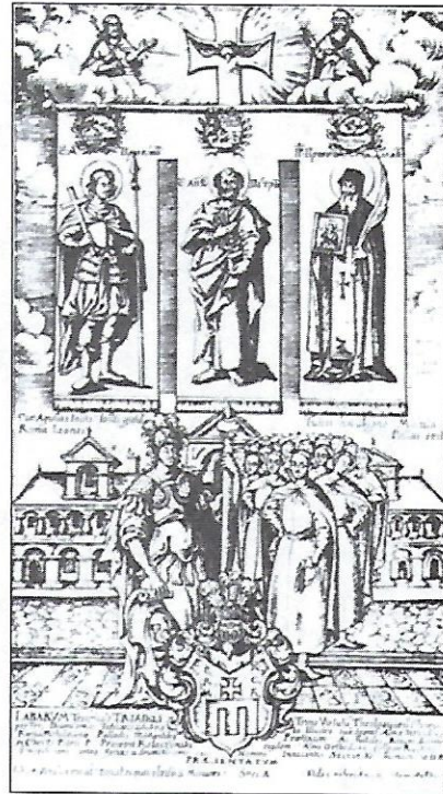
Іван Щирський. Teza на честь Прокопа Колячинського. 1690-і рр.