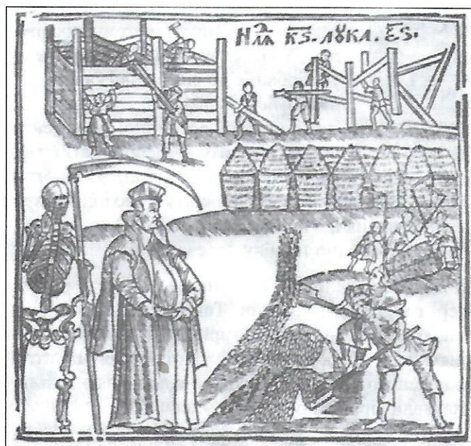
Невідомий гравер. Притча про багача і смерть. З "Євангелія учительного". 1637 р. Київ.

Першим осередком українського граверства був Львів. Там у половині XVI ст. майстер Лаврентій Філіпович створив граверську школу. Найстарша друкована книга з гравюрами, що збереглася в Україні, є Апостол , виданий 1574 р. львівським братством Успенської церкви. Не-