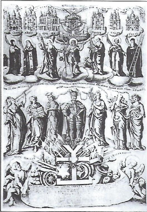
Іван Мигура. Прославлення гетьмана І. Мазепи. 1700 р.