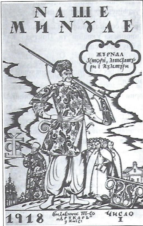
Ю. Нарбут. Обкладинка журналу "Наше минуле". 1918 р.

фіки. Ю. Нарбут спирався передусім на традиції української бароккової графіки. Він вважав козацьке барокко найкращим здобутком українського мистецтва в минулому і таким, що найбільше відповідає життєрадісному українському характеру. У цьому стилі виконані його прекрасні ілюстрації та орнаменти до книжок, оригінальний мистецький шрифт української азбуки, що його він виробив на базі давніх українських рукописів, чудові рисунки до букв в абетці, ілюстровані гральні карти тощо. Та найбільшу славу принесли йому виконані ним гроші незалежної української держави 1918 р. Творчість Нарбута була насичена українським духом і тому незважаючи на високу її цінність, комуністи стримували її поширення серед народу.