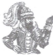
Великий князь литовський Ольгерд Грознаго XV століття

син Ольгерда Володимир; на Чернігово-Сіверщині — другий син — Корибут-Дмитро; на Поділлі — племінники Ольгерда — брати Коріятовичі. Князі сплачували щорічну данину та надавали збройну допомогу. Руська мова була державною. Збереглося законодавство Русі-України — «Руська правда».