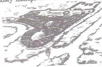
Нова (Підпільненська) Січ із передмістям Гасан-Баши

Суттєвими особливостями Нової Січі були її контрольованість імперською владою — в межах зовнішнього коша (Гасан-Баши) навіть було споруджено російську цитадель-фортецю з військовою залогою — та