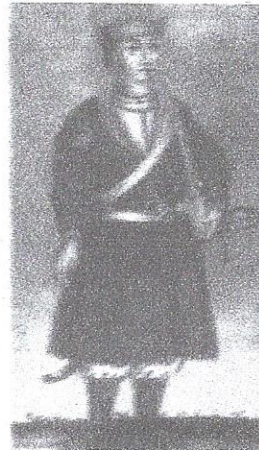
Козацький однострій — свій мундир з червоним коміром і білі штани — після військової реформи

Під час гетьманування Кирило Розумовський розгорнув активну діяльність в українських землях: відбудував Батурин, куди переніс столицю; розбудував Глухів, що залишився гетьманською резиденцією; навагодив діяльність старшинської ради, яка управляла Гетьманщиною за відсутності гетьмана; самостійно призначав полковників та роздавав землю у приватну власність. Щоправда, така бурхлива діяльність насторожила імператрицю, і Єлизавета