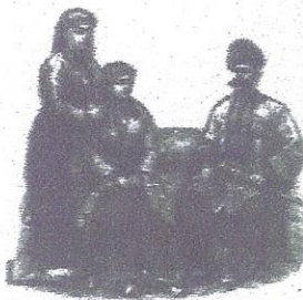
Вірменки та вірмени (греки та вірмени склали найбільші християнські громади Криму)

Кримські татари не бажали миритися з такою російською опікою, тож невдовзі відмовилися від неї. У відповідь, на територію Криму відразу були введені російські війська. Прикриваючись гаслом допомоги братам-християнам, протягом 1778–1779 років Катерина II організувала відселення вірмен та греків з Криму. Це завдало відчутного удару по скарбниці ханства, адже саме вірмени і греки були основними платниками податків.