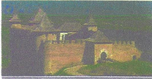
Хотинська фортеця. Світлина

Землі, розташовані між річкою Дністер і Карпатським хребтом, із численними буковими лісами називали Буковиною. У першій половині XIV століття краєм володіли Золота Орда та Угорщина. Із середини XIV століття Буковина відійшла до Молдовського князівства. Її там називали Шипинською