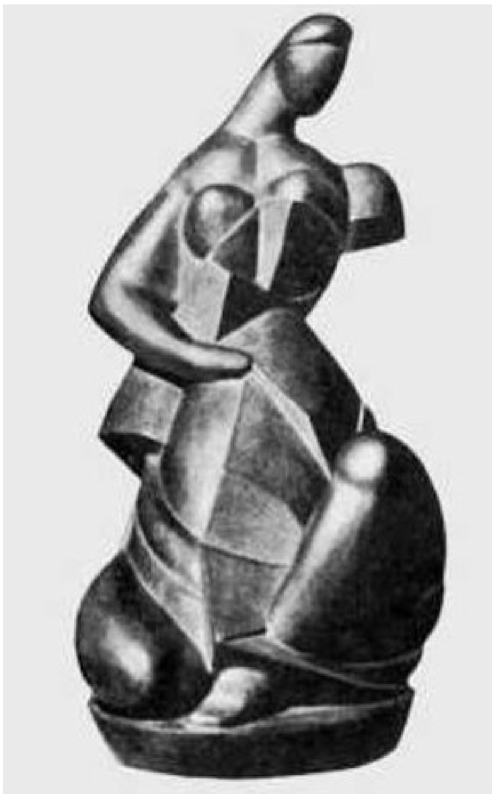
ЖІНКА ЩО СИДИТЬ