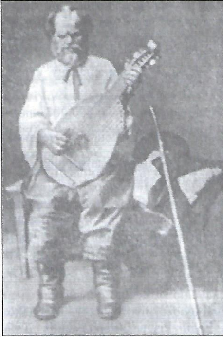
Кобзар Остап Вересай.

но жінки й дівчата двома хорами навпереміну. Мелодії весільних пісень досить прості, але різноманітні ритмами й настроями.