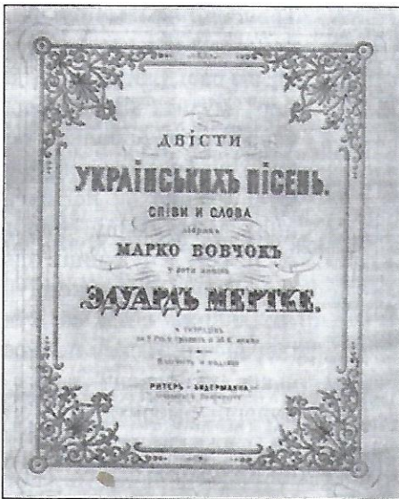
Збірка українських пісень, зібраних Марком Вовчком.

Музика може бути вокальною (спів) або інструментальною (гра на інструменті). Найдавніша музика існувала у формі простих звуків та у вигляді вибивання на чомусь простих ритмів.