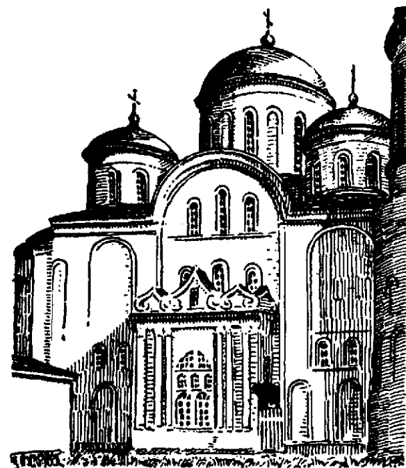
Катедральна церква Преображення Господнього, збудована в Чернігові в 1024-31 рр.

Цих причин є більше, але щодо київської держави, то найважливіші з них такі: географічне положення між Європою й Азією, на межі великих степів — чорноморських і азійських. В цих степах проживали різні мандрівні, войовничі орди; з ними київська держава вела тяжку боротьбу і тим способом охороняла Європу перед ордами; така боротьба остаточно виснажила сили України. В боротьбі з ордами вигинула найхоробріша й найцінні-