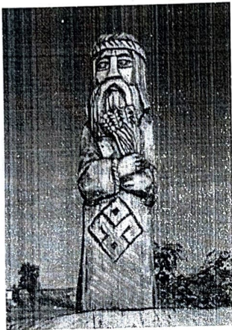
Дажбог. Дерево. Різьблення

Син великого Сварога 1 , славетний Дажбог-Сонце, довгі роки владарював над богами, людьми й над усім світом. Він був родоначальником русинів-українців, першим їхнім князем і незмінним покровителем. Давні українці гордо казали про себе: «Ми — внуки Дажбога, улюбленці богів, ...ми славимо Дажбога, і буде він наш по крові тіла...»