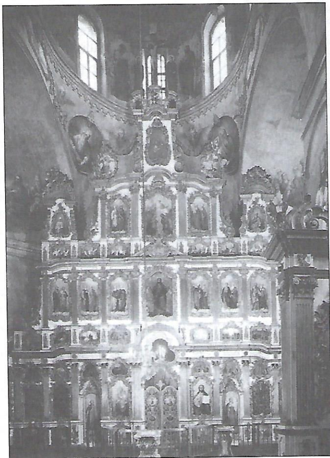
Іконостас у церкві Воздвиження Чесного Хреста Києво-Печерської Лаври.

Іконостас — це стіна або перегородка, покрита іконами, яка відділяє святилище (частину церкви, в котрій знаходиться вівтар) від храму вірних (частину церкви, в якій моляться вірні). Іконостас відокремлює два світи — світ видимий (людини) і світ невидимий (Бога). Він символізує Страшний Суд та історію спасіння людства.