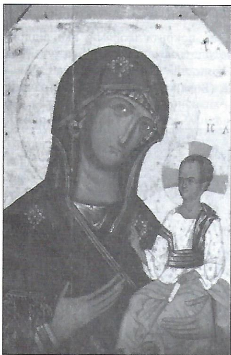
Волинська богоматір. Кінець XIII — початок XV ст.

Найперші ікони виконували енкавстикою, себто восковими фарбами, а сьогодні вживають і олійні фарби.