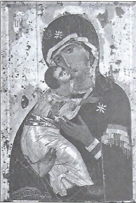
Чудотворна ікона Богородиці вивезена з Вишгорода до Володимира в Росії.

Оскільки українська церква належить до східної — візантійської, гілки християнства і прийняла християнство з Візантії, то в церковному мистецтві України переважає візантійський стиль. Саме він і знайшов відповідь на дуже непросте питання — як же зобразити на іконах Бога та святих, які перебувають на небі. Адже за християнським вченням людське тіло є джерелом гріха й упадку. Виникає потреба зобразити Ісуса Христа, Божу Матір і святих в якихось не зовсім реальних формах, а при цьому передати відчуття високої святости.