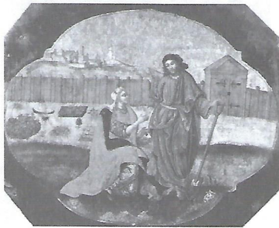
І. Руткович. Ікона Христа з Марією Магдалиною з іконостасу в Жовкві. Кінець XVII ст.

Провідниками в удосконаленні мистецтва іконопису були Іван Руткович та Йов Кондзелевич , які вважаються найвидатнішими українськими малярами XVII й початку XVIII ст. І хоча їхні ікони не позбавлені релігійної містики, вони вже далекі від традиційної візантійської ікони, в якій усе було одухотворене, “не цього світу”. Постаті на іконах Кондзелевича, наприклад, зображені майже зовсім реалістично, а розмаїття кольорів таке широке, що колір уже не є виключно функцією релігійної символіки, а є і засобом для оживлення ікони. Знавці ікон вважають, що українські іконописці того часу зайшли так далеко у використанні барокових манер, що аж надто віддалились від суті ікони. Але це вже був останній злет українського іконопису. Йому поклала кінець політика російської влади і Церкви, що була спрямована на знищення самостійних проявів українського мистецтва. З кінцем XVIII ст. право малювати церковні твори мали тільки мистці, виховані в Росії.