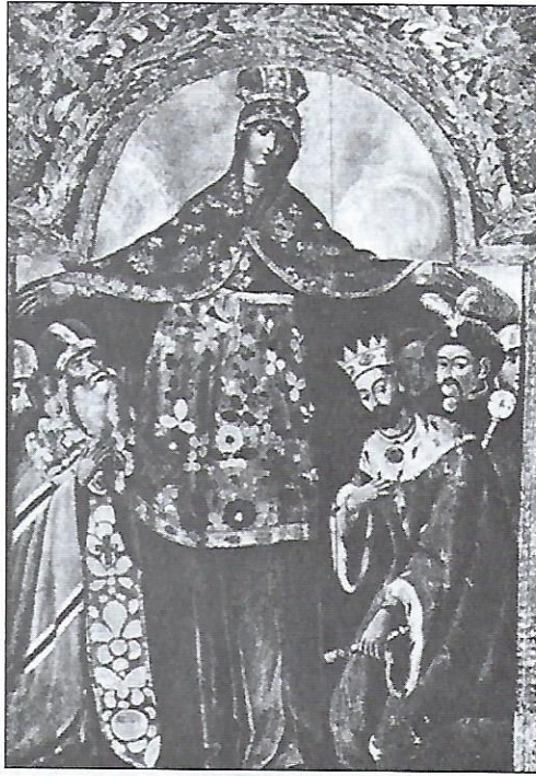
Невідомий мистець, Покрова з портретом гетьмана Б. Хмельницького. Кінець XVII ст.

Малярство XVII-XVIII ст. перебувало під впливом барокового стилю. Особливістю барокко є його пишна декоративність, закоханість в драматичних ефектах і гостре контрастування світла й тіні. Під впливом творчості таких малярів як Рубенс і Рембрандт, образ набув вищої якості, глибших деталей і повнішого реалізму. Усі ці зміни стали можливими завдяки появі олійного фарбування.