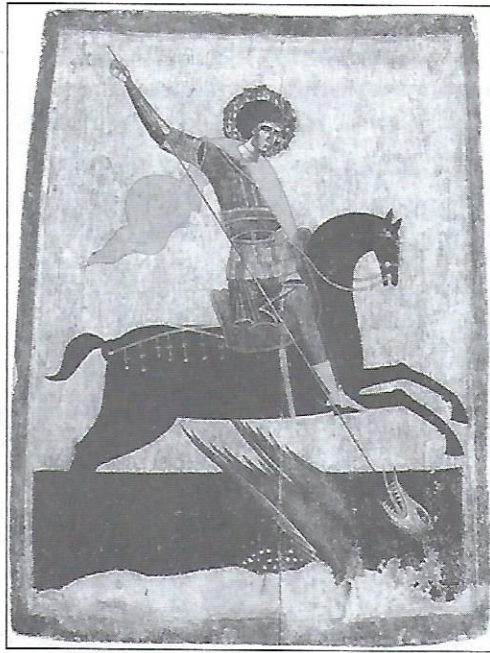
Ікона св. Юрій Зміборець з церкви в Станілі, XIV ст.

Майже до кінця XVIII ст. найважливіше місце в українському малярстві займало церковне малярство, адже церква й релігія відігравали центральну роль в житті суспільства тих часів. Широко розвивався тоді іконопис, і, взагалі, цей період можна вважати вершиною розвитку української ікони.