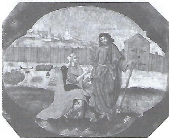
І. Руткович. Ікона Христа з Марією Магдалиною з іконостасу в Жовкві. Кінець XVII ст.

Провідниками в удосконаленні мистецтва іконопису були Іван Руткович та Йов Кондзелевич , які вважаються найвидатнішими українськими малярами XVII й початку XVIII ст. І хоча їхні ікони не позбавлені релігійної містики, вони вже далекі від традиційної візантійської ікони, в якій усе було одухотворене, “не цього світу”. Постаті на іконах Кондзелевича, наприклад, зображені майже зовсім реалістично, а розмаїття кольорів таке широке, що колір уже не є виключно функцією релігійної символіки, а є і засобом для оживлення ікони. Знавці ікон вважають, що українські іконописці того часу зайшли так далеко у використанні барокових манер, що аж надто віддалились від суті ікони. Але це вже був останній злет українського іконопису. Йому поклала кінець політика російської влади і Церкви, що була спрямована на знищення самостійних проявів українського мистецтва. З кінцем XVIII ст. право малювати церковні твори мали тільки мистці, виховані в Росії.