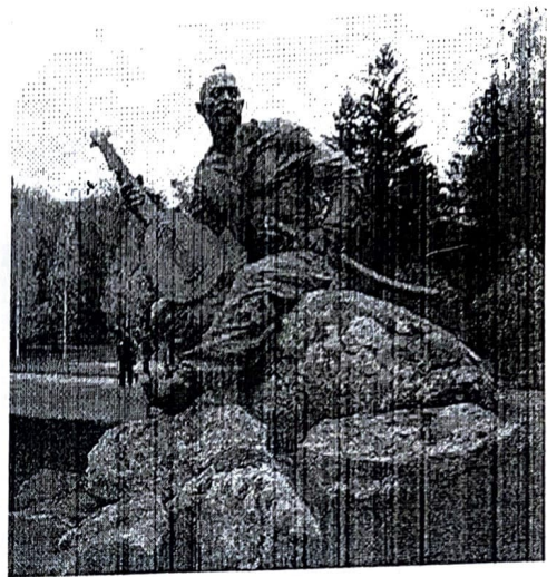
▲ Пам'ятник козаку Мамаю, м. Кривий Ріг (скульптор Володимир Токар)

У пісні «Ой на горі та женці жнуть» надзвичайно романтично відтворено проводи козаків. Поки селяни збирають урожай, долиною марширує Військо Запорозьке. Козаки жартома спокушають досвідченого отамана повернутися до родинного затишку, але йому козацьке життя миліше. Він розуміє, що сильні мають захищати свій народ. У творі відчутно велику повагу до козаків і їхніх ватажків. Пісня ритмічна, енергійна, адже під неї марширувало військо.