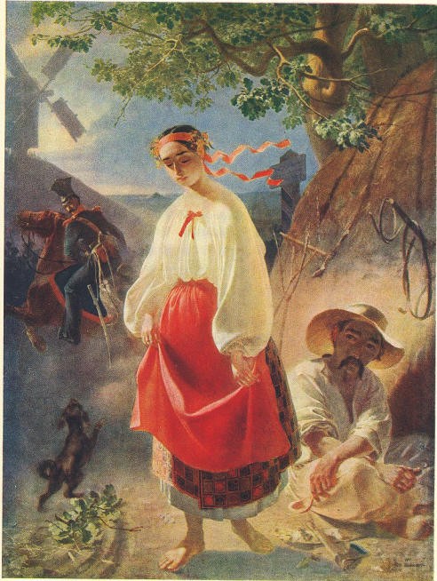
38. КАТЕРИНА. О. Айвазовский. [Лито] 1842.