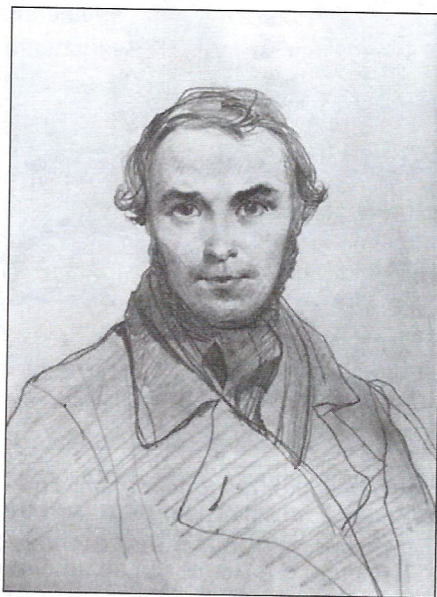
Т. Шевченко, автопортрет, 1845 р.