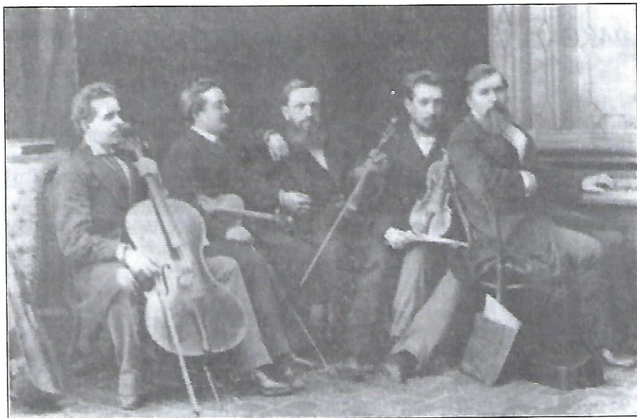
Квартет, організований М. Лисенком. Справа наліво: М. Лисенко, О. Шевчик, І. Солуха, О. Косухін, В. Алоїз. Кінець 1870 років.

Лисенко ставив собі за головну мету створити національну школу (стиль) української музики, як це зробили для своїх народів Е. Гріг (для норвежців), Ж. Сібеліус (для фінляндців), С. Монюшко (для поляків), Б. Сметана (для чехів), М. Глінка (для росіян) і т. д. Усі вони, перебуваючи під впливом ідей романтизму, компонували твори класичної музики на основі або в дусі народної музики власного народу.