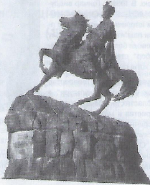
Пам'ятник Богданові Хмельницькому в Києві.

своє життя в ліпших умовах. Цей процес відбувався і на східній, і на західній Україні. В 1960-их рр. виробництво України дуже зросло й радо приймало нових робітників, які приходили зі сіл. Також ішов процес розбудови житлових будинків, що дещо затирало житлову кризу. Урбанізація також сприяла приїзду сотень тисяч росіян, які охоче залишилися в Україні на постійний побут.