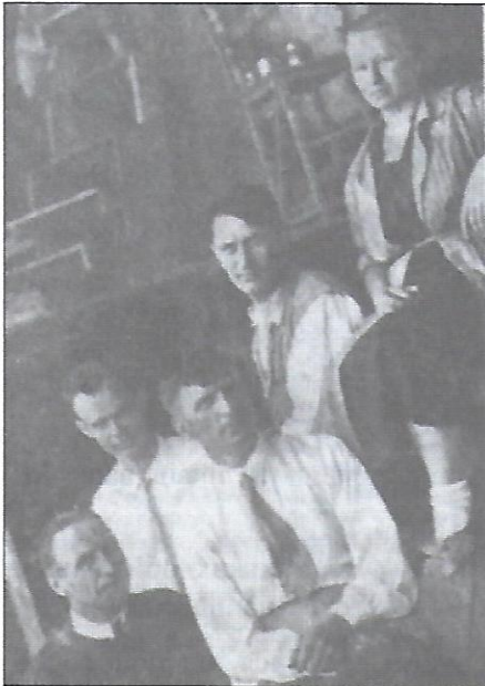
М. Бойчук, К. Гвоздик, І. Падалка, В. Седляр, М. Юнак. 1933-1935 рр.

колись малювали українські мистці. Цим він створив нову течію в мистецтві з глибоким корінням в національних українських традиціях.