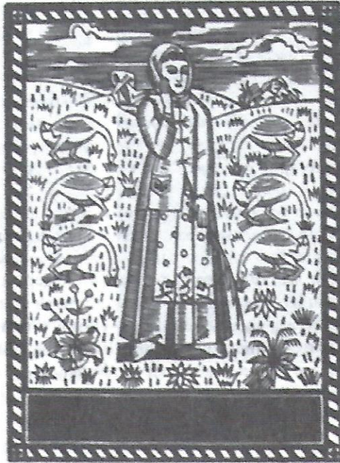
Михайло Бойчук. Пастушка. 1910-ті роки.

Уявіть, що ви мистець і що ваші друзі-мистці звернулись до вас створити мистецьке об'єднання. У цій вправі ви маєте завдання написати маніфест (платформу), в якій викладені головні ідеї вашого об'єднання. Тут слід заторкнути такі питання: що ви вважаєте метою мистецтва? Якій тематиці ви даєте перевагу? який стиль характеризує вашу творчість? В кінці придумайте назву і намалюйте символ вашого мистецького об'єднання.