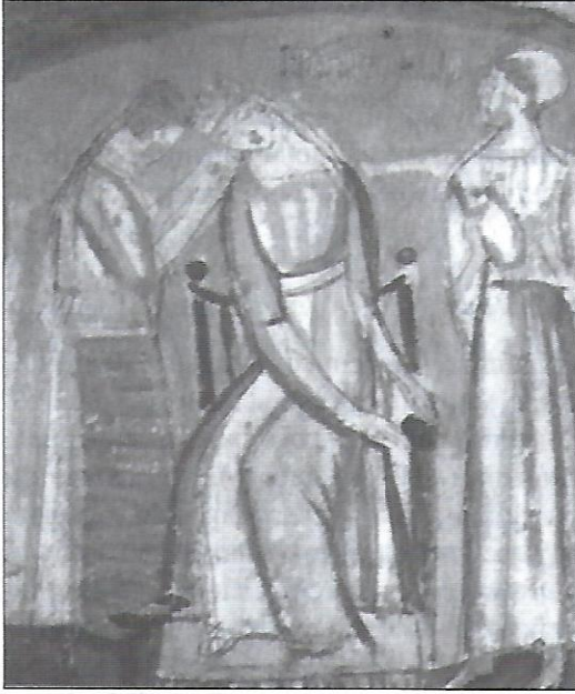
М. Бойчук. Плач Ярославни, ескіз.