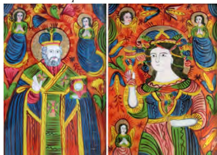
Хатні ікони на склі святих Миколая і Варвари