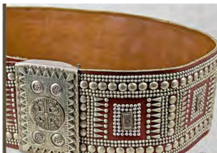
Чѐрес — гуцульський чоловічий шкіряний пояс