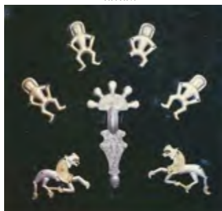
Срібні скитські бляшки