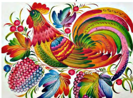
Петриківський розпис на стіні