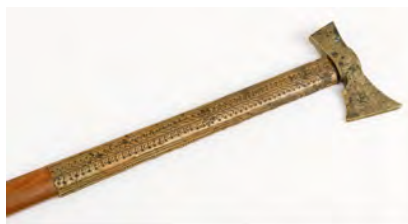
Топірець (гравіювання по металу)