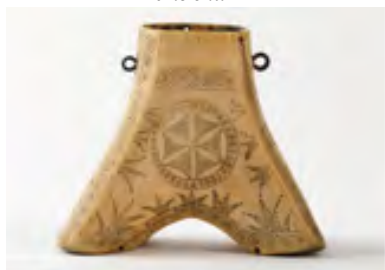
Порохівниця з рогу