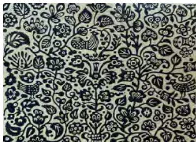
Полтавська вибійка на полотні фарбою