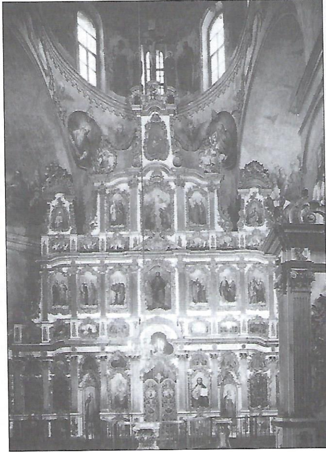
Іконостас у церкві Воздвиження Чесного Хреста Києво-Печерської Лаври.

Іконостас — це стіна або перегородка, покрита іконами, яка відділяє святилище (частину церкви, в котрій знаходиться вівтар) від храму вірних (частину церкви, в якій моляться вірні). Іконостас відокремлює два світи — світ видимий (людини) і світ невидимий (Бога). Він символізує Страшний Суд та історію спасіння людства.