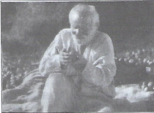
Кадр з фільму "Земля".

хідливість в створенні різноманітних ефектів за допомогою нестандартного освітлення, викривлення картин тощо.