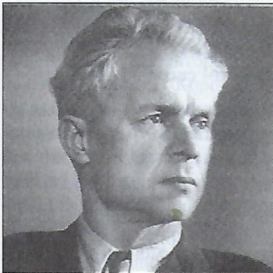
Кінорежисер Олександр Довженко

Найвизначнішими фільмами 1920-их років були ті, що мали історичну тематику або базувались на творах українських письменників. До них належать (усі ще німі): фільми І. Кавалерідзе "Злива" (на мотиви Шевченкової поеми "Гайдамаки"), "Перекоп" і "Коліїщина", фільми П. Чардиніна "Тарас Шевченко", "Тарас Трясило" й "Укразія", та фільми О. Довженка "Звенигора", "Арсенал", "Земля", "Іван". Майже всі ці фільми зазнали гострої критики з боку радянських властей за своє "націоналістичне спрямування", "формалізм" і "недостатню увагу до комуністичного виховання населення".